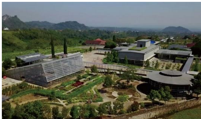
Gambar 3. Foto Lokasi PT. Rumah Atsiri Indonesia