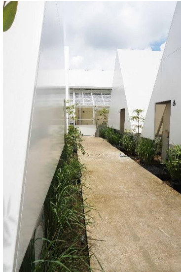
Gambar 10. Rumah Atsiri Glamping

esensial, obat herbal, dan pengobatan alami sambil menikmati pemandangan langsung dari alam.