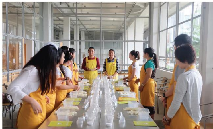
Gambar 5. Kelas Edukasi Rumah Atsiri

Kelas Edukasi menaarkan aktifitas kursus dan penelitian terkait minyak atsiri. Kelas Edukasi terdiri dari rumah atsiri lab, workshop rumah atsiri, rumah pelatihan rumah atsiri, museum Rumah Atsiri.