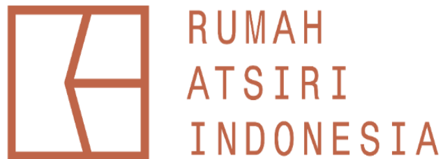
Gambar 2. Logo PT. Rumah Atsiri Indonesia