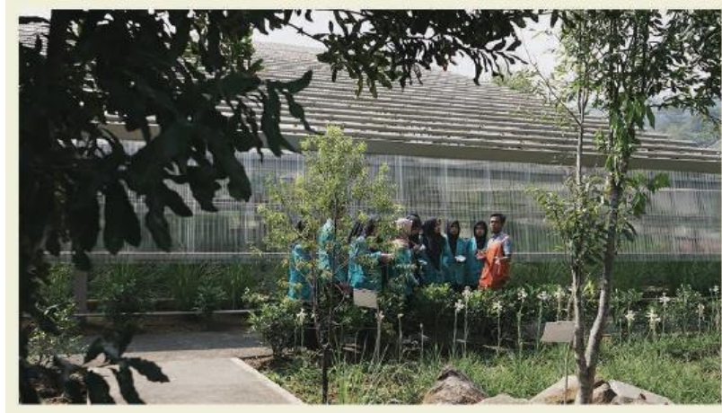
Gambar 4. Area Taman Atsiri Sumber (Rumahatsiri.com, 2018)

dibagi menjadi 5 bagian yaitu taman atsiri, rumah atsiri rumah kaca, rumah atsiri kebun, plasa marigold, rumah atsiri pembibitan.