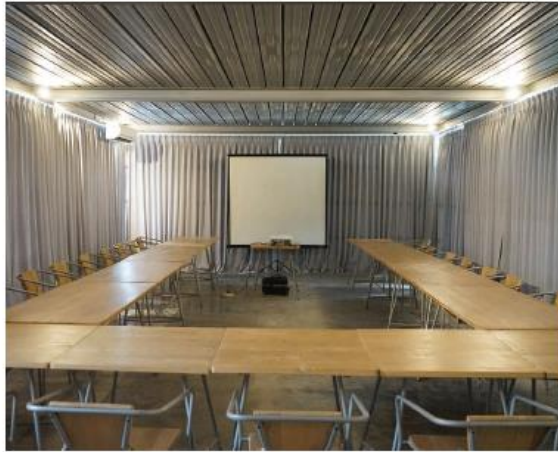
Gambar 9. Ruang Meeting Rumah Atsiri

MICE (Meeting, Incentive, Convention, and Exhibition) Teater Palmarosa, Ruang Meeting.