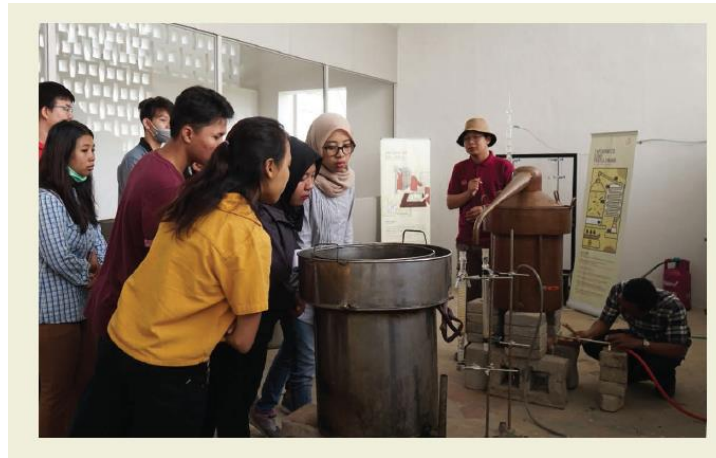
Gambar 6. Museum Rumah Atsiri

Museum rumah atsiri berdiri di dalam kompleks Rumah Atsiri yang memberikan edukasi tentang minyak atsiri secara interaktif. Museum rumah atsiri tidak hanya menjelaskan tentang sejarah tetapi juga melestarikan peralatan untuk menghasilkan minyak atsiri. Museum Rumah atsiri terdiri dari perpustakaan rumah atsiri, area destilasi rumah atsiri dan pusat penelitian dan pengembangan.