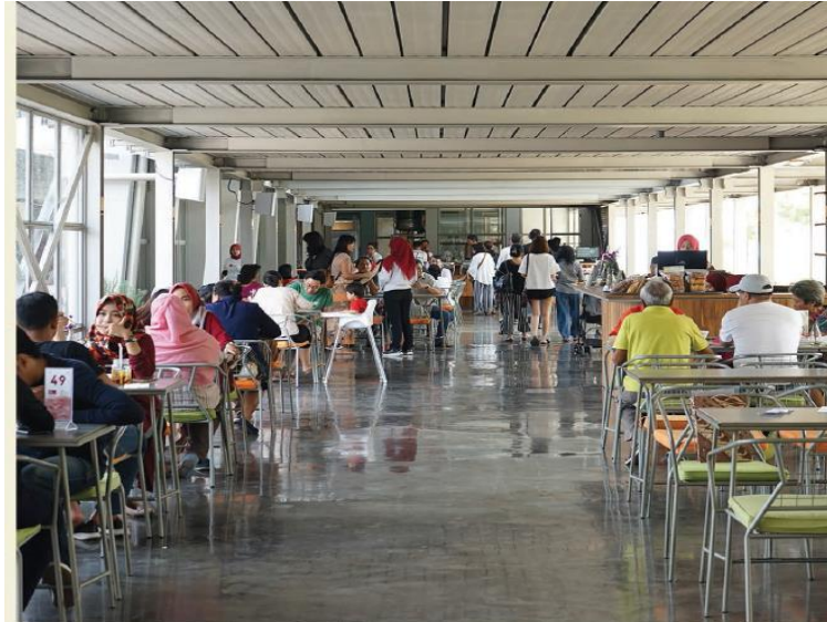
Gambar 7. Rumah Atsiri Resto Sumber (Rumahatsiri.com, 2018)