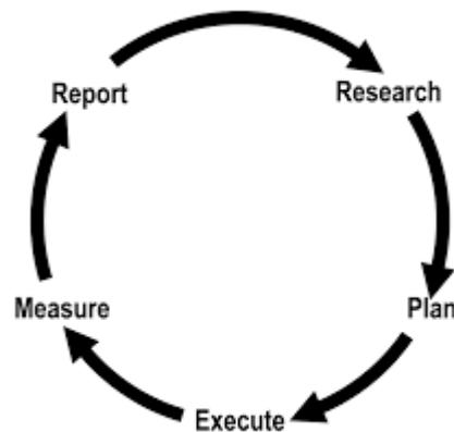
Gambar 2.1 Model Komunikasi Lima Langkah

Model perencanaan komunikasi yang digunakan dalam penelitian ini adalah model komunikasi lima langkah menurut Cangara (2013). Model perencanaan komunikasi lima langkah terdiri dari : Penelitian ( research ), Perencanaan ( plan ), Pelaksanaan ( execute ), Pengukuran/Evaluasi ( measure ), Pelaporan ( report ). Adapun pengertian model komunikasi lima langkah tersebut, yaitu :