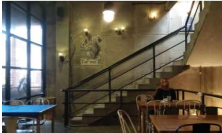
Gambar 44. Coworking Space Smoking Area