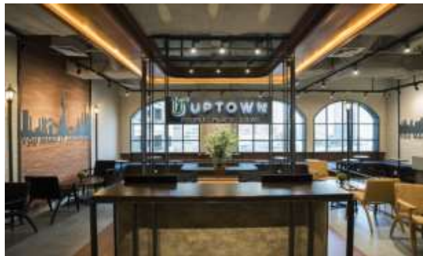
Gambar 35. Virtual Office

Uptown adalah penyedia ruang kantor berkonsep hybrid yakni menggabungkan antara ruang terbuka ala Coworking Space dan tertutup ala Private Office dalam satu area. Coworking Space Uptown hadir dengan mengambil tema desain Manhattan, New York yang dibawa ke Indonesia. Uptown adalah Coworking Space yang berfungsi sebagai service office , pemilik Uptown sendiri yaitu Salim Group dan mencoba untuk mengcater perusahaan rintisan atau startup, komunitas, hingga perusahaan teknologi untuk berkantor di kawasan strategis, Jakarta. (Yusra, 2018)