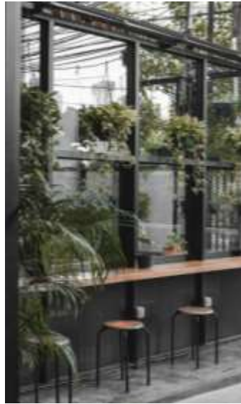
Gambar 34. Ruang Outdoor Diskusi Kopi dan Ruang Diskusi