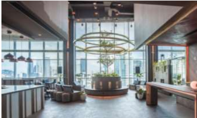
Gambar 38. Lobby green house