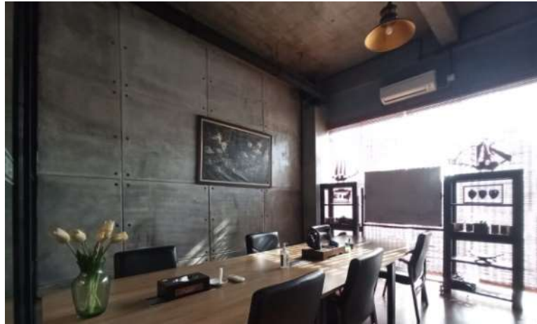
Gambar 46. Ruang Meeting

Ruang Meeting akan di tata ulang untuk pemanfaatan ruang dengan desain meja yang lebih simple namun terkesan rapi. Penambahan rak cukup penting disini karena akan digunakan untuk menyimpan barang, dan dibutuhkan proyektor untuk menampilkan beberapa dokumen pada saat meeting / bekerja. Penambahan aksesoris dekorasi di dalam ruangan dilakukan untuk menghilangkan suasana bosan pada ruangan. Pemilihan warna putih bertujuan memberikan kesan luas dan nyaman pada ruangan.