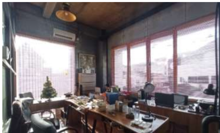
Gambar 47. Ruang Office

Ruang Meeting akan di tata ulang untuk pemanfaatan ruang dengan desain meja yang lebih simple namun terkesan rapi. Penambahan rak cukup penting disini karena akan digunakan untuk menyimpan barang, dan dibutuhkan proyektor untuk menampilkan beberapa dokumen pada saat meeting / bekerja. Penambahan aksesoris dekorasi di dalam ruangan dilakukan untuk menghilangkan suasana bosan pada ruangan. Pemilihan warna putih bertujuan memberikan kesan luas dan nyaman pada ruangan.