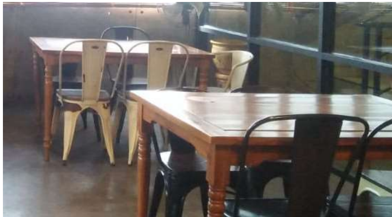
Gambar 50. Furniture Lantai 2

Furniture yang digunakan di lantai 1 Dodolan Coffee sebagian materialnya adalah kayu, kemudian ruang ini akan didesain dengan furniture yang sesuai dengan konsep dan kebutuhannya serta pada standar ergonomi.