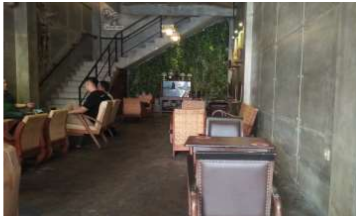
Gambar 43. Ruang Coffee and Space

Ruang Coffee Bar ini adalah tempat yang paling sering dikunjungi orang setiap harinya, banyak orang yang datang untuk bekerja atau hanya sekedar bersantai dan mengobrol dengan teman atau pengunjung lain. Ruang ini akan didesain dengan memaksimalkan fungsi ruangan, sehingga mendapatkan kesan rapi. Hal ini dilakukan karena Natural Industrial menciptakan suasana yang tenang dan hangat. Pencapaian konsepnya dilakukan dengan pemakaian material berupa kayu. Warna yang digunakan adalah warna-warna netral untuk memberikan kesan sederhana tetapi tetap rapi namun tidak kaku.