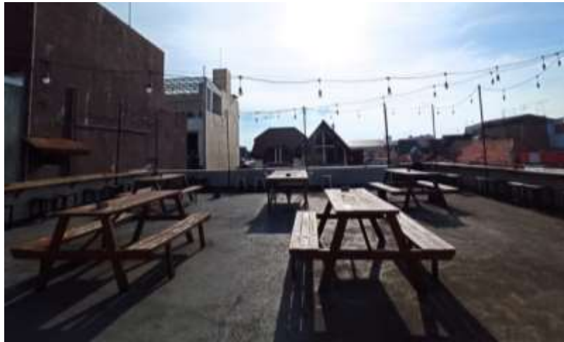
Gambar 48. Art Space / Rooftop

Pada Ruang Office beberapa komponen dinding akan di desain dengan perncahayaannya alami dengan bentuk geometris untuk tetap memberikan kesan industrial pada ruangan. Penambahan rak cukup penting karena akan digunakan untuk menyimpan dokumen yang bersifat penting.