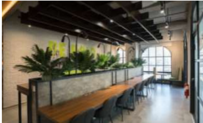
Gambar 36. coworking Space