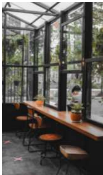
Gambar 33. Ruang Indoor Diskusi dan Ruang Berbagi

Diskusi Kopi dan Ruang Berbagi adalah coffee shop bertema industrial natural yang berlokasi di Jl. Kawi Raya no 18 Setiabudi Jakarta Selatan. Coffe shop yang menyajikan tempat yang nyaman tidak hanya sekedar untuk menikmati kopi, tetapi dapat berdiskusi, bercengkrama, membaca buku, dan kegiatan lain yang mengesankan di diskusi kopi dan ruang berbagi. (Ringkasan Pergikuliner, 2021)