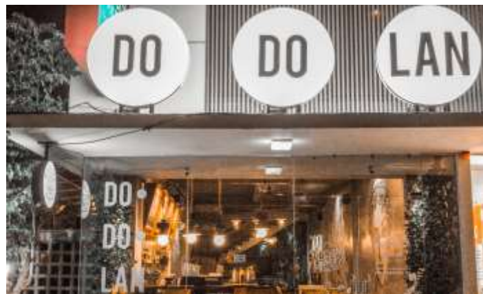
Gambar 41. Tampak Depan Dodolan Coffee

Dibawah ini terdapat analisis data beberapa ruangan pada Dodolan Coffee. Konsep industrial yang akan digunakan untuk Dodolan Coffee. Ruang atau bangunan tidak akan dirubah, namun ruang-ruang tersebut akan dimaksimalkan fungsinya agar seluruh di dalam dodolan coffee dapat terpenuhi dengan baik.