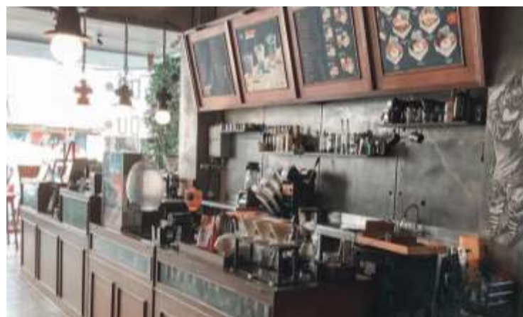
Gambar 42. Coffee Bar

Tampak depan dodolan coffee dengan pilihan warna monokrom yang adalah ciri khas dodolan coffee.