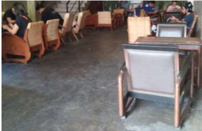
Gambar 49. Furniture Lantai 1

Furniture yang digunakan di lantai 1 Dodolan Coffee sebagian materialnya adalah kayu, kemudian ruang ini akan didesain dengan furniture yang sesuai dengan konsep dan kebutuhannya serta pada standar ergonomi.