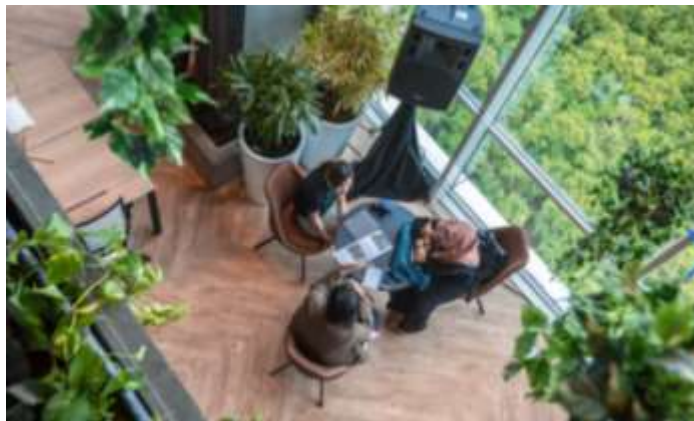
Gambar 39. Lantai 1 green house