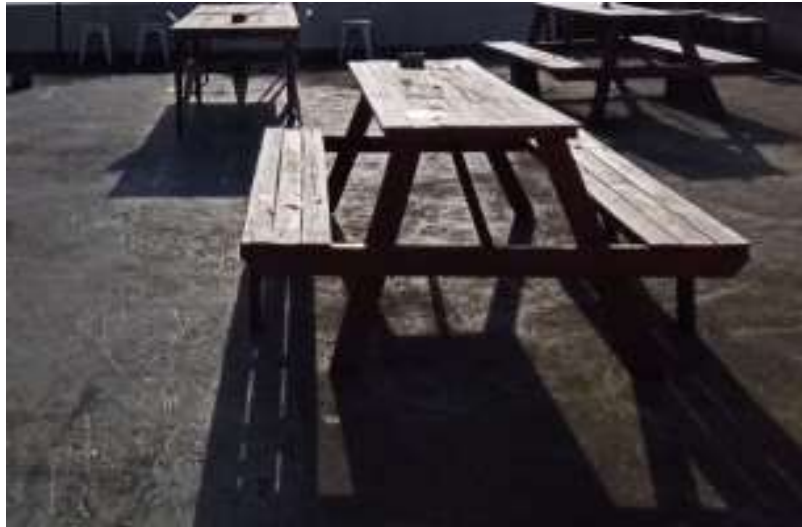
Gambar 51. Furniture Lantai 3

Furniture yang digunakan di lantai 3 Dodolan Coffee sebagian materialnya kayu yang mudah lapuk dan tidak tahan panas dan air hujan, kemudian ruang ini akan didesain dengan furniture dengan material kayu yang tahan panas dan tahan hujan sehingga jangka waktu furniture tersebut akan bertahan lama serta akan didesain sesuai dengan konsep dan kebutuhannya serta pada standar ergonomi.