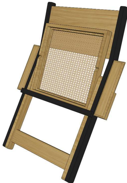
Gambar 36. Desain Alternatif 2