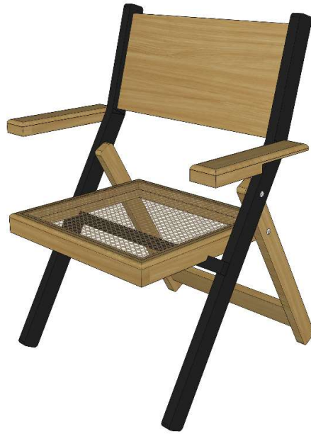
Gambar 35. Desain Alternatif 2