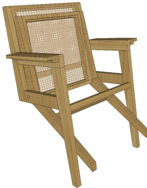
Gambar 34. Desain Alternatif 1