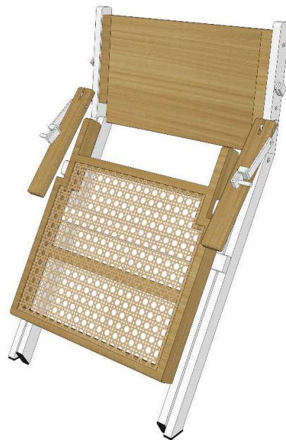
Gambar 38. Desain Alternatif 3