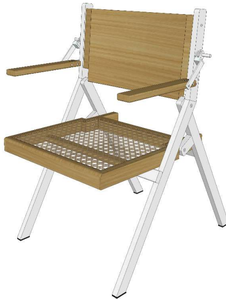
Gambar 39. Desain Terpilih