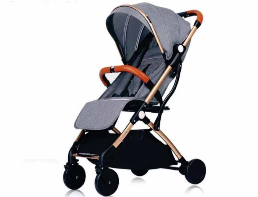
Gambar 32. Kereta Bayi Lipat

Konsep yang dipakai adalah konsep Portable folding , Konsep ini memiliki ciri khas bisa dilipat dan bentuk ringkas. Kursi ini bernama Gampsek (Gampil lan Sekeco) nama itu sendiri berasal dari dua kata bahasa jawa, yaitu “ Gampil ” dan “ Sekeco ”. Kata Gampil dalam kamus bahasa Jawa-Indonesia memiliki arti gampang atau mudah, dan kata Sekeco dalam kamus bahasa Jawa-Indonesia yang memiliki arti aman atau nyaman. Sehingga nama kursi Gampsek memiliki filosofi arti sebuah kursi lipat yang mudah dan nyaman saat digunakan. Untuk finishing disini penulis memadukan dua warna yaitu warna natural kayu dan rotan beserta warna putih pada bagian rangka utama, bertujuan untuk menciptakan kesan Futuristik. Kursi Gampsek secara konsep bentuk terinspirasi dari kereta bayi lipat, ketika saat sedang tidak digunakan kereta bayi bisa dilipat sehingga tidak memakan banyak tempat dan pada saat dibawa ke suatu tempat, pengguna lebih nyaman pada saat membawa.