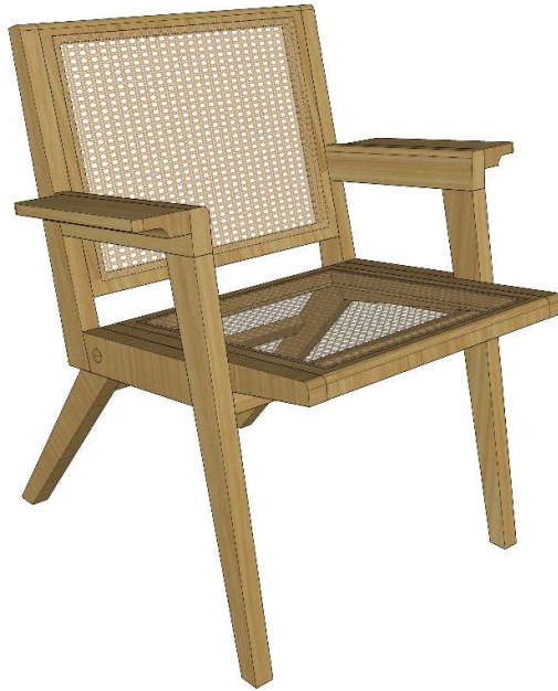
Gambar 33. Desain Alternatif 1