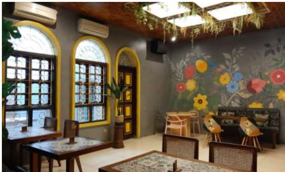
Gambar 32 : Ceilling & Interior Burjo Borju VIP