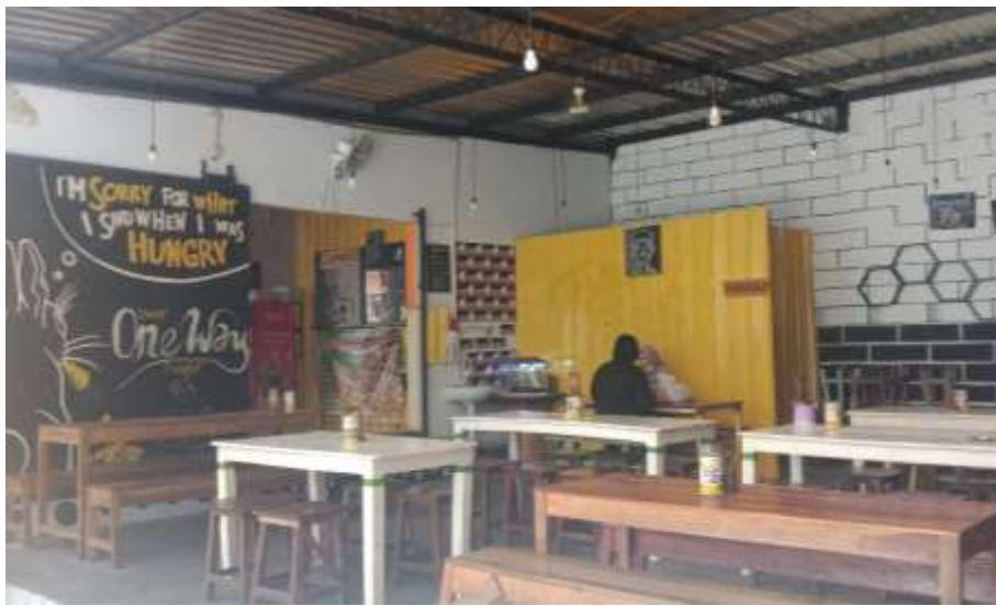
Gambar 35 : Ruang Makan Burjo One Way

Warung makan burjo One Way ini memiliki ciri khas pada interiornya yaitu adanya mural disetiap outlet nya mulai dari cabang pertama sampai keempat. Pengaplikasian warna-warna terang seperti kuning, orange dan hijau juga menjadi ciri khas dari warung makan burjo One Way . Pada ruang makan burjo One Way memakai meja dan kursi tanpa sandaran yang sederhana.