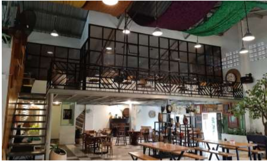
Gambar 28 : Ruang Makan Burjo Polopes Solo