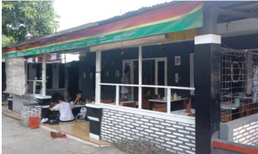
Gambar 40 : Area Makan Depan Burjo One Way 2