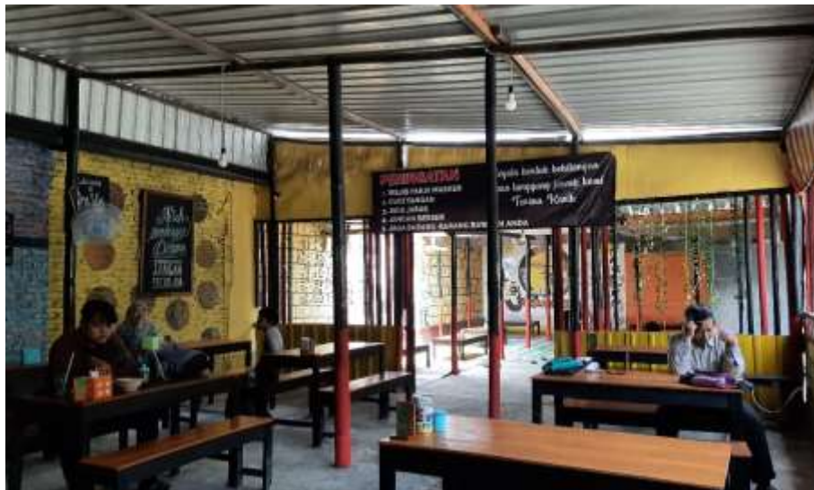
Gambar 42 : Ruang Makan Burjo One Way Sadulur 3

Terdapat 2 ruang makan yang ada pada Burjo One Way Sadulur 3, yang pertama ada pada bagian depan yaitu meja makan dengan kursi tanpa sandaran dan pada ruangan kedua ada pada bagian belakang yaitu ruang makan dengan konsep lesehan yang menggunakan meja dan tiker.