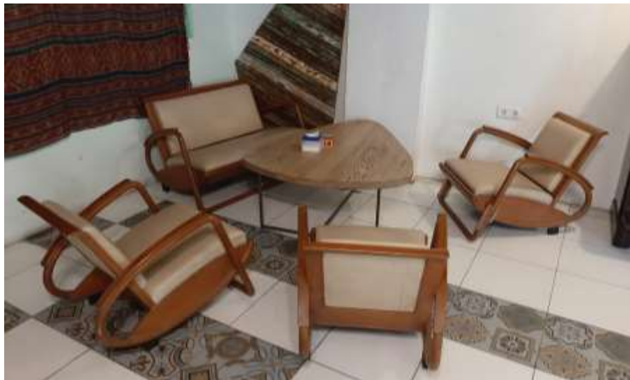
Gambar 27 : Furniture Burjo Polopes Solo (Sumber : Dokumen Pribadi)

Warung makan burjo satu ini memiliki konsep klasik yang dipadupadankan dengan konsep industrial. Konsep klasik yang diterapkan dapat dilihat dari pemilihan furniture dan beberapa pemilihan Elemen Estetis (penghias ruangan). Konsep industrial dapat dilihat pada ceilling yang dimana terlihat besi expose, furniture yang memakai bahan material besi dan kayu, serta dapat dilihat dari penggunaan lantai semen pada lantai dua warung makan burjo Polopes Solo ini.