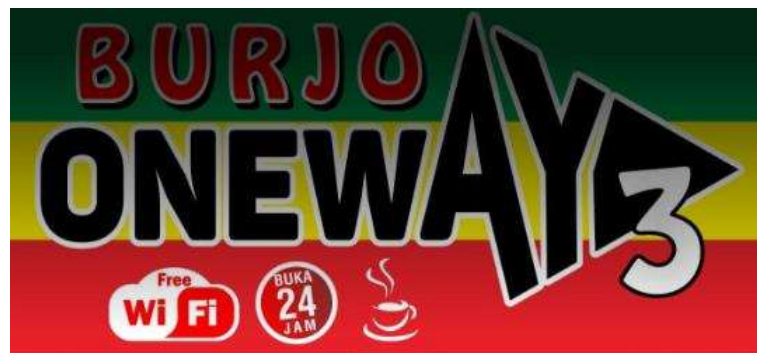
Gambar 24 : Logo Burjo One Way Sadulur 3