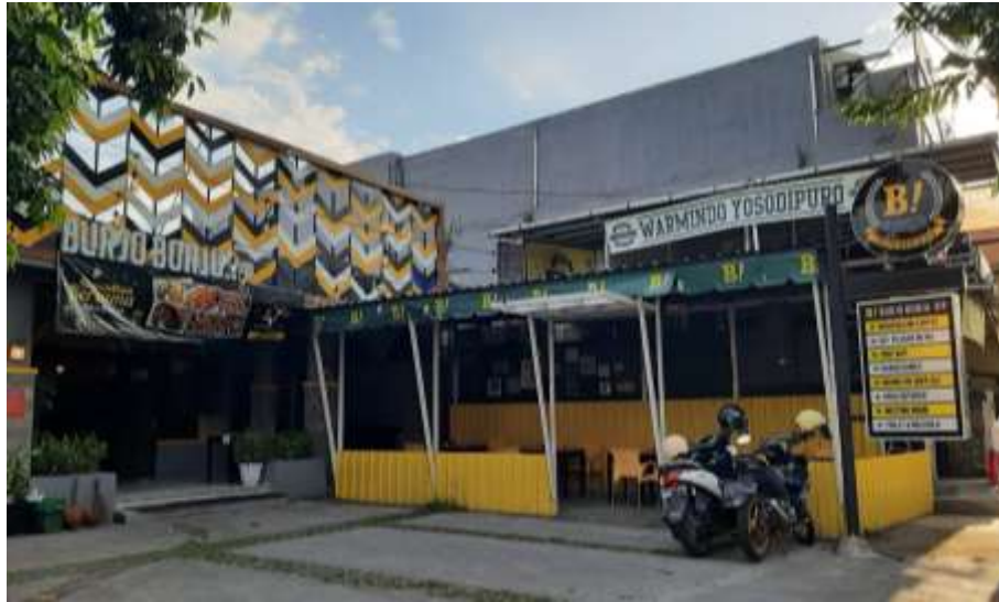
Gambar 31 : Tampak Depan Burjo Borju VIP