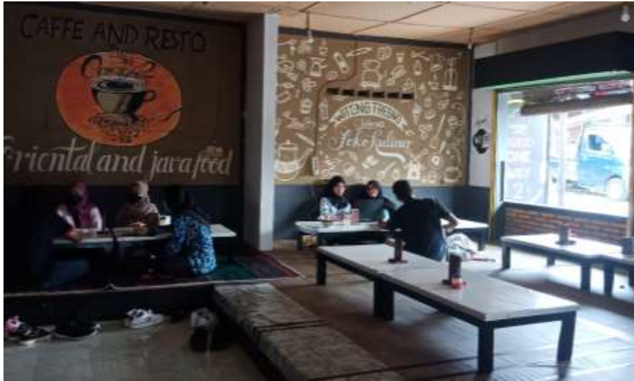
Gambar 38 : Area Lesehan Burjo One Way 2