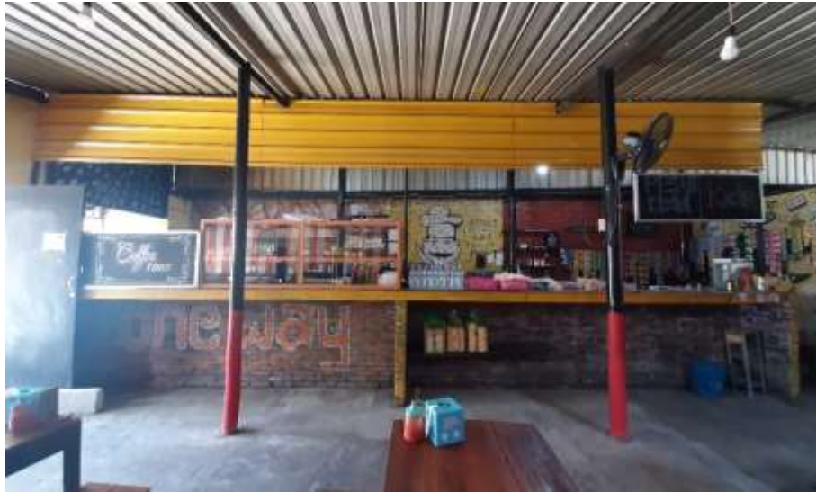
Gambar 45 : Pencahayaan Kitchen, Kasir dan Ruang Makan Depan Burjo One Way Sadulur 3