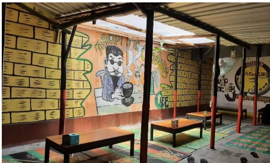
Gambar 44 : Ceiling Fiber Burjo One Way Sadulur 3

Pencahayaan yang digunakan pada Burjo One Way Sadulur 3 pada siang hari menggunakan pencahayaan alami yang dipancarkan dari jendela-jendela lebar, pintu yang terbuka dan pada ceiling yang memakai fiber. Pada sore hingga malam hari pencahayaan menggunakan pencahayaan buatan yakni menggunakan lampu bohlam led.