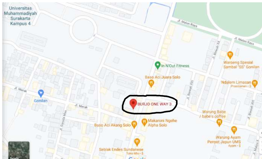
Gambar 26 : Lokasi Burjo One Way Sadulur 3