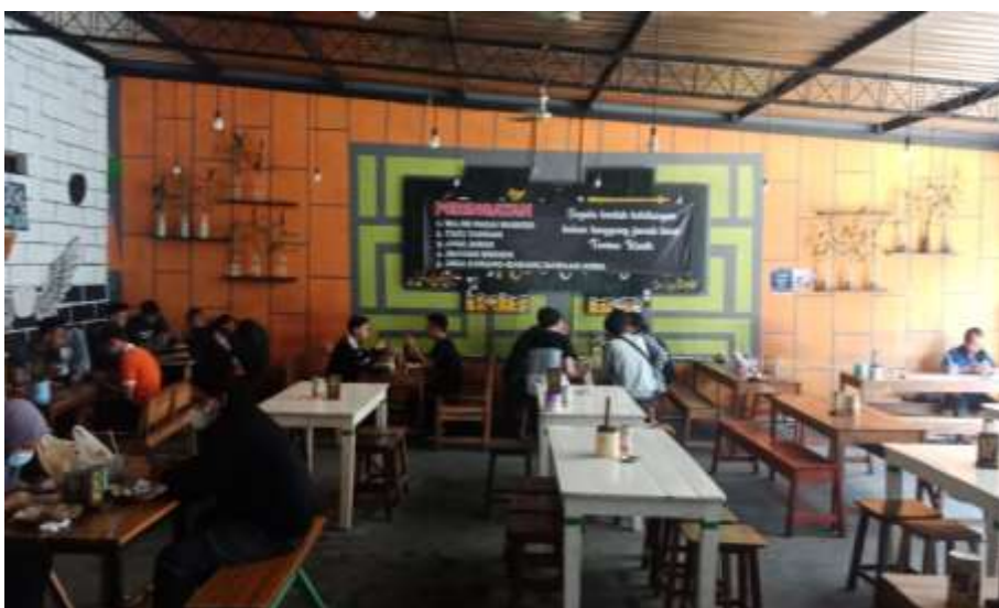
Gambar 36 : Ruang Makan Burjo One Way