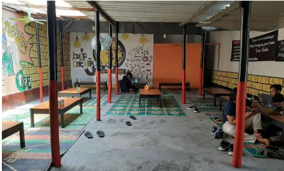
Gambar 43 : Ruang Makan Lesehan Burjo One Way Sadulur 3