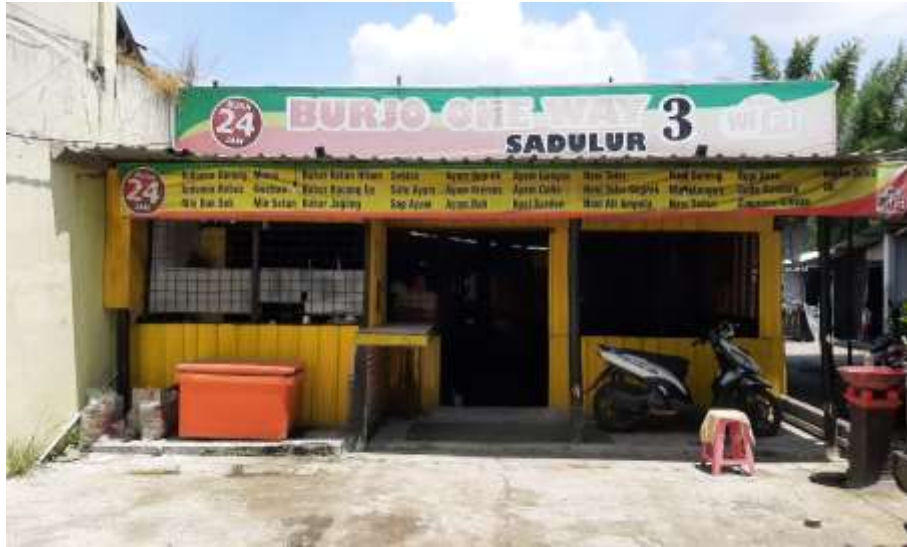
Gambar 41 : Fasad Depan Burjo One Way Sadulur 3