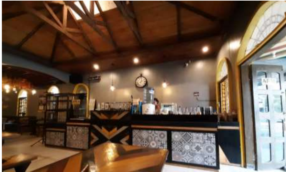
Gambar 33 : Kasir Burjo Borju VIP