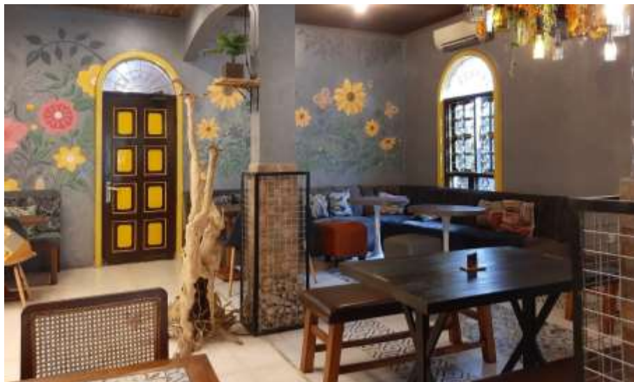
Gambar 34 : Furniture Burjo Borju VIP