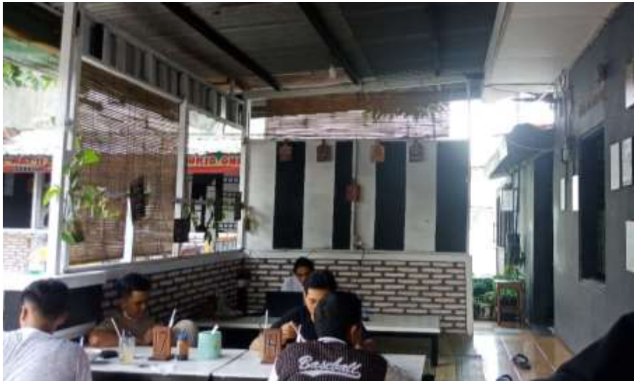
Gambar 39 : Area Lesehan Depan Burjo One Way 2