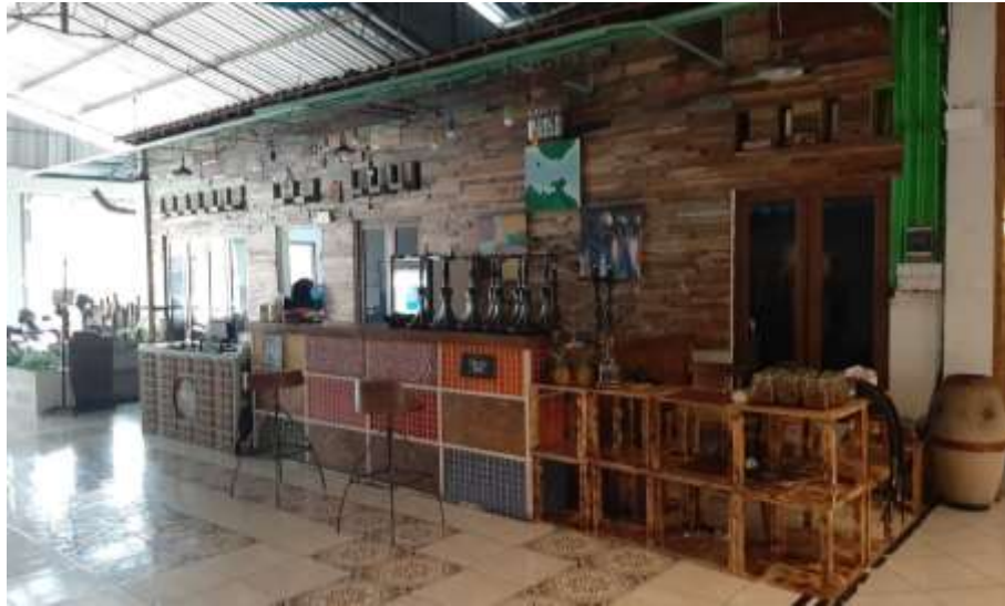
Gambar 30 : Kasir Burjo Polopes Solo