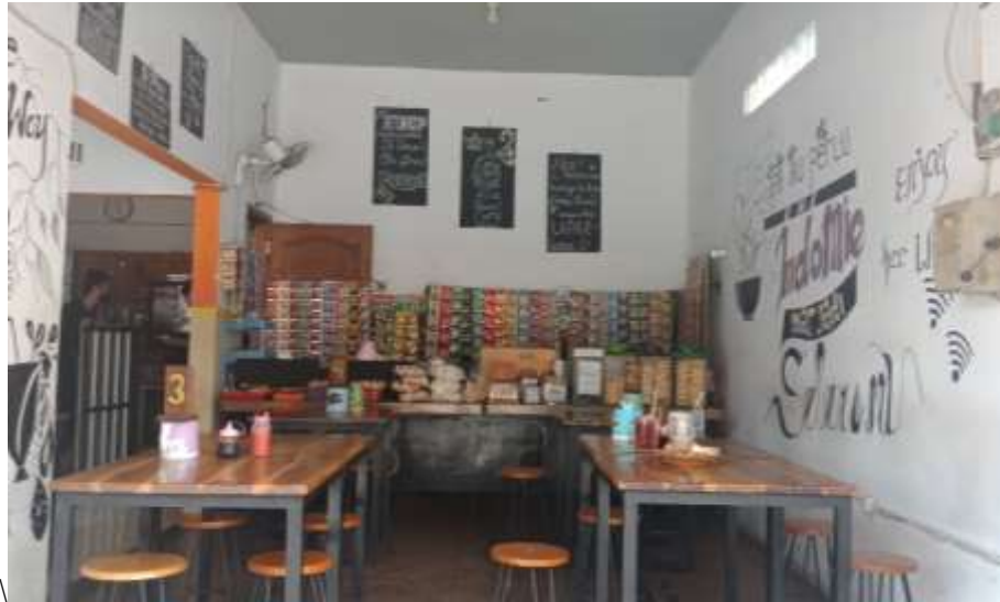
Gambar 37 : Area Depan Burjo One Way