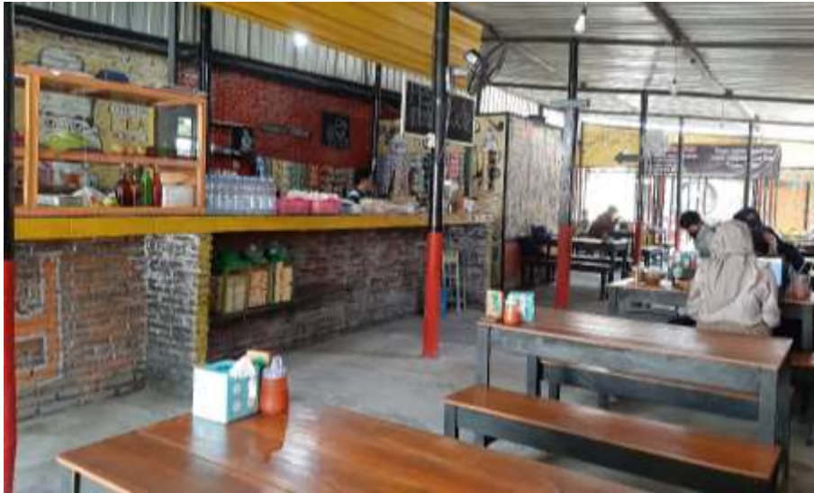
Gambar 47 : Furniture Burjo One Way Sadulur 3

Furniture adalah pelengkap ruangan yang mencakup hampir seluruh barang yang ada, seperti kursi, meja dan etalase. Pada penggunaan bahan utama furniture sebagian besar menggunakan bahan utama yakni kayu yang difinishing natural dengan kaki yang difinishing cat doff.