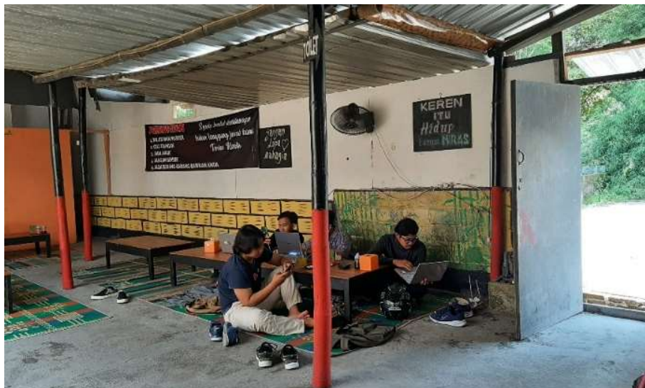
Gambar 46 : Penghawaan Burjo One Way Sadulur 3

Penghawaan pada Burjo One Way Sadulur 3 menggunakan penghawaan alami dan buatan. Penghawaan alami didapatkan dari banyaknya pintu dan jendela-jendela yang terbuka, sedangkan penghawaan buatan didapatkan dari kipas angin yang ada di beberapa titik ruangan warung makan burjo.