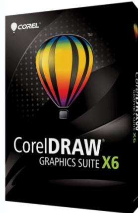
Gambar. 03 Software Corel Draw X6 www. google.com/Corel Draw X6

Corel Draw x6 ini digunakan dalam proses perancangan notes book serta perancangan media mini x – Banner.