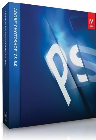
Gambar. 02 Software Adobe Photoshop Cs 6 www. google.com/ Adobe Photoshop Cs 6

Software Adobe Photoshop ini berperan untuk editing foto maupun ilustrasi yang akan dimuat dalam notes book .