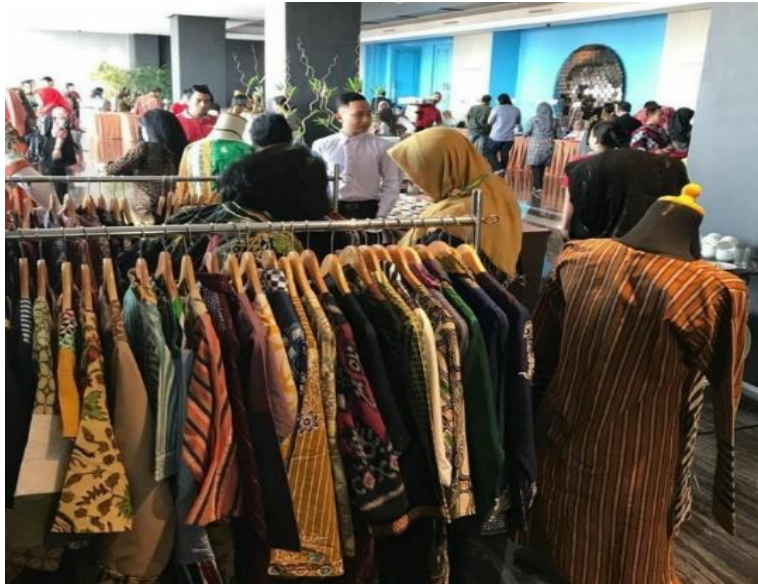
Gambar 17. Pameran Butik Widiana Batik Solo

Butik ini juga memiliki pelanggan tetap karena butik tersebut sudah tak asing lagi bagi di telinga para penggemar koleksi pakaian batik sehingga mampu mengikat daya tarik tersendiri bagi para pelanggan baru untuk melihat kualitas yang ada di butik ini dengan ciri khas yang ada. Butik ini juga mempunyai harga sesuai dengan kualitas yang dimilikinya dan sangat terjangkau untuk para pelanggan atau pengunjung untuk menengah kebawah.