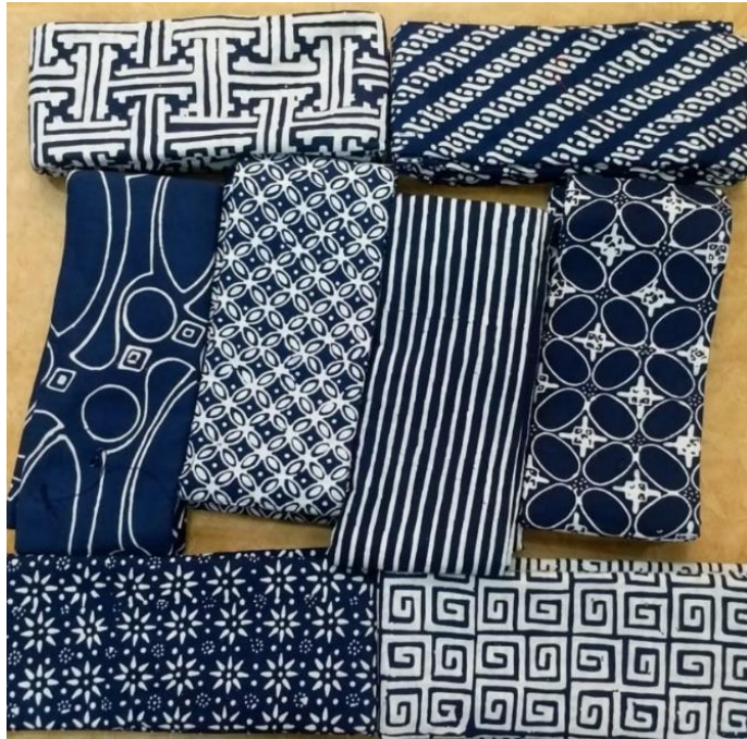
Gambar 12. Kain Batik Cap Butik Widiana Batik Solo