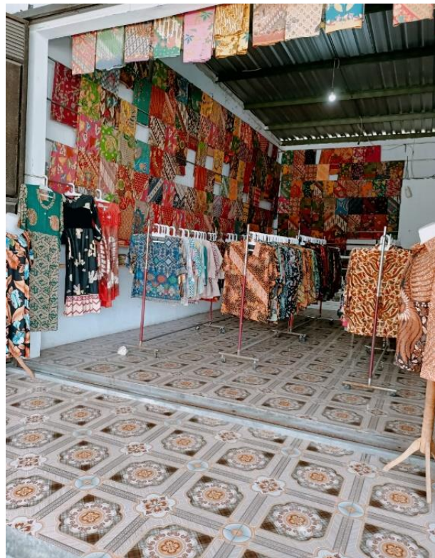
Gambar 03. Butik Widiana Batik Solo

dengan jarak tempuh lokasi yang berbeda tempat namun tetap di wilayah Solo Raya. Untuk butik yang pertama berada di rumah kediaman pribadi pemilik yang berada wilayah Solo beralamatkan di di Jl. Benowo 6 No. 11, Gentan, Makamhaji, Kec. Kartosuro, Kab. Sukoharjo, Jawa Tengah 57161 dan untuk butik yang kedua berada di seputaran kios di PSG (Pusat Grosir Solo) lantai basmant B11-05. Berikut merupakan foto tata letak dari butik Widiana Batik Solo yang berada di rumah kediaman pemiliknya sebagai berikut :