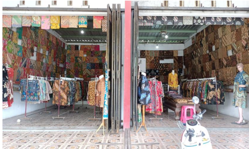
Gambar 04. Butik Widiana Batik Solo

Butik Widana Batik Solo ini yang berada di rumah kediaman pemiliknya mempunyai lokasi sangat strategis dan lumayan luas dengan ukuran 6 m x 8 m. Di butik utama ini memiliki penataan yang sangat rapi dan tertata dengan memanfaatkan lebar luas ukuran butik tersebut semaksimal mungkin. Berikut adalah denah ruang dari butik Widiana Batik Solo yang berada dikediaman rumah pribadinhya sebagai berikut :