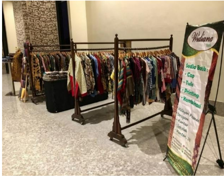
Gambar 15. Pameran Butik Widiana Batik Solo