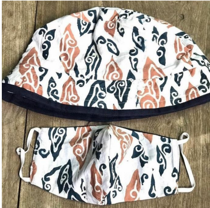
Gambar 14. Topi Dan Masker Batik Butik Widiana Batik Solo

Tak hanya sekedar membuka butik, pemilik butik Widiana Batik Solo ini juga sangat rajin dalam ajang partisipasi dalam mengikuti acara event pameran pakian batik dalam kota maupun luar kota. Berikut merupakan foto-foto kegiatan pameran dari butik Widiana Batik Solo sebagai berikut :