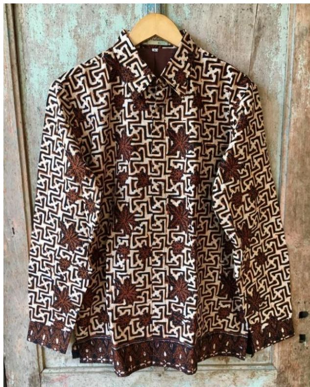
Gambar 09. Kemeja Batik Cap Butik Widiana Batik Solo