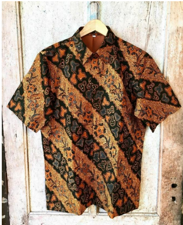
Gambar 07. Kemeja Batik Tulis Butik Widiana Batik Solo

seragam kantor, seragam sekolah, seragam manten, seragam arisan, seragam organisasi dan lain-lain. Selain memproduksi pakaian atas batik, butik ini juga memproduksi celana, kaos, topi dan masker. Di butik Widiana Batik Solo ini juga menerima penjualan online melalui aplikasi yang disediakan dan menerima paket melalui kilat dan ojek online. Berikut merupakan produk pakaian batik dari butik Widiana Batik Solo sebagai berikut :