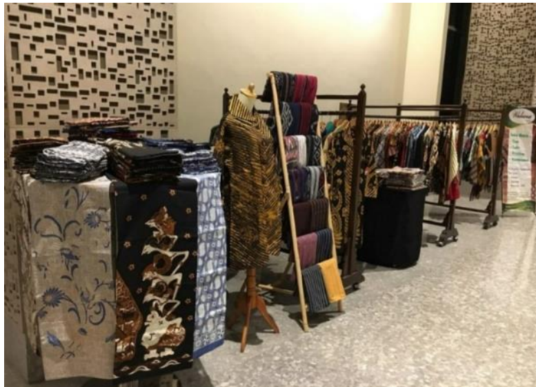
Gambar 16. Pameran Butik Widiana Batik Solo