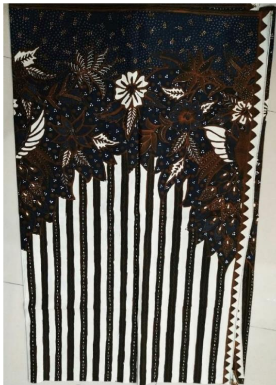
Gambar 13. Kain Batik Tulis Butik Widiana Batik Solo