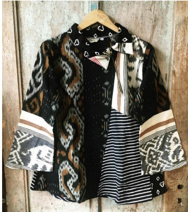
Gambar 08. Blus Kombinasi Batik Butik Widiana Batik Solo