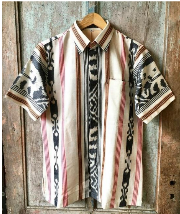
Gambar 11. Kemeja Tenun Lapis Furing Butik Widiana Batik Solo