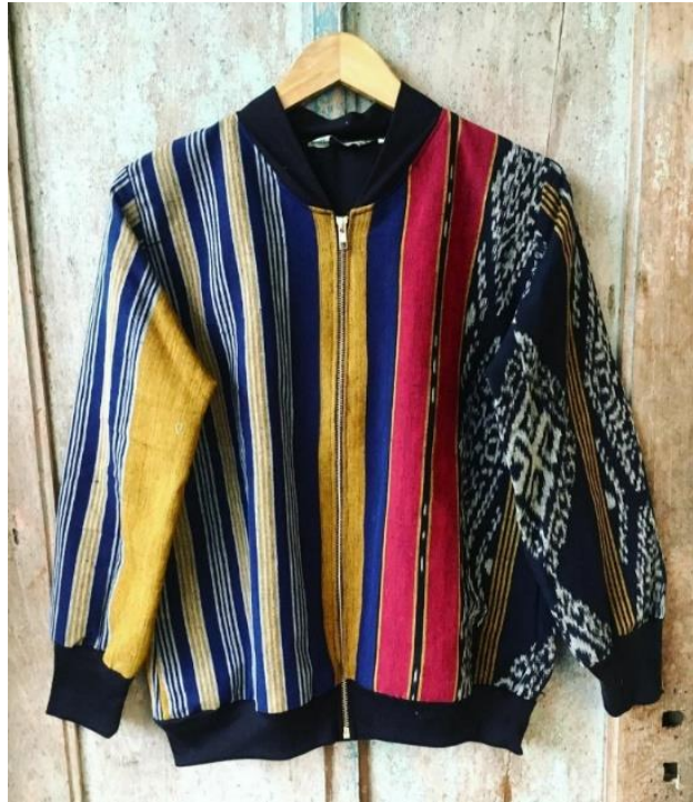
Gambar 10. Jaket Kombinasi Tenun dan Furing Butik Widiana Batik Solo