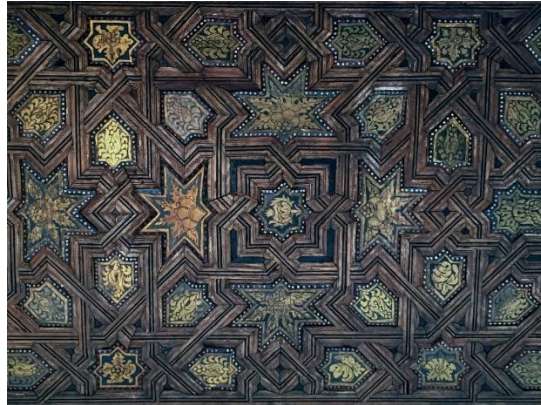
Gambar 27. Ornamen Geometri Istana Al Hambra