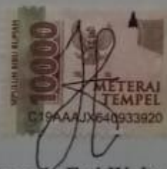
Theresia Esti Wulandari

Dibuat di: Surakarta, 2 Februari 2022 Yang membuat pernyataan