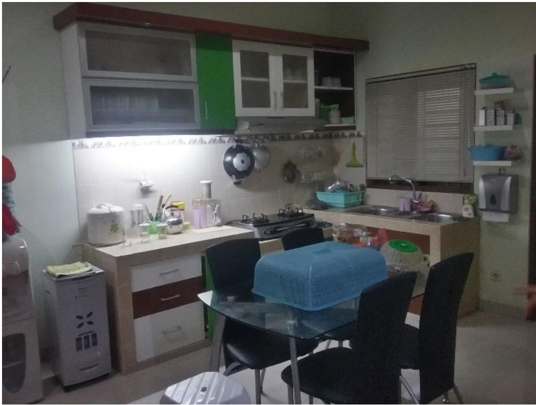
Gambar 3. Ruang Makan

Pada ruang makan, perabot ruang makan yang akan menggunakan konsep multifungsi adalah meja dan kursi. Meja dan kursi dapat disimpan bila tidak diperlukan untuk menambah ruang gerak pada ruang makan. Dapur akan diberi tempat untuk menyimpan peralatan untuk bersih-bersih seperti sapu, pel, dan lain sebagainya, dapur akan menggunakan warna oranye karena dapat merangsang nafsu makan. Ruang kosong pada bawah tangga akan dipergunakan sebagai Storage atau ruang penyimpanan barang dan lemari buku.