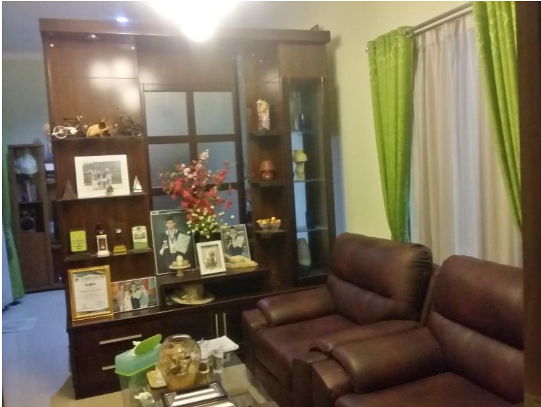
Gambar 2. Ruang Tamu

Ruang tamu dan ruang keluarga akan diberi sekat dan meja kopi yang dapat dipergunakan sebagai sofa memaksimalkan ruangan apabila memiliki tamu yang lebih banyak. Ruang tamu ini akan menggunakan warna-warna hangat seperti coklat, oranye, dan kuning yang dapat menimbulkan suasana ramah pada tamu yang akan datang, dikombinasikan dengan warna-warna netral seperti putih, abu-abu, hitam untuk menyeimbangkan warna, dan juga takstur-tekstur kayu yang dapat menimbulkan kesan alam yang rileks dan santai.