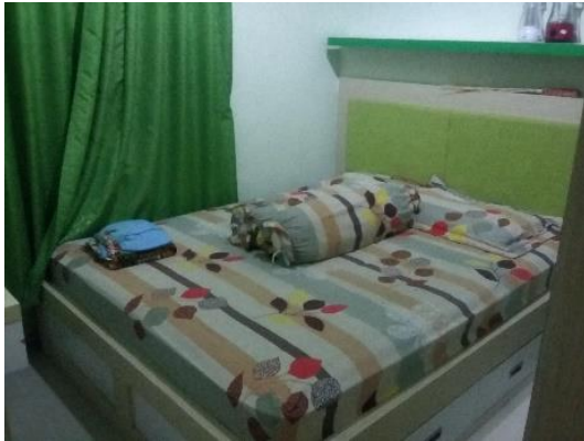
Gambar 4. Kamar tidur utama