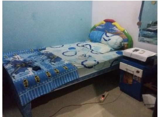
Gambar 5. Kamar tidur anak

Ruang tidur utama akan menggabungkan fungsi dari tempat tidur dan sofa, tempat tidur dapat di simpan bila tidak sedang di gunakan, Ruang ini akan menggunakan perpaduan warna-warna dingin seperti biru atau hijau, dipadukan juga dengan warna-warna netral seperti putih, dan tekstur kayu untuk menimbulkan kesan alam, damai, dan rileks. Ruang tidur anak kasur dapat dialih fungsikan sebagai meja belajar dan terdapat juga kursi lipat yang dapat di fungsikan juga sebagai dekorasi ruangan. Untuk penggunaan warna akan di bedakan pada ruang anak laki-laki dan anak perempuan. Ruang anak laki-laki akan menggunakan perpaduan warna biru yang menimbulkan kesan santai dan coklat yang maskulin, sedangkan ruangan anak perempuan menggunakan warna-warna yang girly seperti pink, biru muda, dan putih.