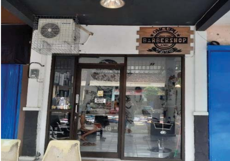
Gambar 1 , Om Cuppu Barbershop, (Muhammad Umar Ilham H, 2022)