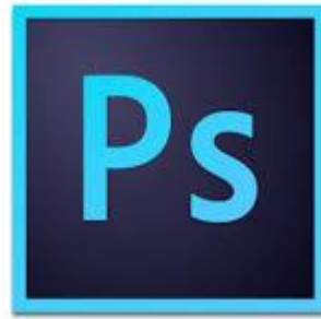
Gambar 16. Logo Photoshop CC 2017

( https://freepikpsd.com/adobe-photoshop-cc-logo-png-transparent-images/498051/adobe-photoshop-cc-logo-png-6-transparent-images/ , 2021)