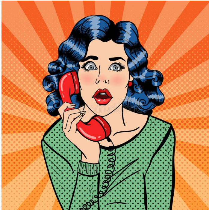
Gambar 13. Style pop art

sebuah kecerian juga sebuah ciri khas untuk tampil berbeda dari yang lain.