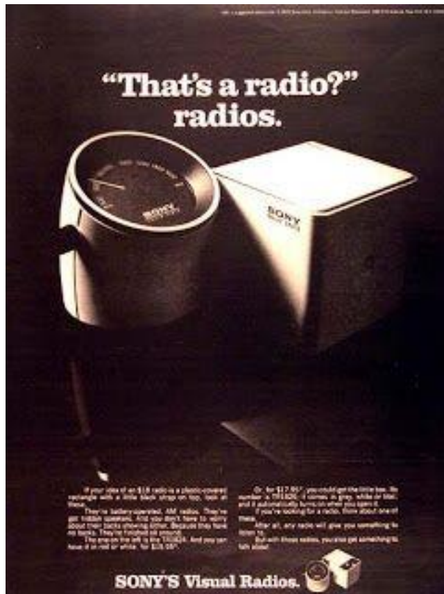
Gambar 9. Picture window layout ( pinterest.com/pin/627689266824089460 , 2021)

pada area tengah dan pesan yang terdapat didalamnya bisa langsung tersampaikan.