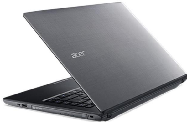
Gambar 15. Laptop Acer Aspire E5 – 475g ( https://review-laptop.com/harga-dan-spesifikasi-acer-aspire-e5-475g/ , 2021)

Hardware yang digunakan yaitu adalah sebuah laptop Acer Aspire E5 – 475g. Laptop ini digunakan untuk membuat dan juga