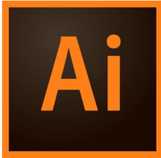
Gambar 17. Logo Adobe Illustrator