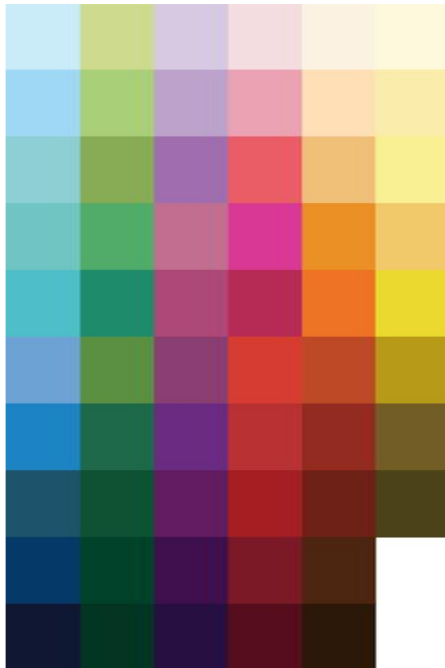
Gambar 10. Warna pop art

Karena target audiencenya adalah anak muda maka penggunaan warna pun mengikuti selera anak muda jaman sekarang, berikut adalahh warna – warna yang digunakan dalam sebuah perancangan.