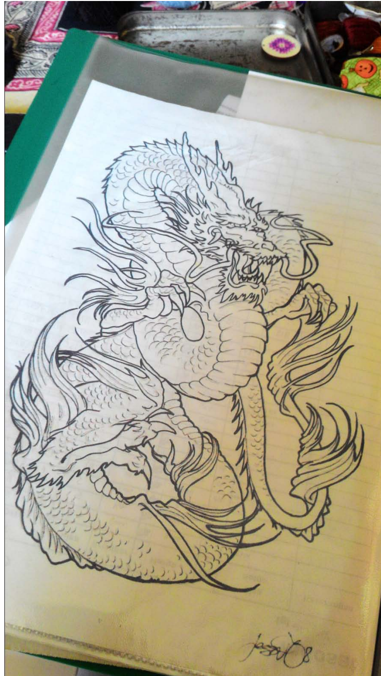
Gambar Manual untuk aplikasi sulam Stroberi Hitam, tahun 2015