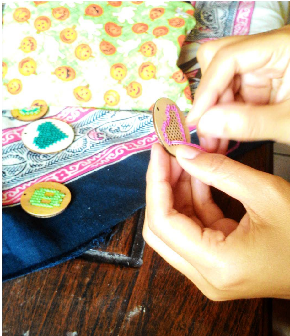
Proses sulam pada kayu untuk kalung Stroberi Hitam, tahun 2015