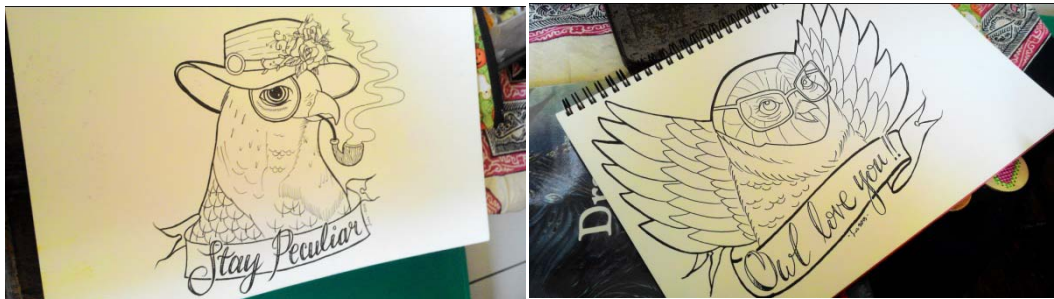
Gambar untuk aplikasi coloring book Stroberi Hitam, tahun 2015