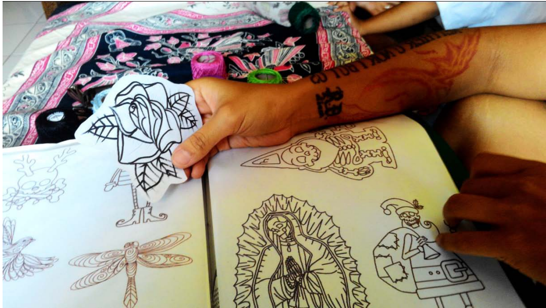
Gambar untuk aplikasi sulam Stroberi Hitam, tahun 2015