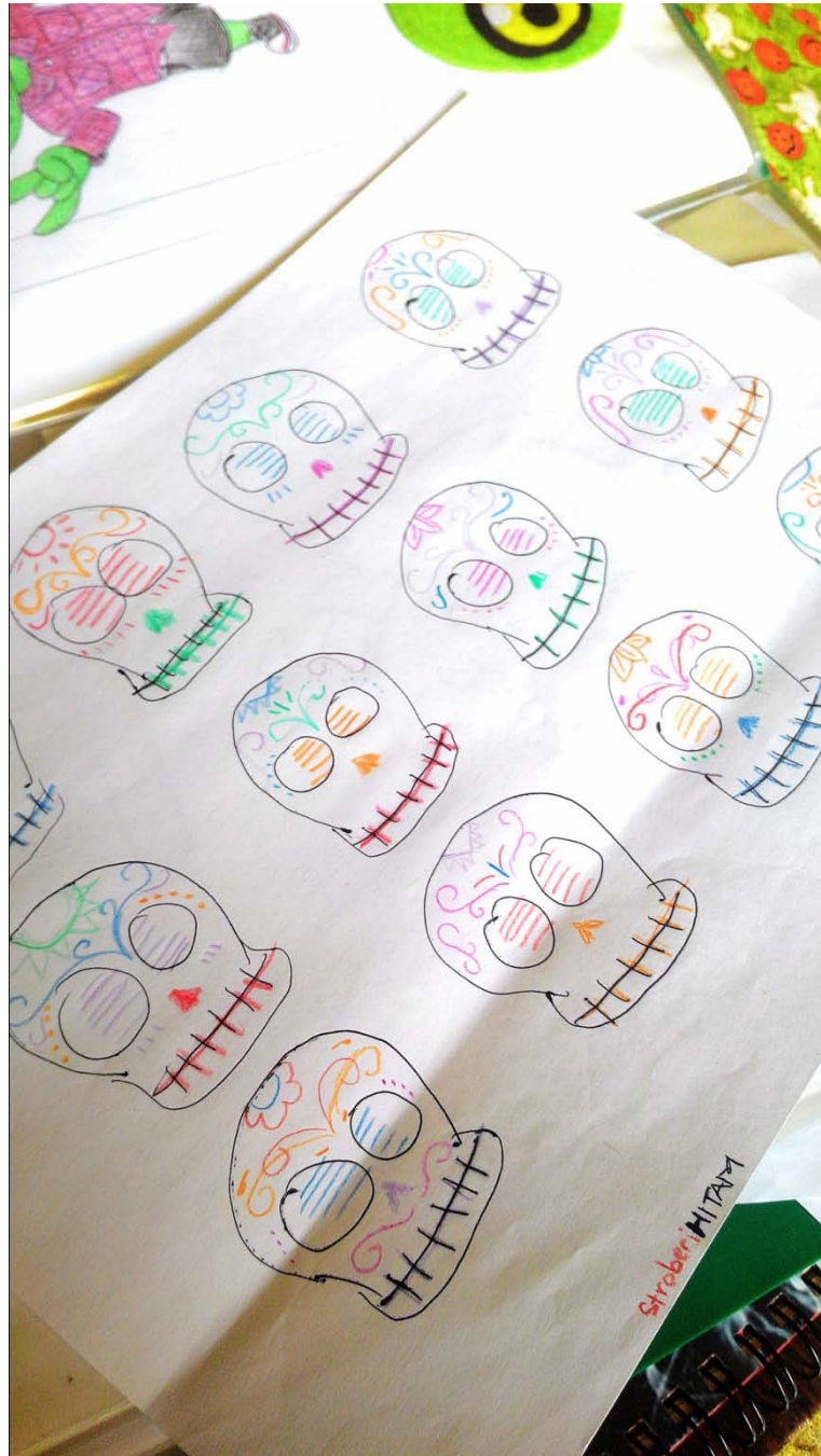
Sketsa emblem bordir Stroberi Hitam, tahun 2015