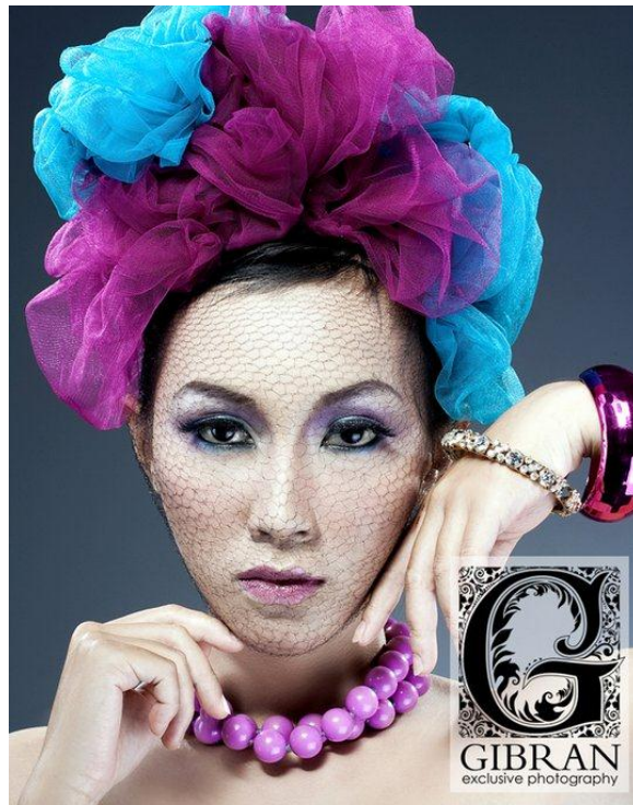
Gambar 21. Fotografi Beauty Shoot karya Gibran Exclusive Photography Sumber: www.facebook.com/gibran.exclusive.photography

seorang fotografer bukan lagi tentang teknik pencahayaan, tapi kemampuan untuk mempelajari dan mendalami, karakter serta anatomi wajah dari model yang akan difoto. ( http://www.rkusumabrata.com/post/fotografi-fashion--beauty-shot )