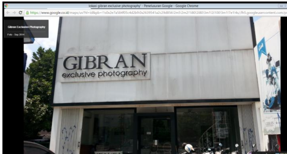
Gambar 3. Perusahaan Gibran Exclusive Photography

hati/perasaan orang agar lebih membuat orang tertarik, sehingga timbul rasa ingin tahu.