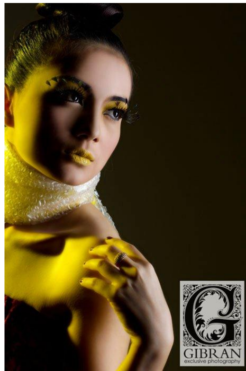
Gambar 23. Fotografi Beauty Shoot karya Gibran Exclusive Photography Sumber: www.facebook.com/gibran.exclusive.photography