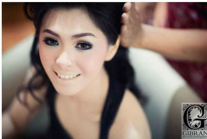
Gambar 9. Fotografi Wedding karya Gibran Exclusive Photography Sumber: www.facebook.com/gibran.exclusive.photography