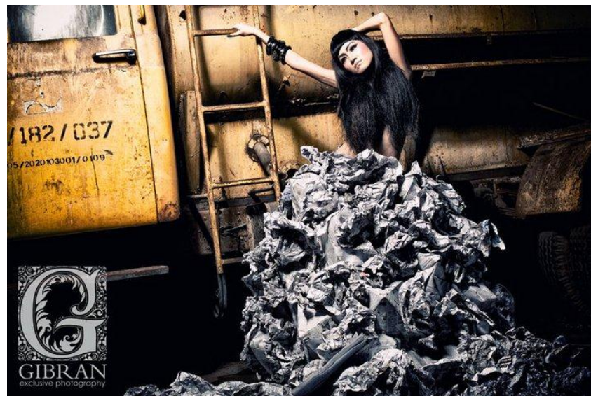
Gambar 18. Fotografi Conceptual Fashion karya Gibran Exclusive Photography Sumber: www.facebook.com/gibran.exclusive.photography

( http://helliumworks.blogspot.co.id/2010/12/fotografi-konseptual.html )