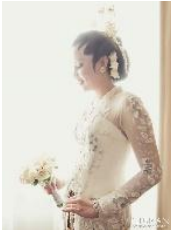
Gambar 8. Fotografi Wedding karya Gibran Exclusive Photography Sumber: www.facebook.com/gibran.exclusive.photography

Fotografi wedding adalah foto yang diambil saat pernikahan yang bertujuan untuk mendokumentasikan acara pernikahan itu sendiri.