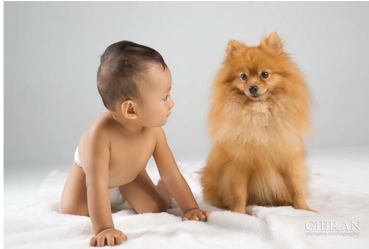
Gambar 16. Fotografi Baby Portrait karya Gibran Exclusive Photography Sumber: www.facebook.com/gibran.exclusive.photography