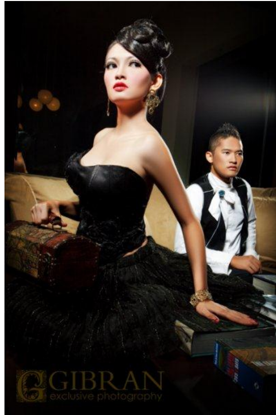
Gambar 4. Fotografi Pre Wedding karya Gibran Exclusive Photography Sumber: www.facebook.com/gibran.exclusive.photography