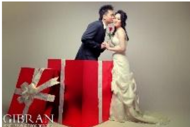
Gambar 5. Fotografi Pre Wedding karya Gibran Exclusive Photography