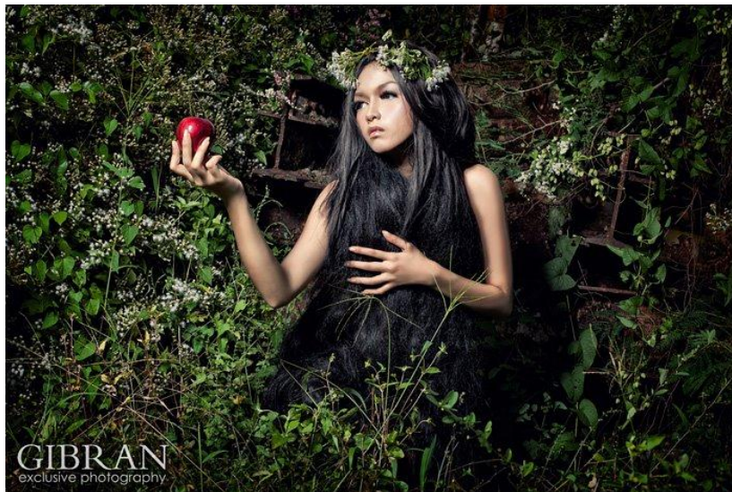
Gambar 20. Fotografi Conceptual Fashion karya Gibran Exclusive Photography Sumber: www.facebook.com/gibran.exclusive.photography