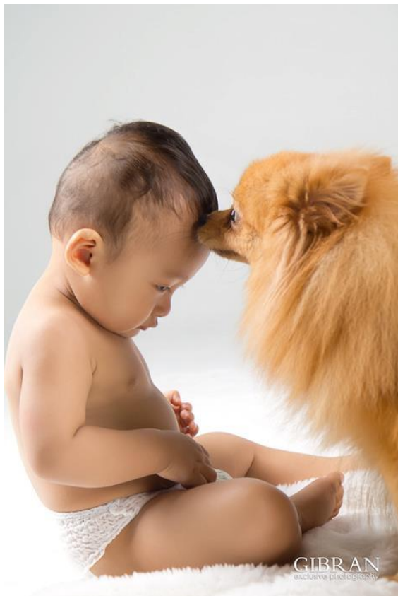
Gambar 17. Fotografi Baby Portrait karya Gibran Exclusive Photography Sumber: www.facebook.com/gibran.exclusive.photography