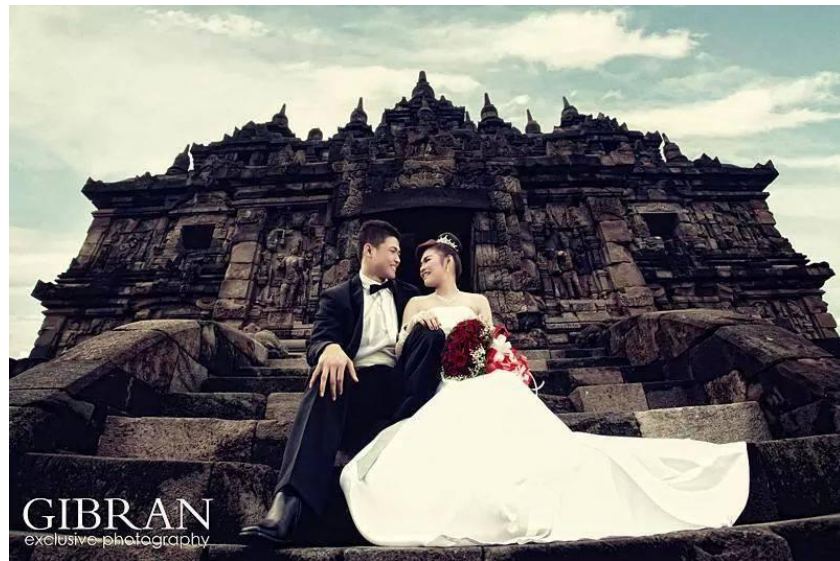
Gambar 6. Fotografi Pre Wedding karya Gibran Exclusive Photography