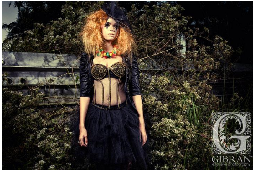
Gambar 19. Fotografi Conceptual Fashion karya Gibran Exclusive Photography Sumber: www.facebook.com/gibran.exclusive.photography