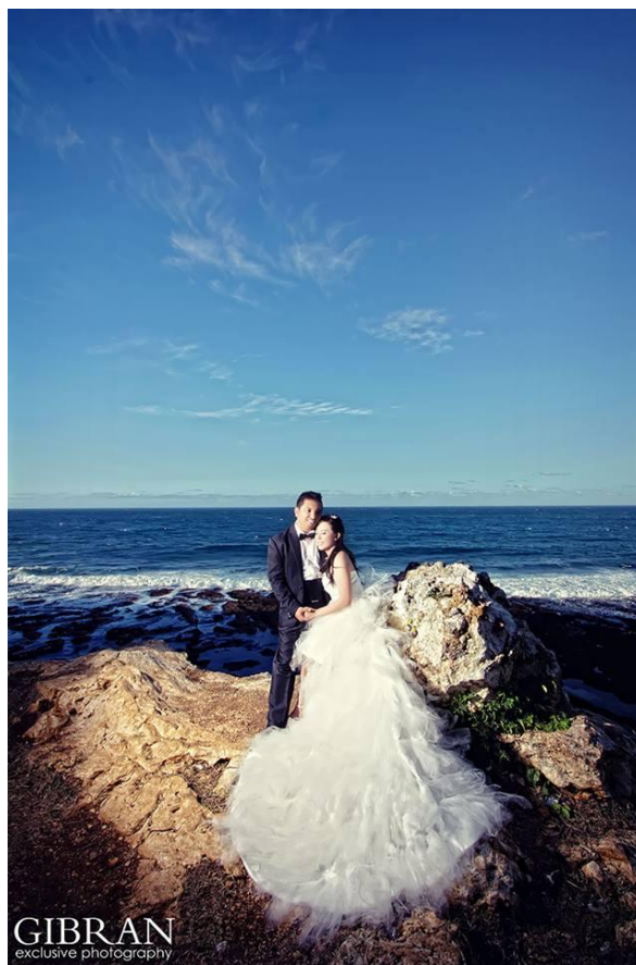
Gambar 7. Fotografi Pre Wedding karya Gibran Exclusive Photography Sumber: www.facebook.com/gibran.exclusive.photography