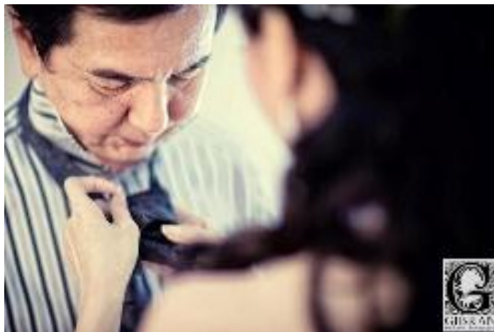
Gambar 10. Fotografi Wedding karya Gibran Exclusive Photography Sumber: www.facebook.com/gibran.exclusive.photography