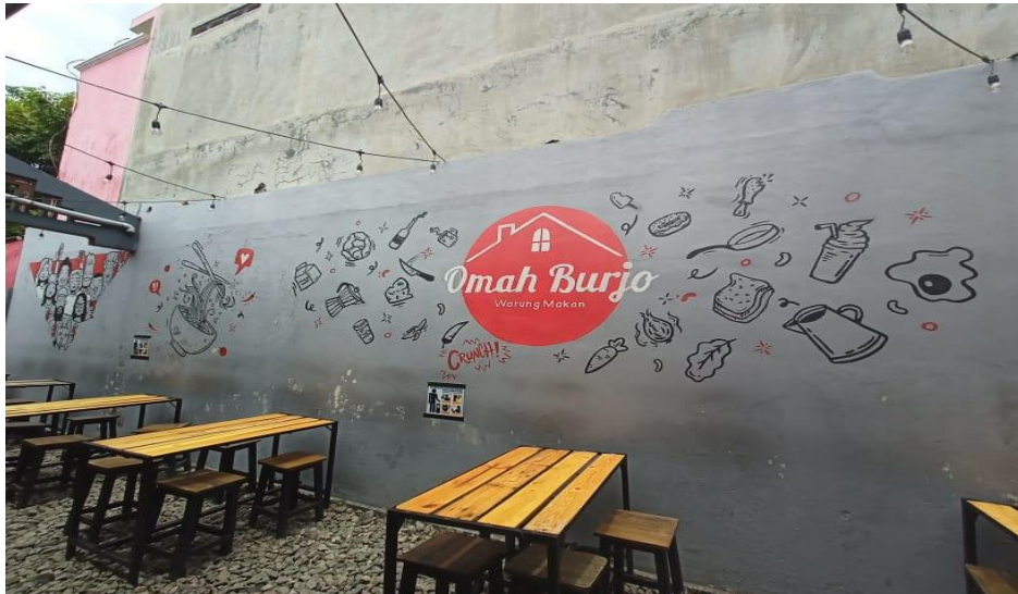
Gambar 17. Dinding Logo Omah Burjo