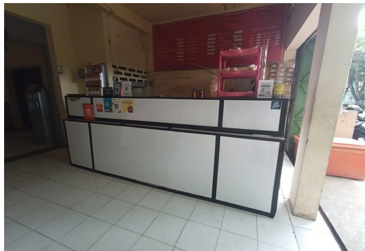
Gambar 10. Interior rumah makan