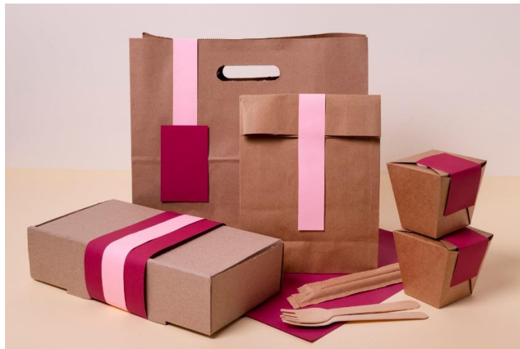
Gambar 7. Contoh Kemasan masing-masing ( www.google.com )