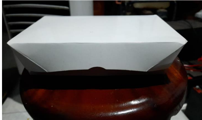
Gambar 9. Contoh lunch box paper

Paper lunch box merupakan tempat makanan yang sudah banyak digunakan oleh para pengusaha kuliner. Anda juga bisa menggunakannya untuk kepentingan pribadi seperti halnya membawa bekal anak sekolah atau ke kantor.