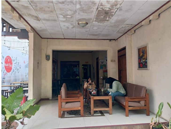
Gambar 13. Nongkrong bersama ngobrol 2