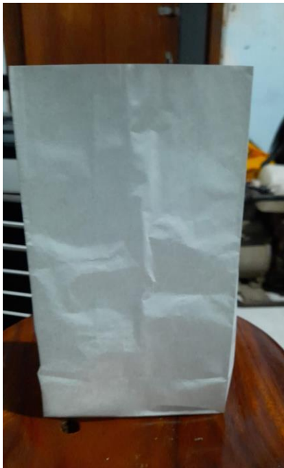
Gambar 8. Contoh Kemasan kertas

kertas biasanya dibungkus lagi dengan bahan-bahan kemasan lain seperti plastik dan foil logam yang lebih bersifat protektif. Karakteristik kertas didasarkan pada berat atau ketebalannya.