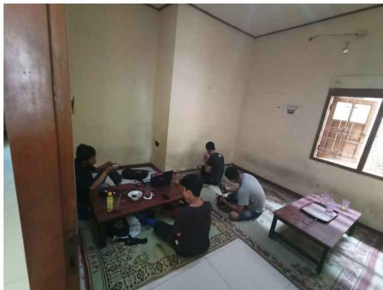
Gambar 12. Nongkrong bersama ngobrol