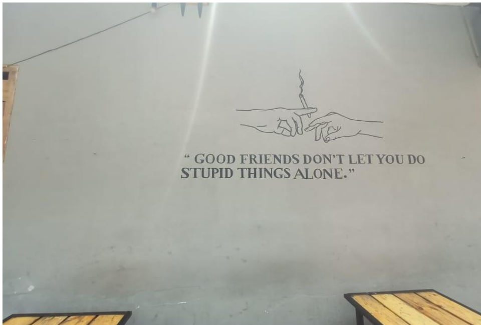
Gambar 18. Dinding Good friends don't let you do stupid things alone