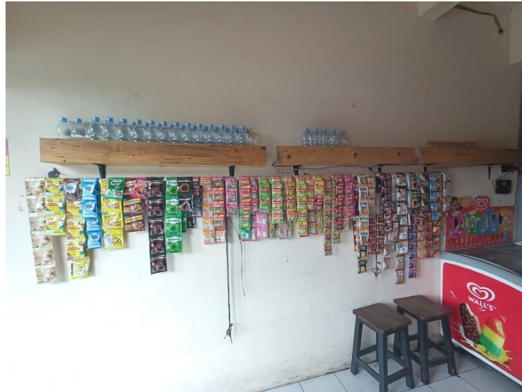
Gambar 11. Interior dapur minuman