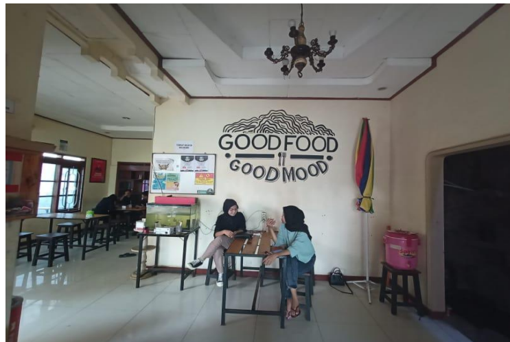
Gambar 16. Dinding Good Food / Good Mood