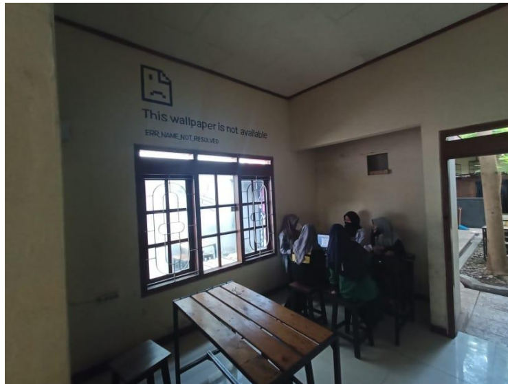
Gambar 14. Nongkrong bersama ngobrol 3