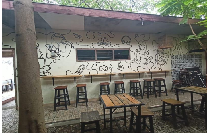
Gambar 15. Nongkrong bersama ngobrol 4