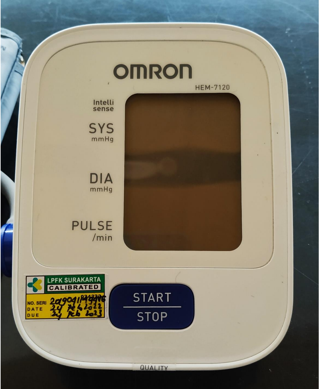
Alat ukur tekanan darah yang digunakan