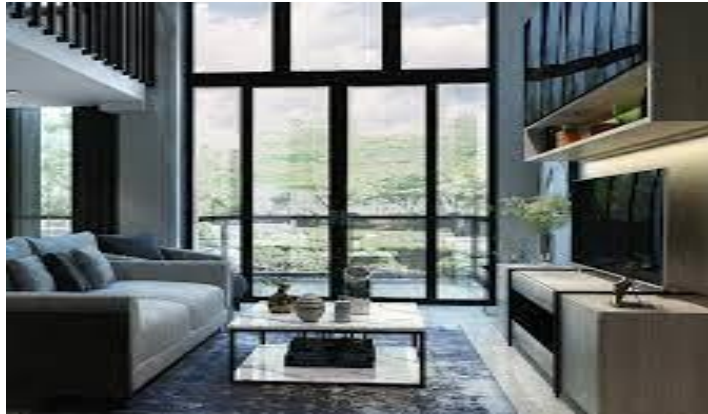
Gambar 23. Interior rumah bergaya Jepang