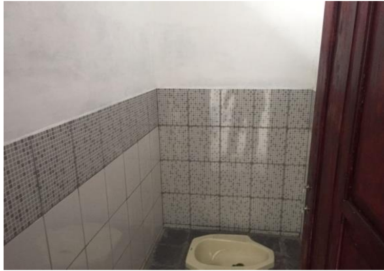
Gambar . 45 Penampakan Interior kamar mandi