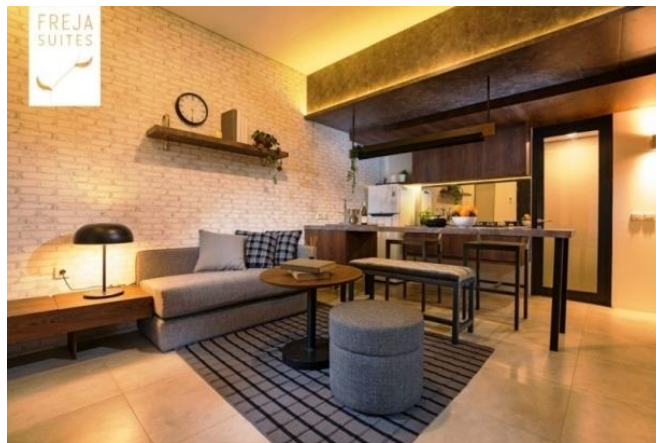
Gambar 19. Interior rumah bergaya Jepang

Freja House BSD City merupakan perumahan yang dikembangkan developer Sinarmas Land Indonesia. Perumahan ini memiliki luas bangunan 40meter persegi dan menargetkan psar millennial dimana menyukai desain yang simple , praktis dan kekinian.