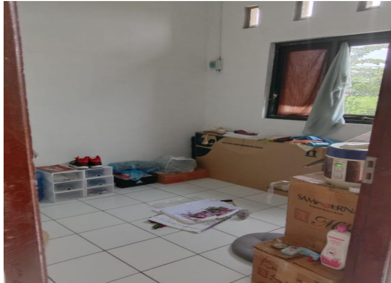
Gambar 43. Penampakan Interior dalam rumah kamar satu