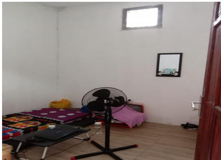
Gambar 44. Penampakan Interior dalam rumah kamar dua