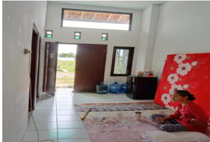
Gambar 41. Penampakan Interior dalam rumah