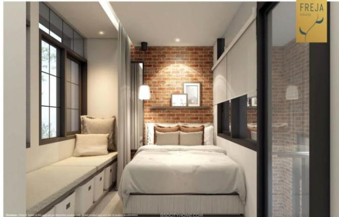
Gambar 21. Interior rumah bergaya Jepang