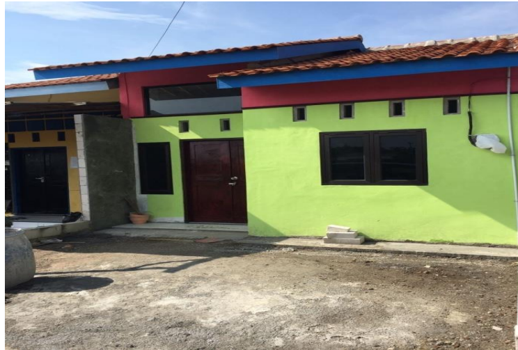
Gambar 39. Penampakan fasad depan rumah