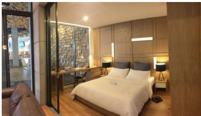
Gambar 22. Interior rumah bergaya Jepang

Dengan penggunaan material kayu maka nuansa jepang akan sangat terasa , ditambah dengan penggunaan furniture berbahan dasar kayu dengan desain minimalis dan fungsional. Sehingga menambah kesan hangat dan nyaman.