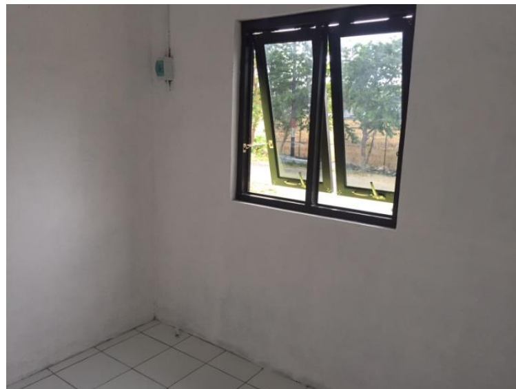
Gambar 42. Penampakan Interior dalam rumah kamar satu

Rumah ini terdiri dari dua kamar , kamar satu dan kamar dua. Kamar satu merupakan kamar tidur anak, kamar dua sebagai kamar tidur utama.