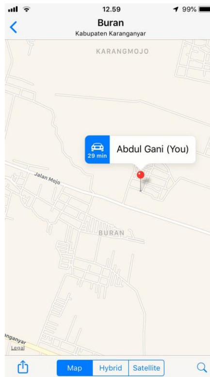
Gambar 18. Lokasi rumah Desa Nginggo Buran Tasikmadu Karanganyar