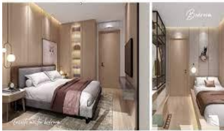
Gambar 24. Interior rumah bergaya Jepang