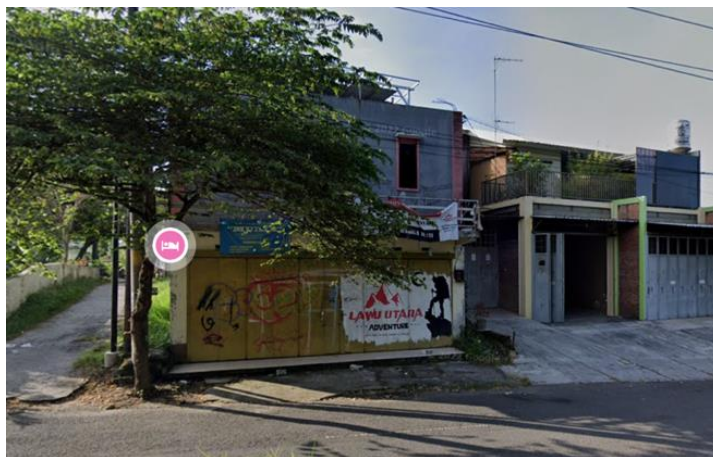
Gambar 7. Foto Lokasi Lawu Utara Adventure