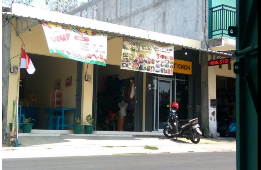
Gambar 4. Foto Lokasi Nawa Outdoor

Konsumen Nawa Outdoor adalah kaum muda yang peduli akan lingkungan dan penjelajah alam. Mayoritas anak sekolah menengah atas dan mahasiswa.