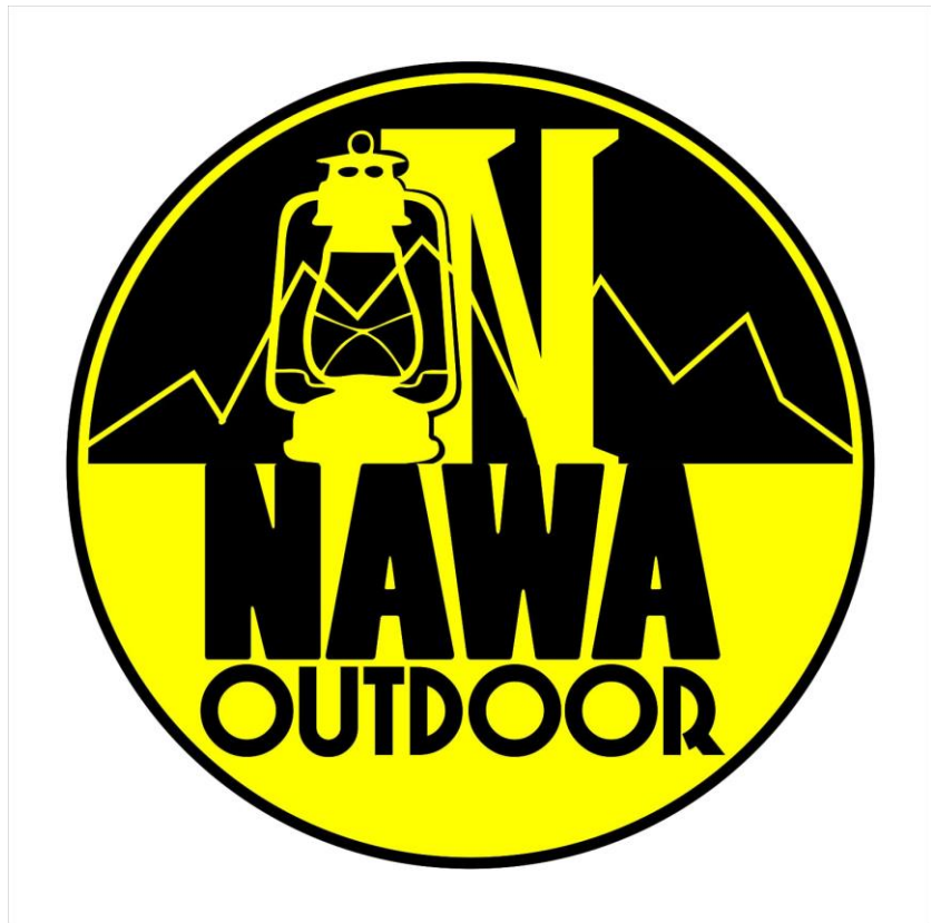
Gambar 3. Logo Nawa Outdoor

Nawa Outdoor merupakan perusahaan atau bisnis UMKM yang bergerak dibidang persewaan dan jual beli peralatan pendakian yang didirikan oleh Kun Cahyo Aprinawa pada tahun 2015. Nawa Outdoor terletak di dekat sungai Pepe ini memulai persewaan dan penjualannya dengan mengambil produk dari perusahaan berbagai merk peralatan pendakian gunung kemudian dijual kembali, seperti tenda, sleeping bag, sepatu, cooking set, head lamp dan jaket. Nawa Outdoor menjual barang-barang yang bermerk dan berkualitas serta memberikan