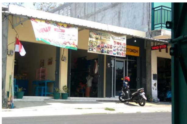
Gambar 2. Foto Lokasi Nawa Outdoor