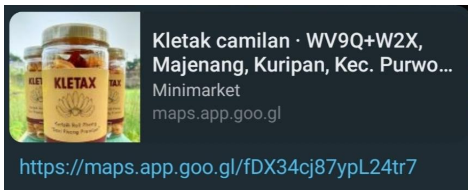
Gambar 2 : Lokasi Produksi

Kletax memberikan harga yang terbilang cukup terjangkau per 200g seharga Rp. 15.000, peminatnya dari kalangan remaja hingga dewasa, kurangnya dari produk ini adalah kemasan yang kurang menarik pelanggan sehingga hanya di kenali dengan keripik pisang roll saja, sedangkan Kletaxnya para pelanggan beberapa orang tidak mengetahuinya, dikarenakan kemasan tersebut hanya polosan plastik mika saja, dan di tempelkan sebuah setiker kletax, dan kalau hanya setiker terlalu kecil dan gampang pudar, usaha ini dipegang langsung oleh Irvan Huda, ada beberapa struktur yang akan ditampilkan dalam usaha ini.