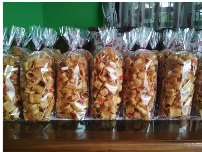
Gambar 6 : Kemasan Kletax Keripik pisang (Irvan Huda, 2022)

Contoh dari kemassan Kletax dengan harga 15.000, dari yang awalnya menggunakan toples sebagai kemasan sekarang berubah menjadi plastik mika dikarenakan Jenis kemasan