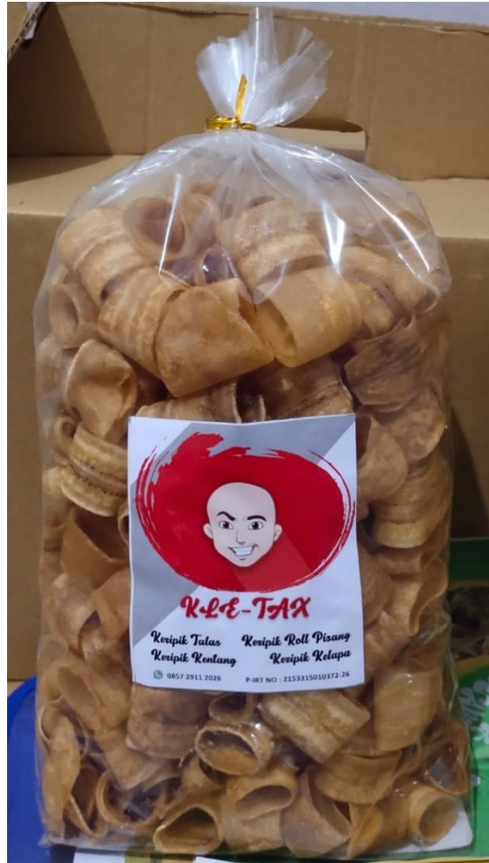
Gambar 5 : Kemasan Kletax Keripik pisang (Irvan Huda, 2022)