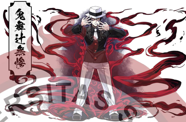
Gambar 9. Kibutsuji Muzan, pimpinan Oni atau iblis.

mirip vampir yang makanan utamanya adalah manusia, memakan dagingnya dan juga darah.