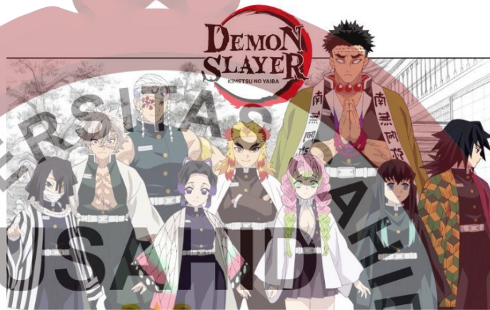
Gambar 7. Hashira