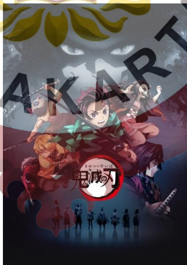
Gambar 6. Visual poster anime Demon Slayer Kimetsu no Yaiba Season 1