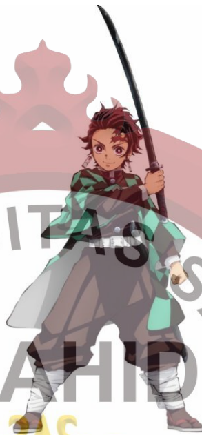
Gambar 10. Kamado Tanjiro.