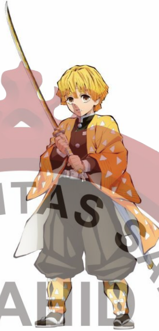
Gambar 12. Zenitsu Agatsuma.