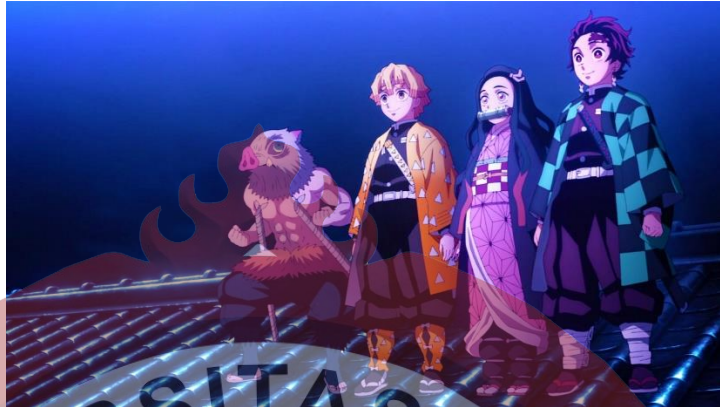
Gambar 8. Demon Slayer Tanjiro dkk

Pembasmi iblis atau Demon Slayer merupakan Manusia yang sudah mempelajari teknik pernafasan yang bertugas membasmi iblis yang di pilih dengan proses seleksi dengan bertahan hidup selama tujuh hari di puncak gunung yang dipenuhi iblis tanpa bantuan dari dunia luar. Setelah mereka berhasil lolos bertahan hidup, para demon slayer baru ini akan diberikan bongkahan logam yang akan menjadi bahan utama dari pedang yang akan diberikan pada Para Demon Slayer juga mereka diberikan fasilitas seekor burung yang bisa berbicara sebagai alat komunikasi maupun petunjuk misi selanjutnya.