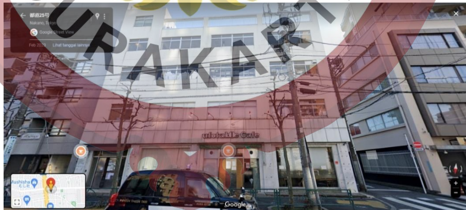
Gambar 4. Gedung Ufotable

Ufotable.inc merupakan studio animasi Jepang yang didirikan pada oktober 2000 oleh Hikaru Kondou yang sebelumnya seorang asisten produksi di TMS Entertainment melalui anak perusahaannya Telecom Animation. Nama perusahaan tersebut terinspirasi dari meja berbentuk UFO yang ditemukan Hikaru Kondou saat merancang visi untuk studionya. Hikaru Kondou kemudian memperoleh meja itu dan menamai studio tersebut dengan namanya, Ufotable.