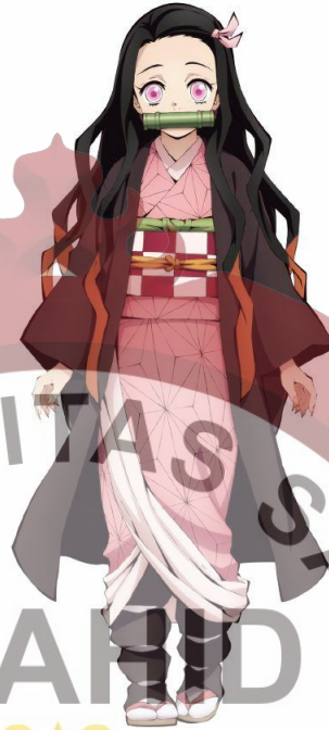
Gambar 11. Kamado Nezuko. Sumber ( https://kimetsu-no-yaiba.fandom.com/wiki/Nezuko_Kamado?file=Nezuko+anime.png )

Kamado Nezuko merupakan Adik perempuan Tanjiro. Setelah diserang oleh iblis yang darahnya masuk ke tubuhnya melalui luka terbuka, dan menyebabkan ia sendiri berubah menjadi seorang iblis. Namun setelah menjadi iblis, dia bisa mengenali Tanjiro sebagai orang terdekatnya, dan bisa melindungi manusia lainnya. Sebelum dia berubah, dia adalah seorang gadis lembut yang mencintai keluarganya. Pengisi suara dari Nezuko diisi oleh Akari Kito. (Sumber: Website demonlayer-anime.com )