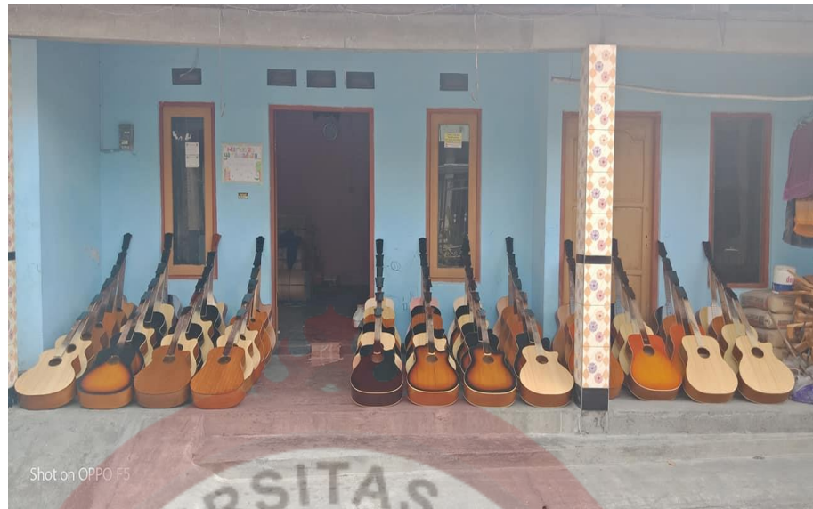
Gambar 13 : Tempat Perusahaan Vipitt Saputro