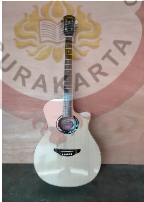
Gambar 07 : Gitar APX 500i Murah Tanem Besi