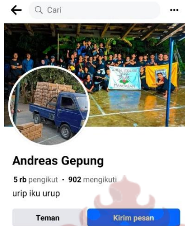
Gambar 03 : Facebook Andreas Gepung