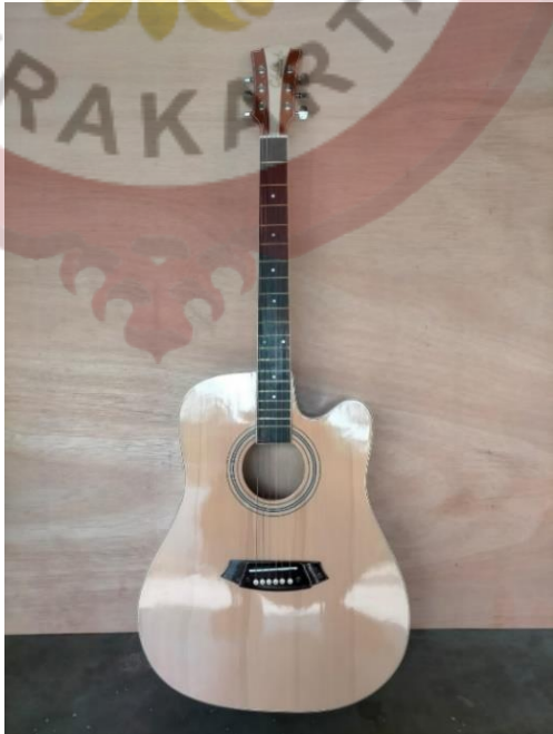
Gambar 09 : Gitar Akustik Cole Clark Tanam Besi Stelan Crom Sumber (Dokumen Terate Musik,2023)