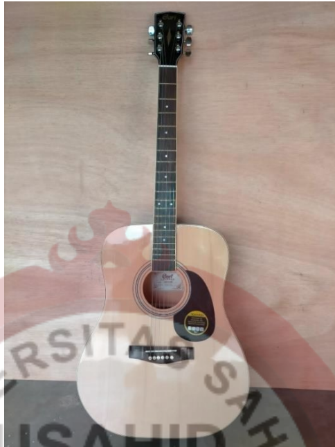
Gambar 10 : Gitar Akustik Cort Tanam Besi Setelan Crom