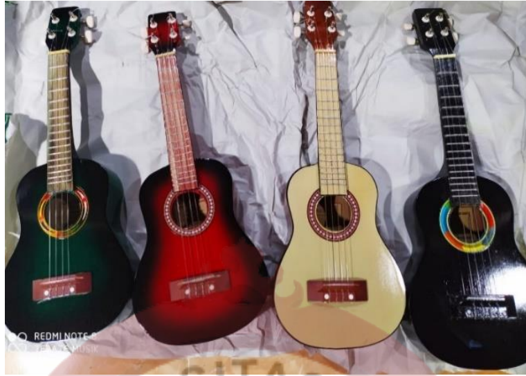
Gambar 06 : Ukulele Varian Warna