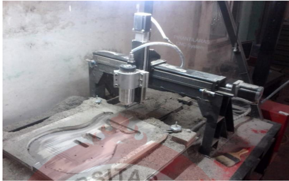
Gambar 14 : Tempat Perusahaan Pirantilaras Sumber (Dokumen Pirantilaras,2023)