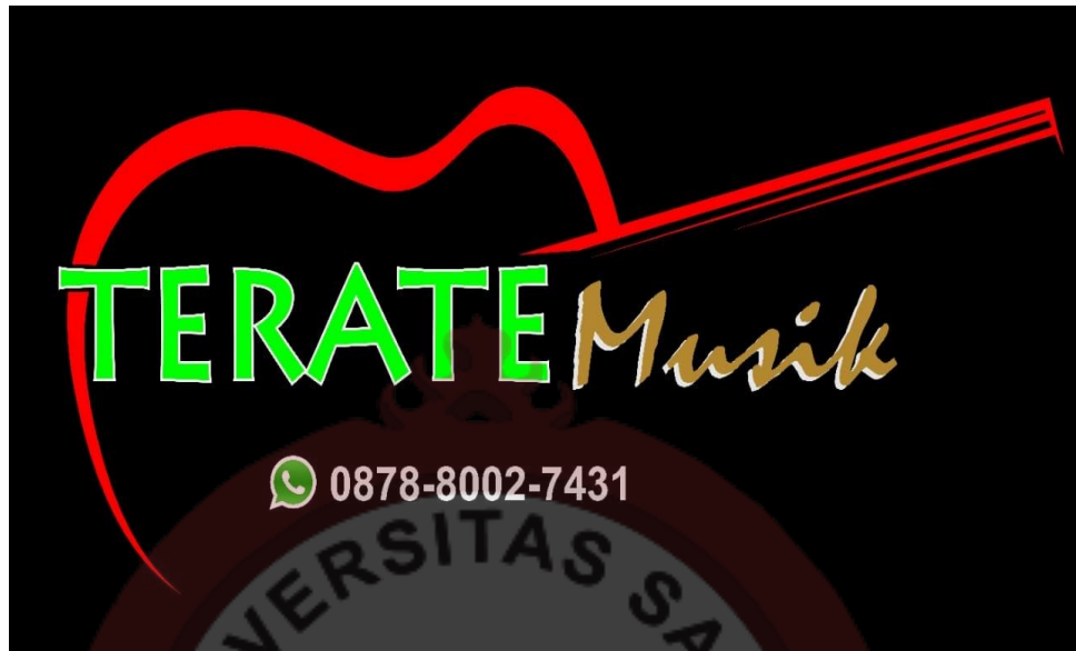
Gambar 05 : Contoh Logo ( Terate Musik )

Logo Terate Musik ada gambar gitar warna merah yang artinya cinta, berani dan kuat. Bahwa orang yang mencintai musik dan gitar produk Terate Musik menghasilkan suara yang nyaring. Tulisan Terate Musik warna hijau dan emas terate dari bunga terate yaitu keindahan warna hijau adalah menyejukan dan warna emas memiliki arti kesuksesan yaitu sukses dalam usaha alat musik Gitar Terate Musik Mancasan Baki Sukoharjo.