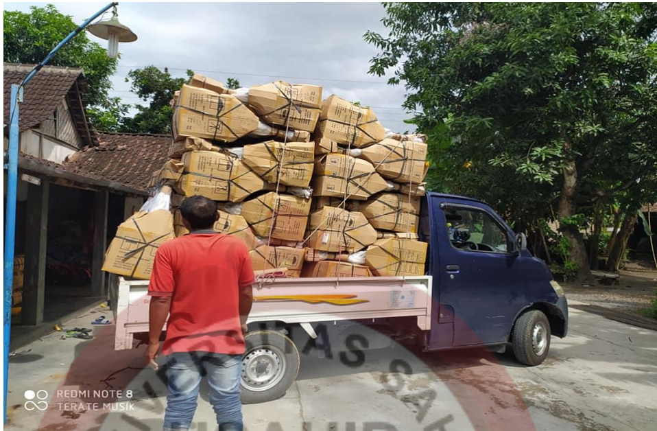
Gambar 12 : Gitar Mau dikirim Ke Luar Kota

Gitar yang akan dikirim ke luar kota melalui jasa pengiriman. Gitar produk Gitar Terate Musik dibungkus dengan plastik, dibungkus lagi dengan kardus yang tebal sesuai dengan memakai kotak kayu. Supaya Gitar yang dikirim sampai alamat tujuan tetap terlindungi, sampai kepada alamat pembeli barang terjaga masih baik atau pun tidak rusak. Sehingga pembeli merasa puas dengan pelayanan yang terjaga baik.