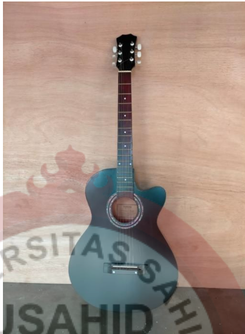
Gambar 08 : Gitar Pemula Senar Biasa