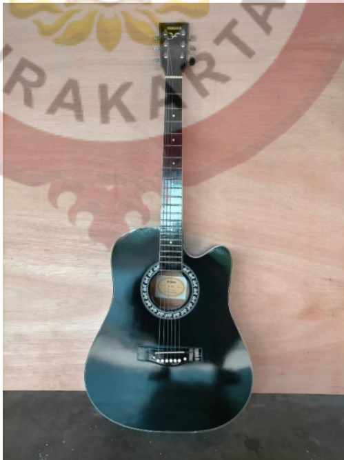
Gambar 11 : Gitar Akustik Jumbo Tanam Besi Setelan Crom