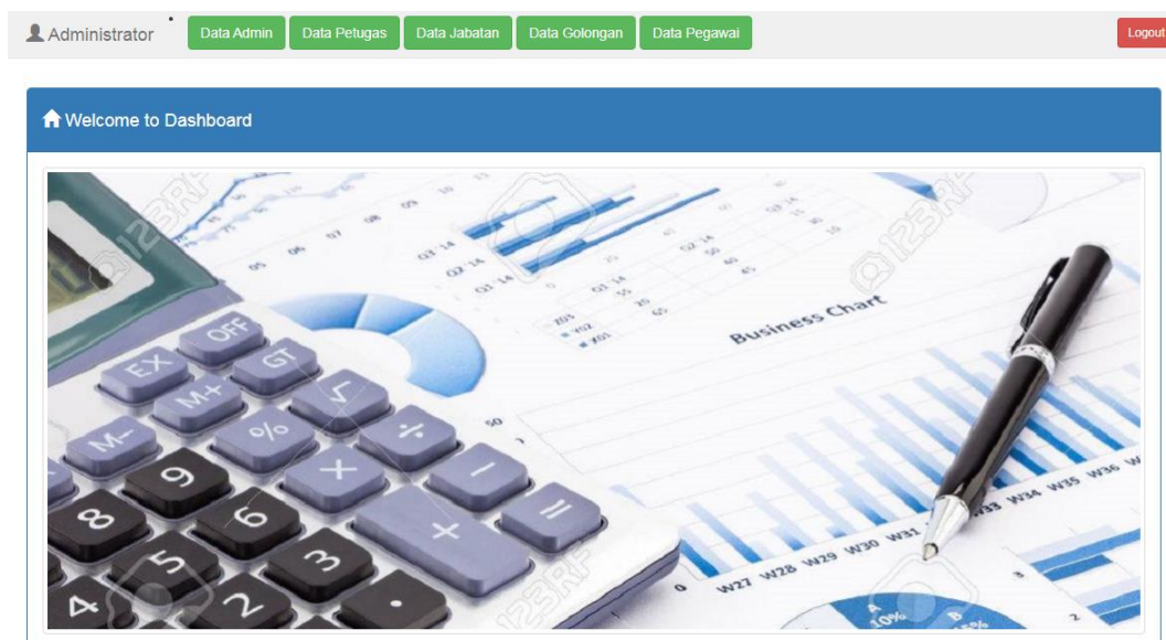
Gambar 2. Halaman Dasboard Admin