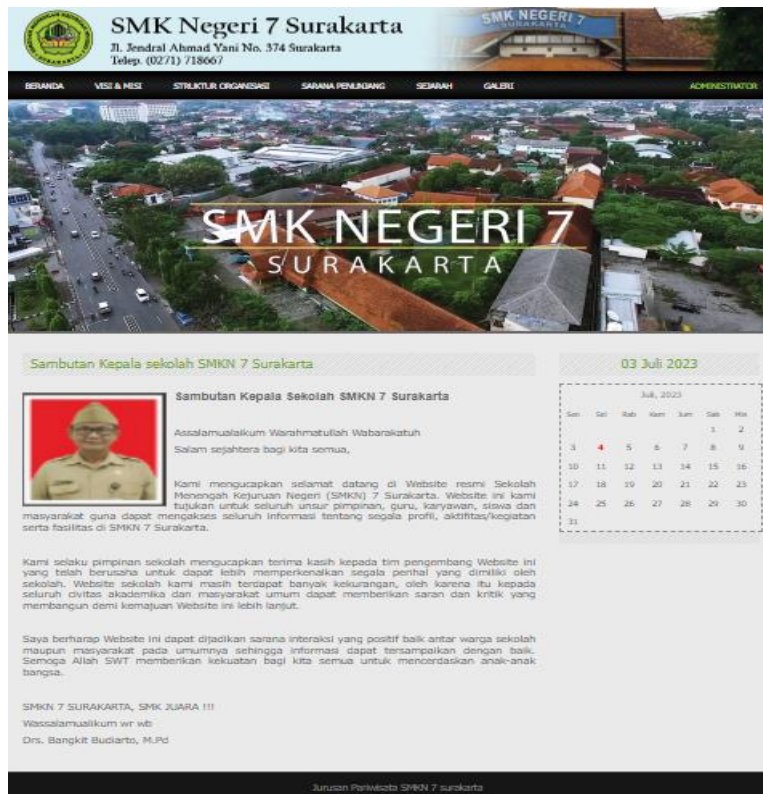
Gambar 1. Halaman Beranda