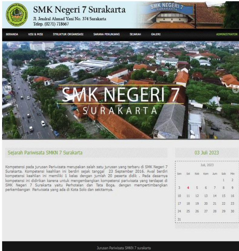
Gambar 5. Halaman Sejarah