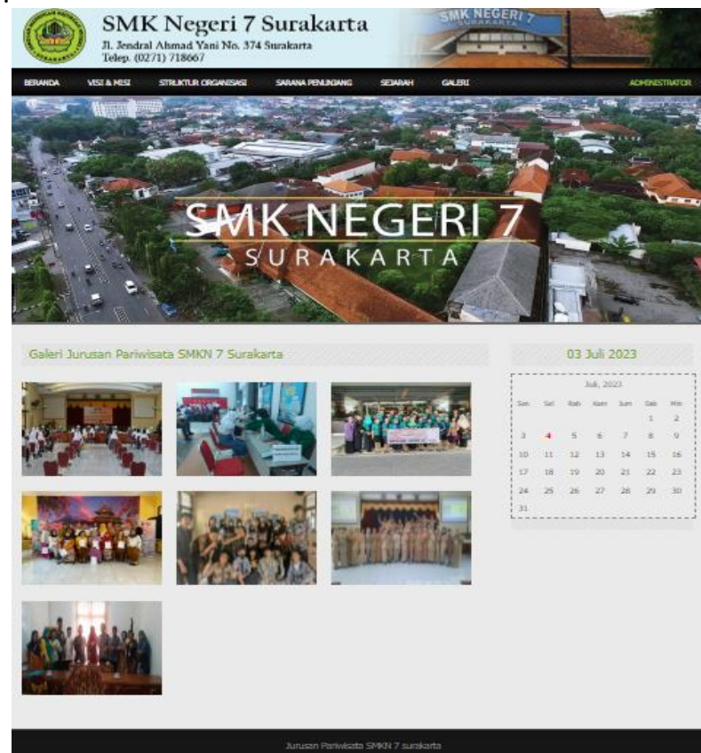
Gambar 6. Halaman Galeri