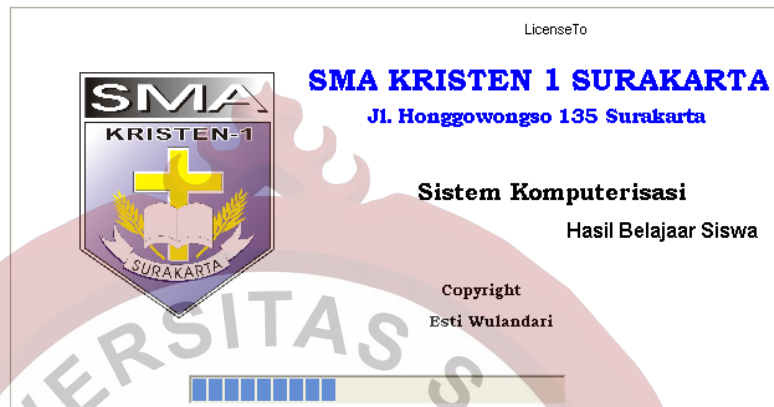
Gambar L.1 Form Menu Splash