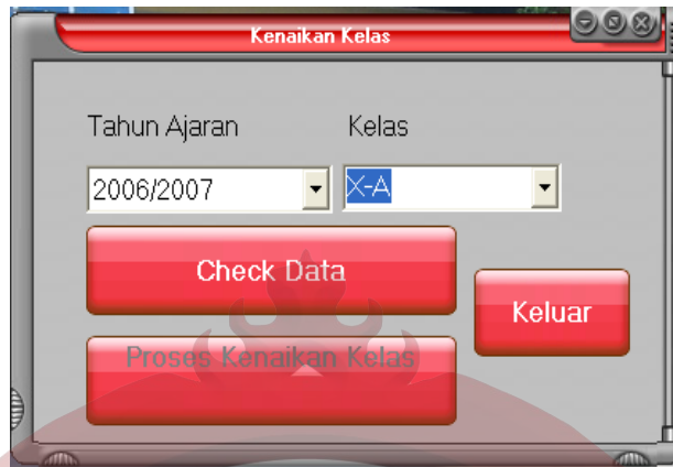
Gambar L.19 Form Kenaikan Kelas