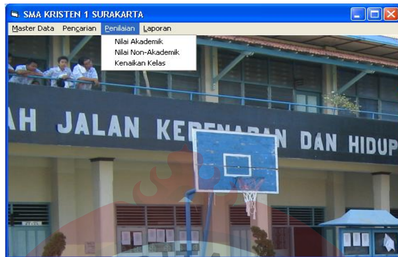
Gambar L.8 Form Menu Penilaian