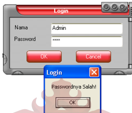
Gambar L.4 Form Login Kesalahan Password