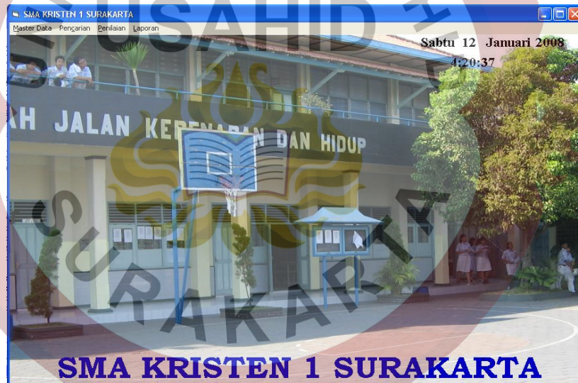
Gambar L.5 Form Menu Utama