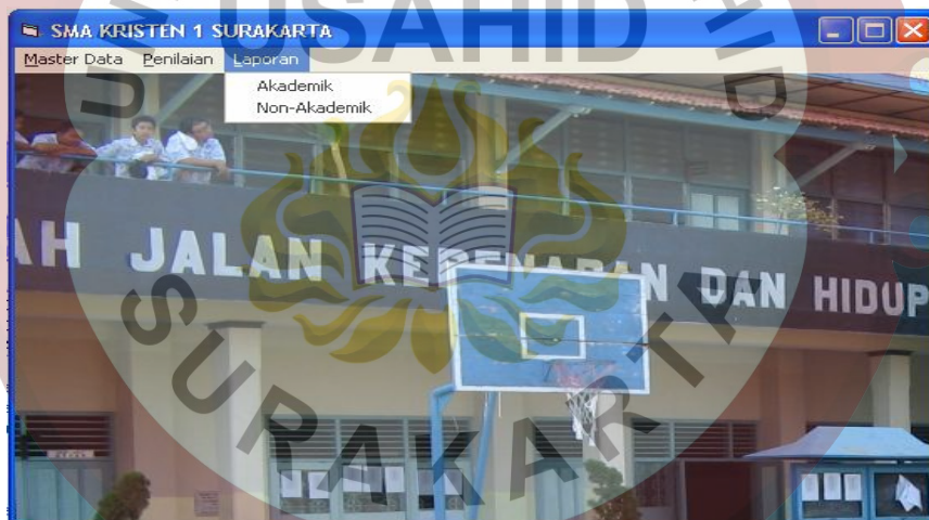
Gambar L.9 Form Menu Laporan