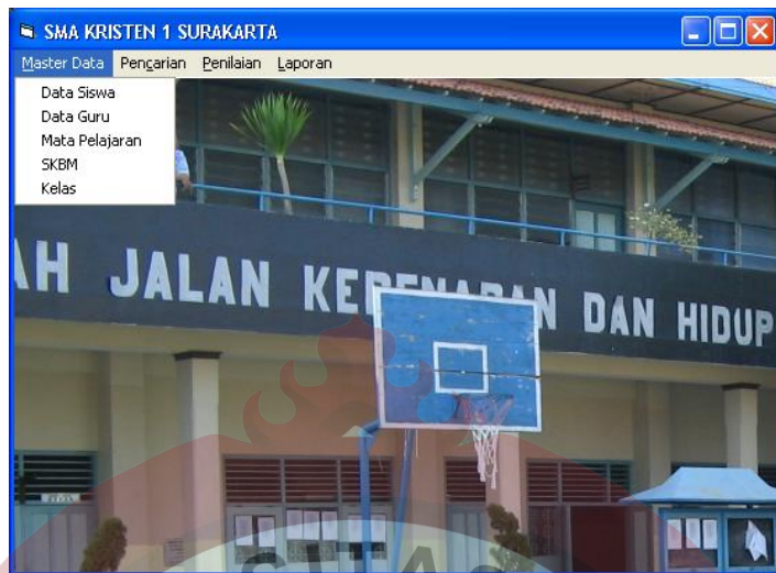
Gambar L.6 Form Menu Master Data