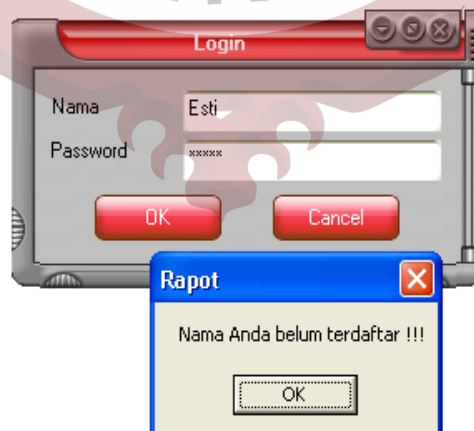
Gambar L.3 Form Login Kesalahan Nama