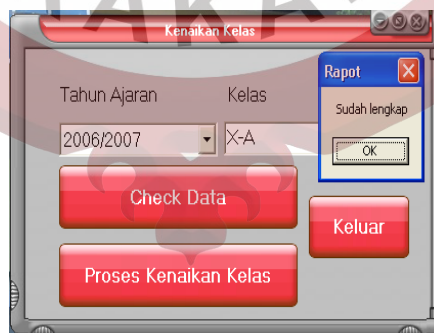
Gambar L.21 Form Kenaikan Kelas Check Data Sudah Lengkap