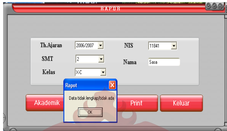
Gambar L.24 Form Rapot Data Tidak Lengkap