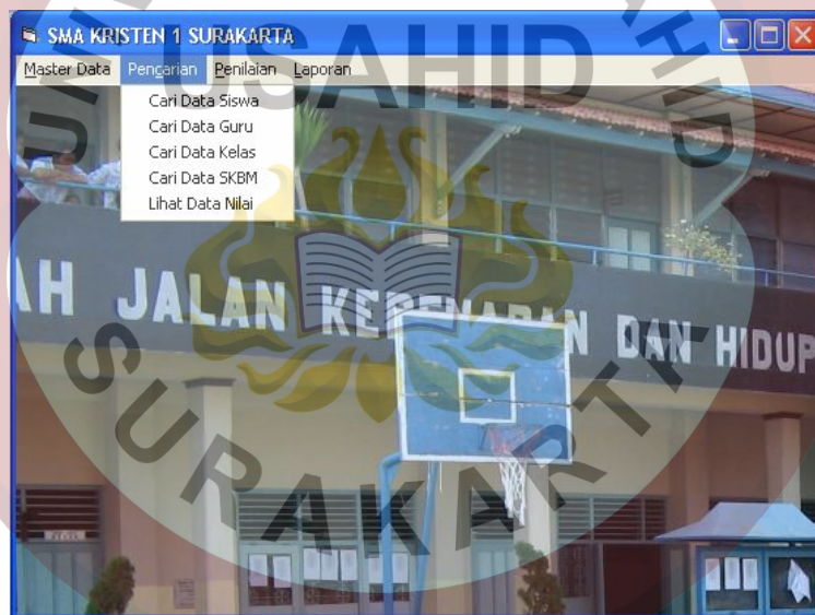
Gambar L.7 Form Menu Pencarian