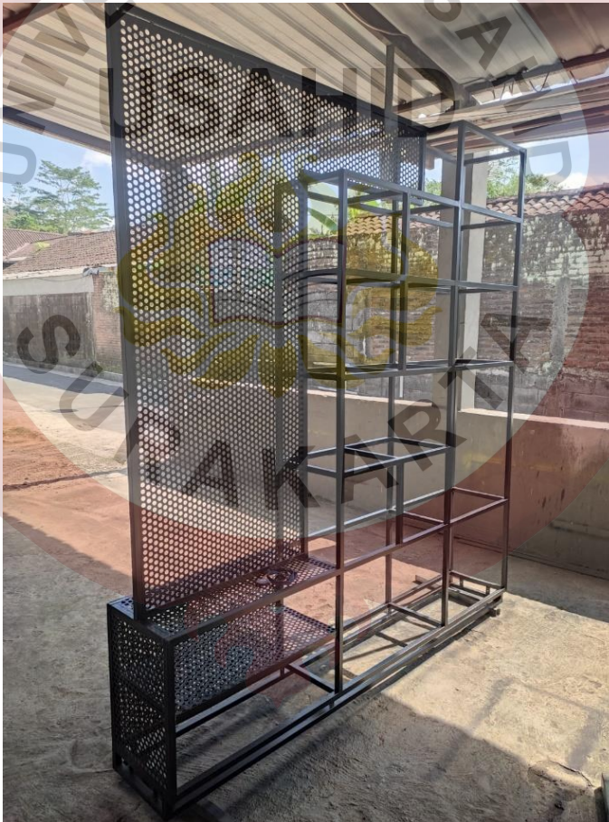
Lampiran 4 Rangka Partisi