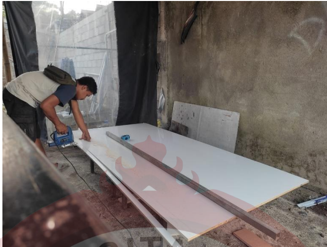
Lampiran 3 Pemotongan Multiplek