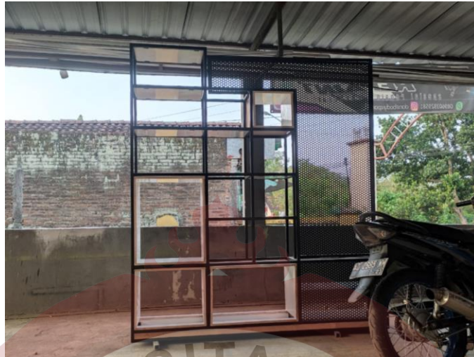
Lampiran 5 Rangka Partisi