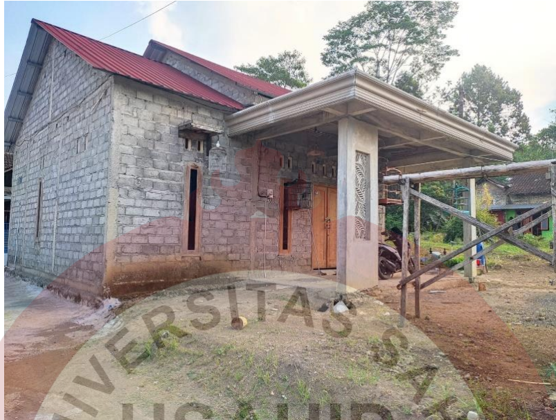
Lampiran 1 Objek Rumah Tinggal