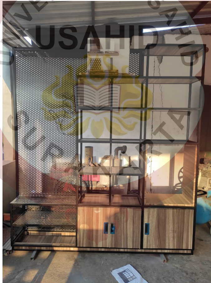
Lampiran 6 Hasil Produk Partisi