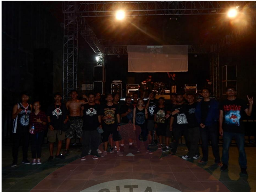
Gambar 2.2. Team Event organizer Dialog Musik Kita