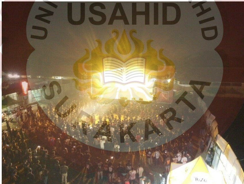
Gambar 2.3. Event Gondang Metal Fest