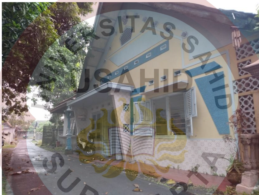
Gambar 2.1. Kantor Event Organizer Dialog Musik kita

Alamat : Gang Lima Puluh Emas. Badran31, Gondang, Sragen57254.