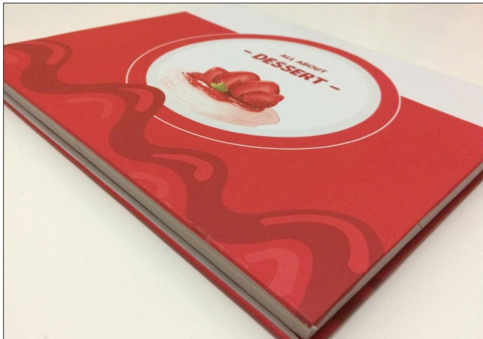
Lampiran 2. Buku all about dessert 2 ( Annisa Esti Qodari : 2017)