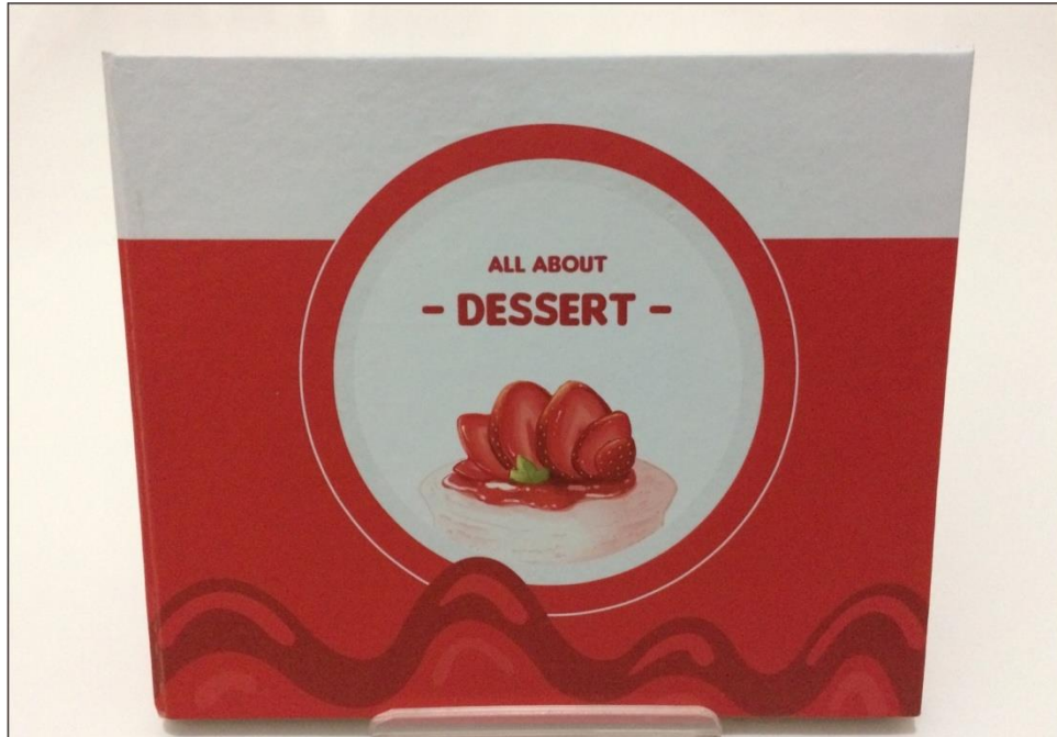
Lampiran 1. Buku all about dessert 1 ( Annisa Esti Qodari : 2017)