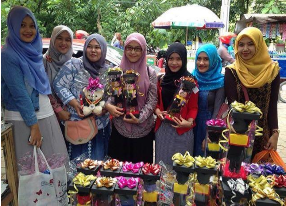
Brickos Felt Bersama Konsumen dalam Acara Wisuda 4 Maret 2016.