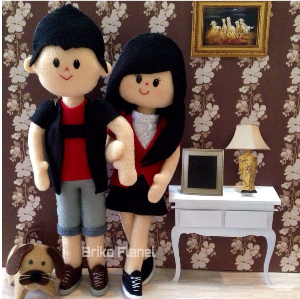
Produk Boneka Couple .