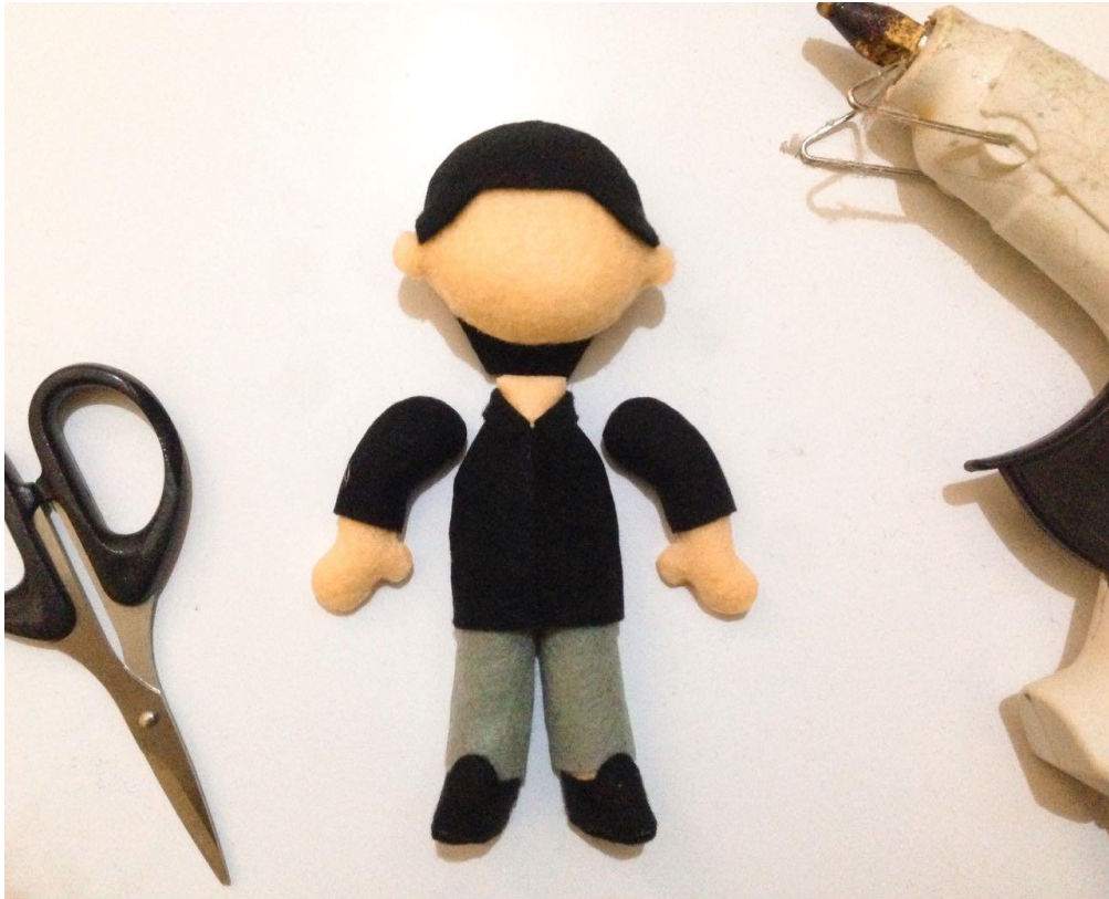
Proses Penyatuan Boneka dan Pakaianya dengan Lem Tembak.