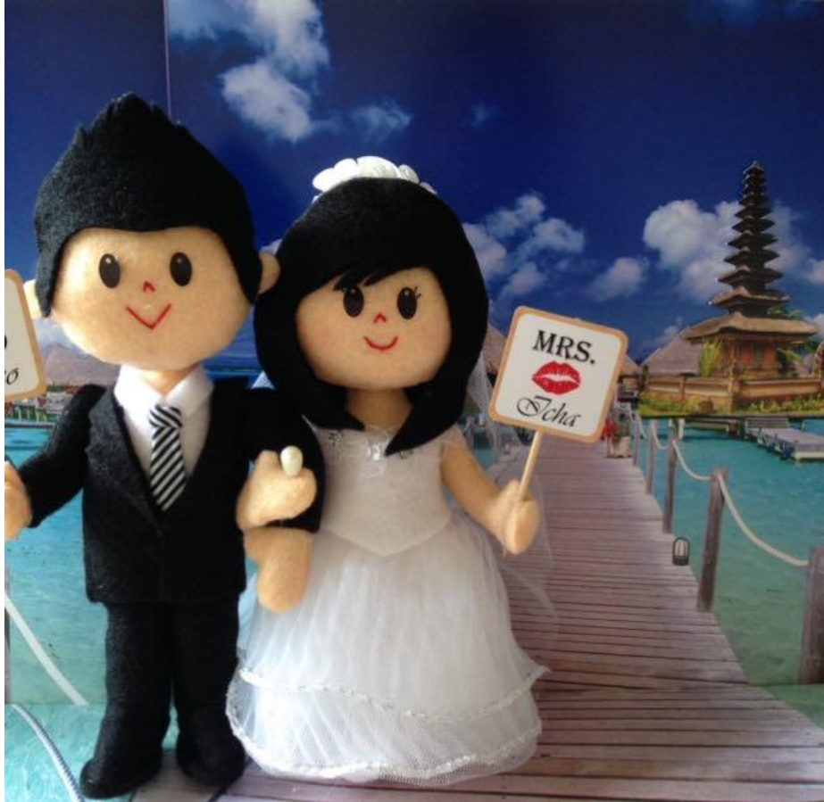
Produk Boneka Penganten Modern.