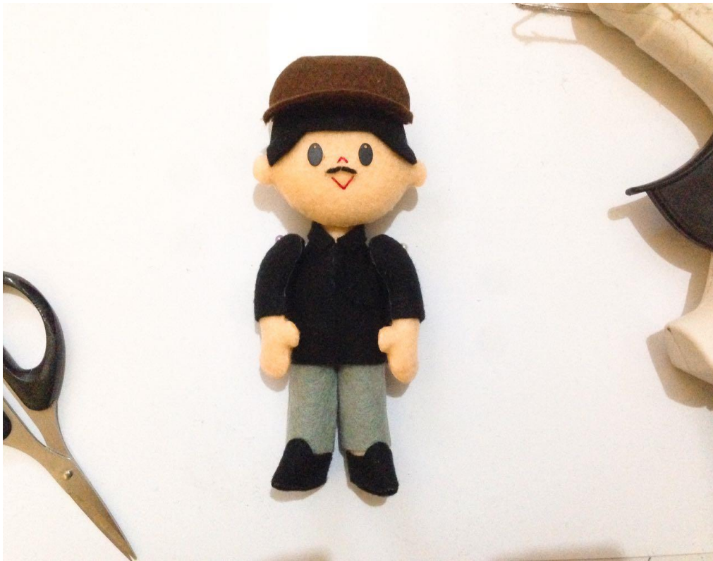
Proses Finishing.