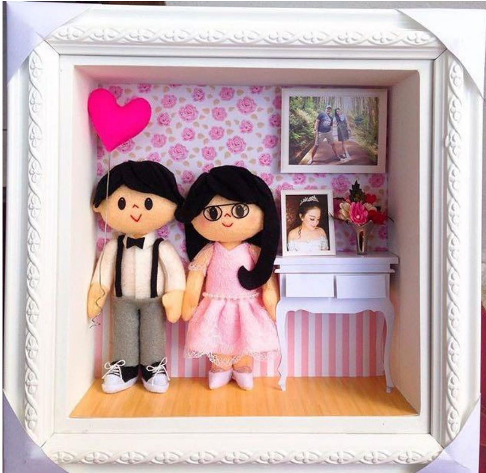
Produk Boneka Couple .