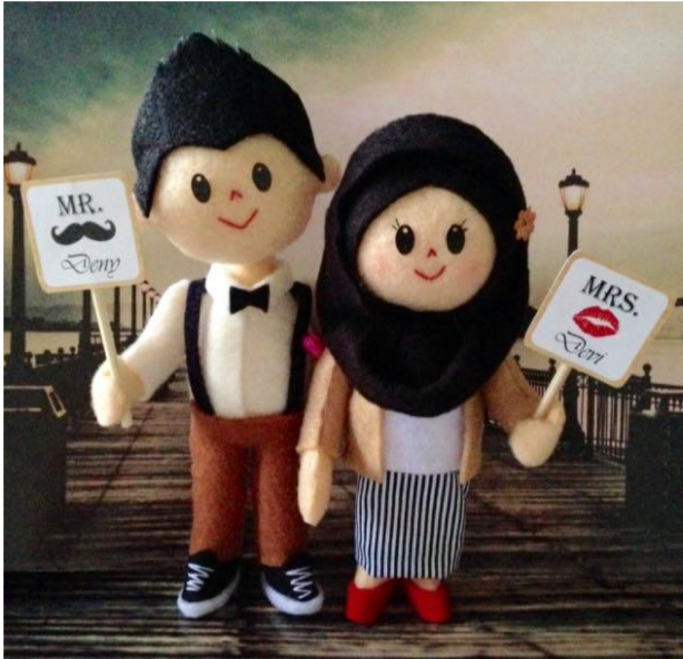
Produk Boneka Couple .