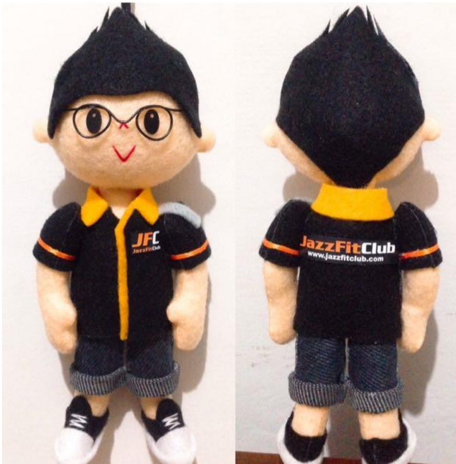
Produk Boneka Merchandise Club atau Komunitas.