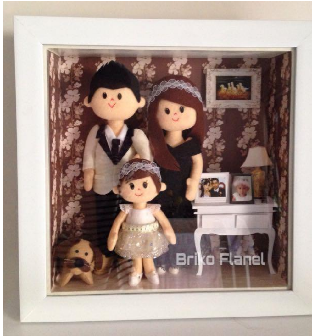
Produk Boneka Keluarga.