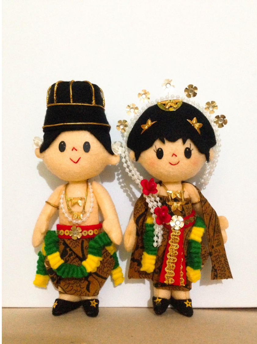
Produk Boneka Manten Jawa Basahan Sepasang.