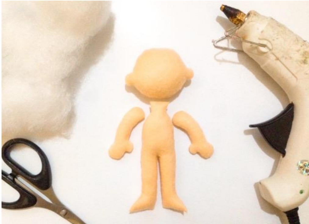
Proses Pengisian Boneka dan Perekatan dengan Lem Tembak.