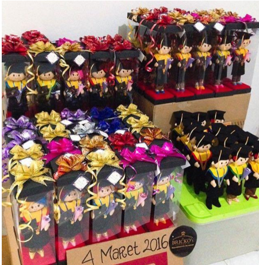
Produk Brickos Felt dalam Suatu acara Wisuda tanggal 4 Maret 2016.