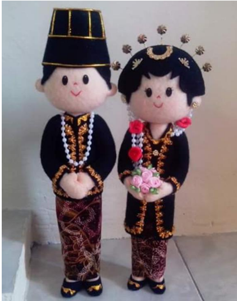
Produk Boneka Manten Jawa.