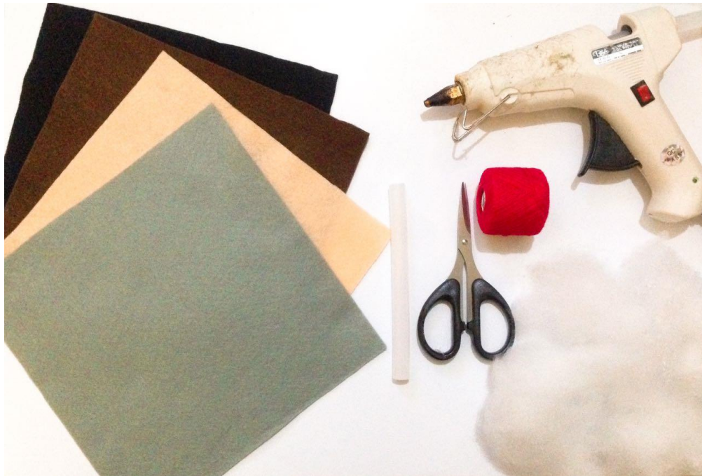
Bahan dan Alat Pembuatan Boneka Handmade .