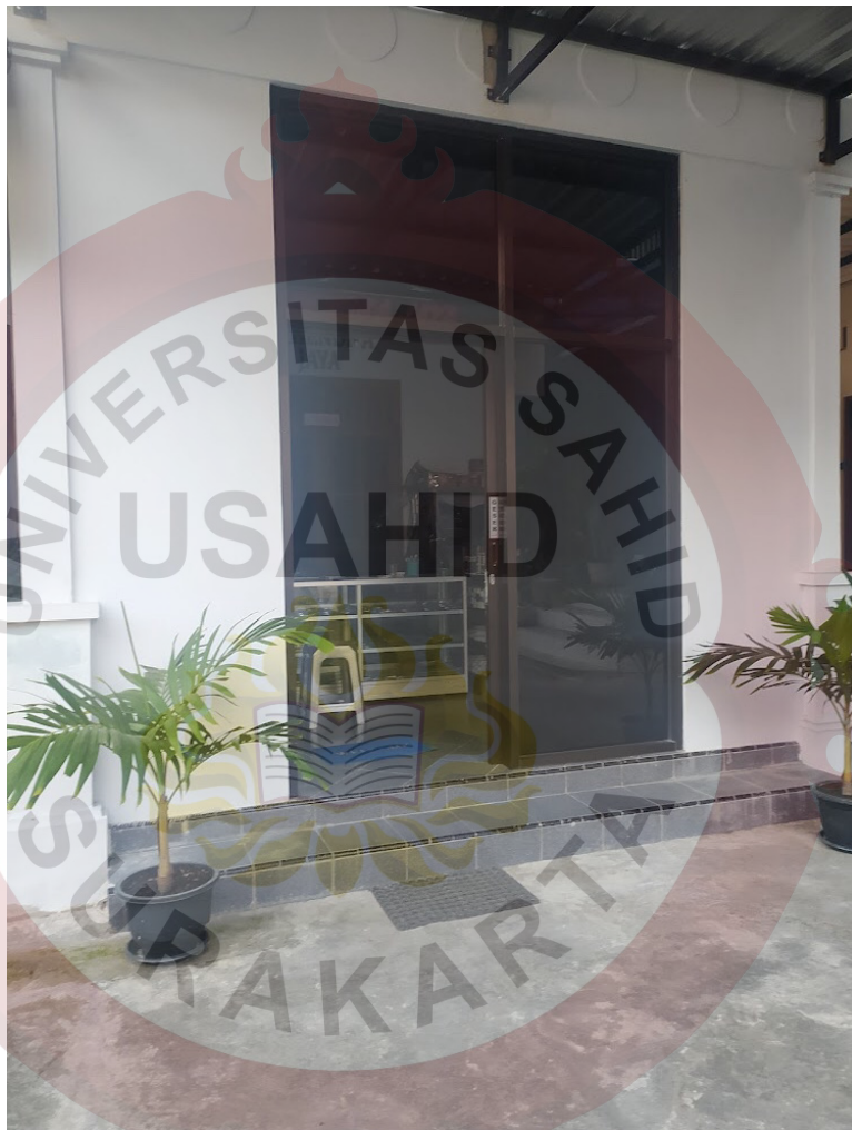
Gambar2.1: Tampilan depan toko Alter clothing

memenuhi target, maka Alter clothing memperluas strategi promosinya melalui media elektroniknya yaitu sosial media dan market place untuk memperluas jangkauan target audience secara efisien.