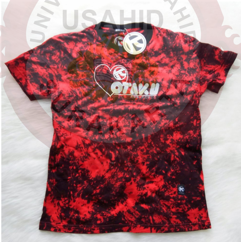
Gambar2.4: Produk Kiseki apparel

Nama Produk : Kiseki apparel Posisi Produk : Clothing store Jenis Produk : Kaos tie dye Bahan kaos : Cotton Combed 30s Warna : Putih Ketebalan : Gramasi 140-160 gr/m 2 Ukuran : Medium, Large, Xtra Large dan double Xtra Large