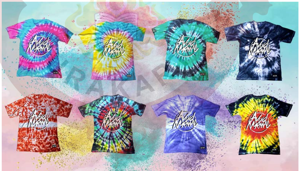
Gambar2.3: Produk Alter clothing