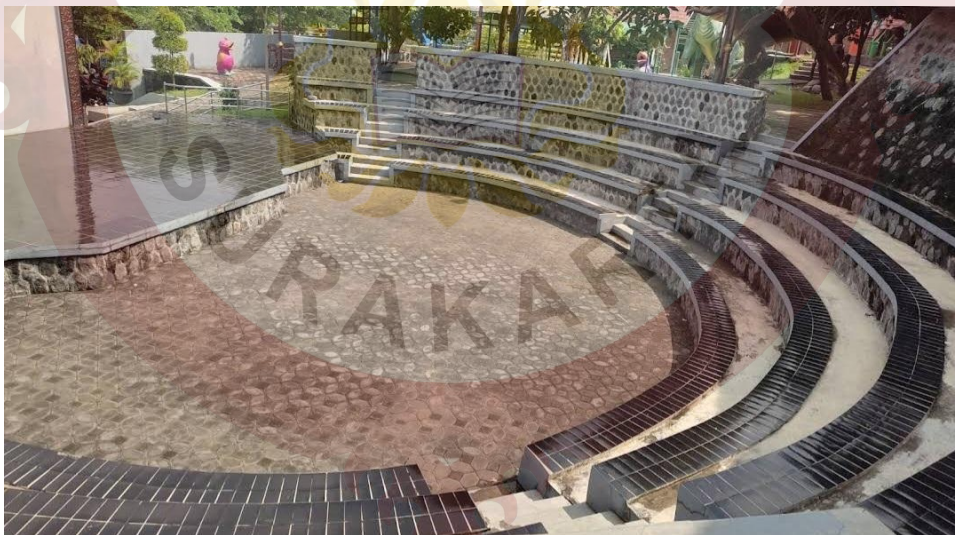
Gambar 13. Teater Pertunjukan