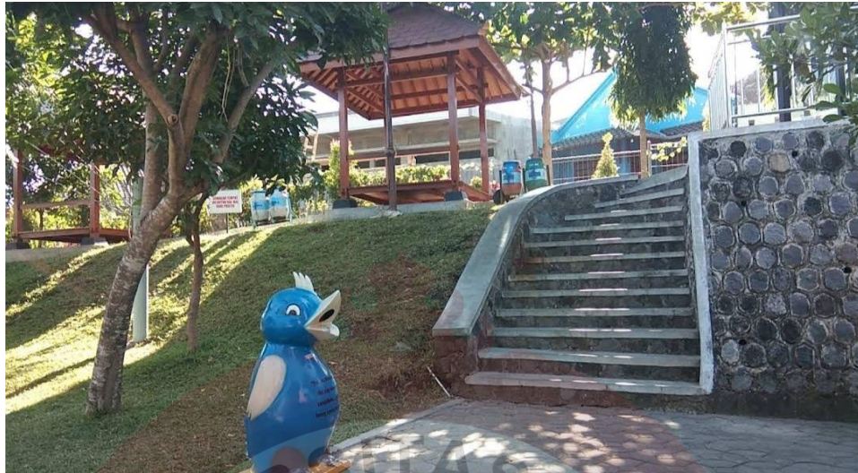
Gambar 12. Gazebo Ganda Sumber ( Foto Maps Edgar 2019)