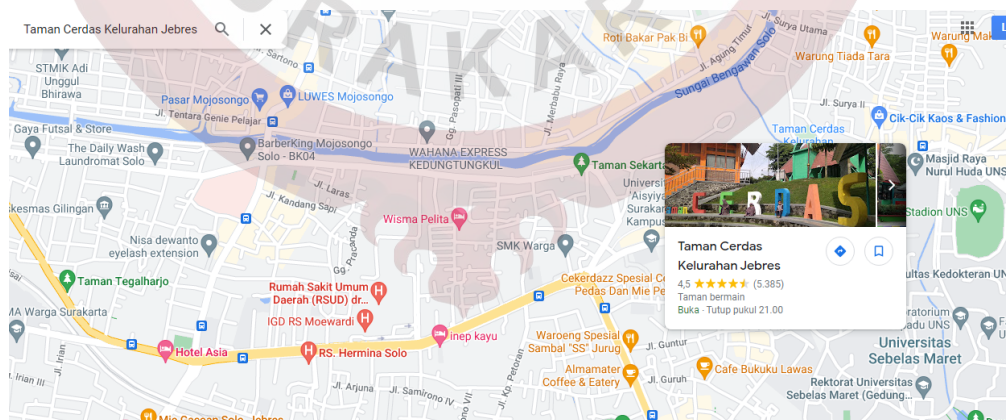
Gambar 02. Lokasi Taman Cerdas Soekarno Hatta Jebres Surakarta

Alamat Taman : Jl. Ki Hajar Dewantara RT02 RW25, Jebres, Jl. Surya 1 Tengah No. 25 Kecamatan Jebres, Kota Surakarta, Jawa Tengah 57126. Maps : Taman Kelurahan Jebres Surakarta.