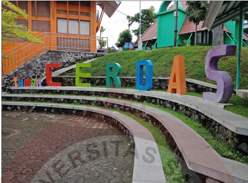
Gambar 10. Mini Tribun