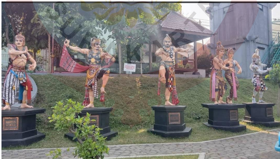
Gambar 15. Tokoh Pewayangan Sumber ( Foto Maps Akhmad 2022 ).