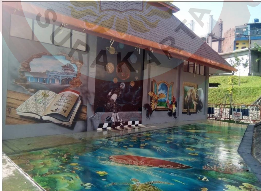
Gambar 17. Lukisan Tiga Dimensi