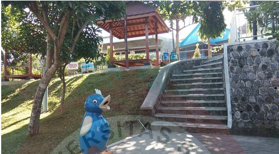
Gambar 12. Gazebo Ganda