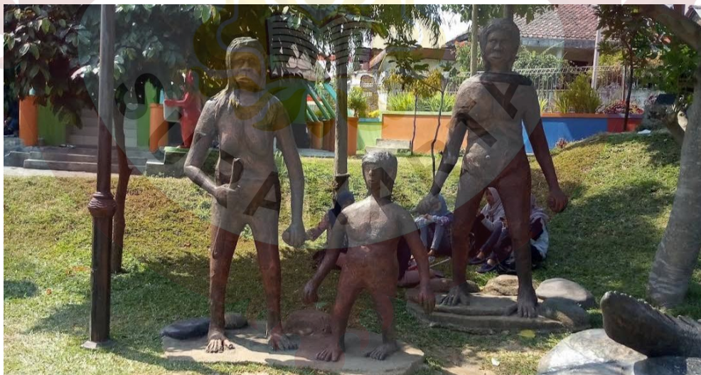
Gambar 11. Patung Manusia Purba