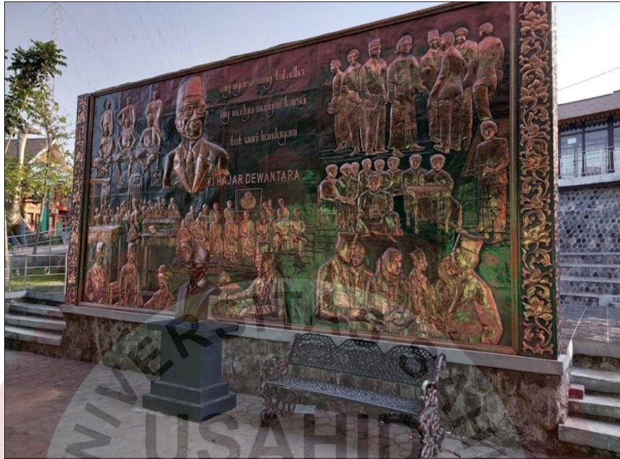
Gambar 08. Relief Ki Hajar Dewantara