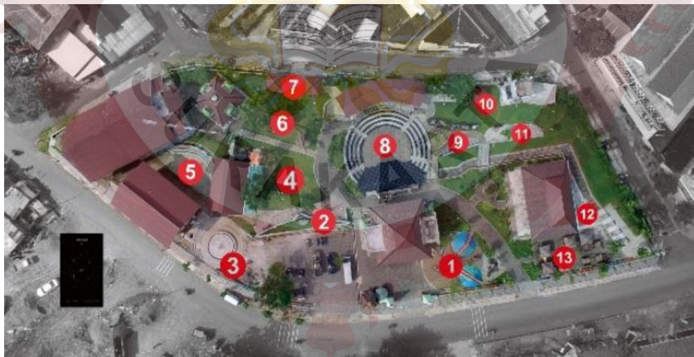
Gambar 05. Fasilitas Taman Cerdas Soekarno Hatta