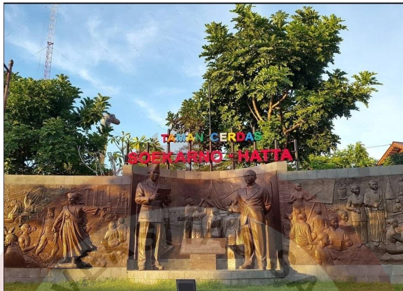
Gambar 04. Taman Cerdas Soekarno Hatta