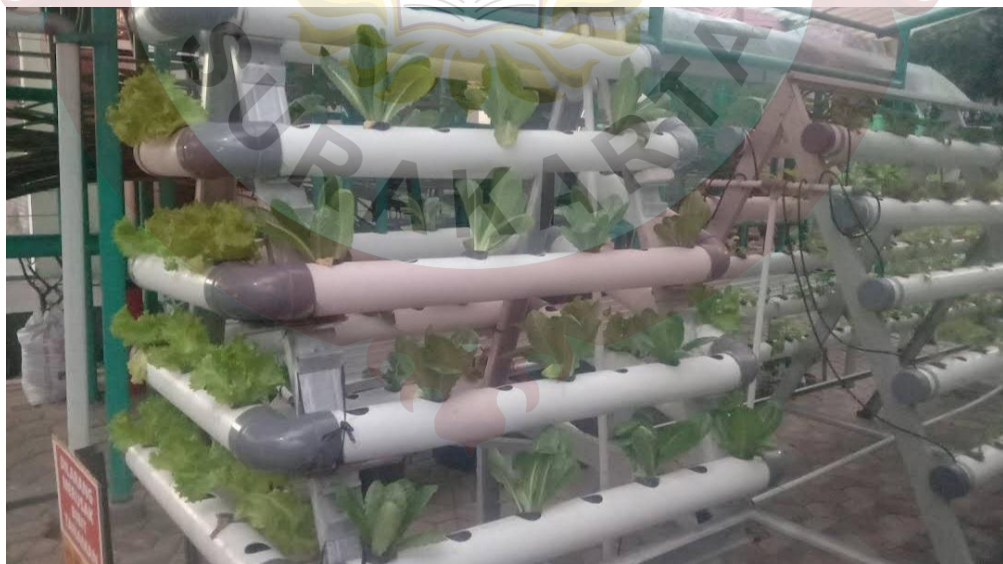
Gambar 09. Hidroponik