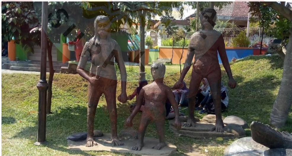
Gambar 11. Patung Manusia Purba