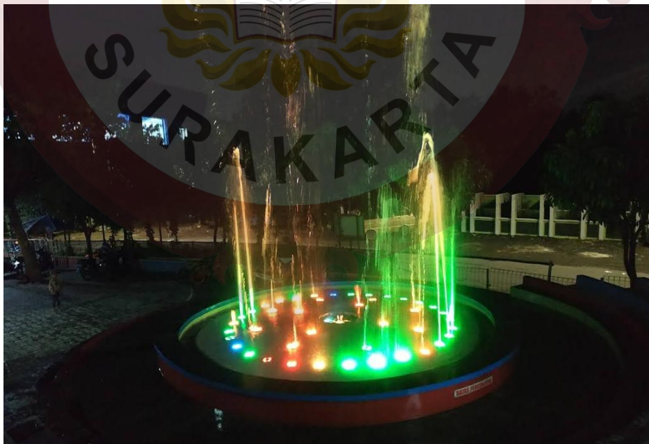
Gambar 07. Air Mancur Sumber ( Foto Maps Isa 2019 )