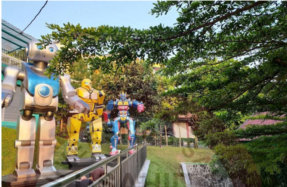
Gambar 16. Patung Robotik Sumber ( Foto Maps Rizal 2022 )