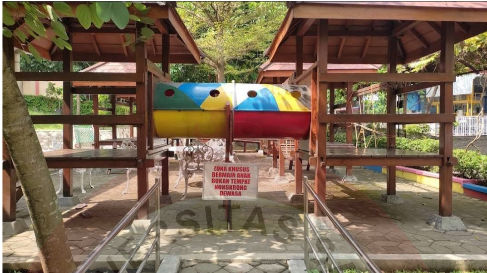
Gambar 18. Area Bermain Dan Gazebo

Taman Cerdas Soekarno-Hatta yang diresmikan pada tahun 2015 dengan jam operasional 09.00 – 21.00 WIB berlokasi di Jl.Ki Hajar Dewantara RT 02 RW 25 Jebres, Kota Surakarta, Jawa Tengah. Dibangun di atas lahan seluas 3,5 hektar dengan latar belakang ingin memfasilitasi sarana prasarana yang dapat mengembangkan potensi penggunaanya khusus nya anak-anak guna mendukung program pemerintah Kota Surakarta sebagai Kota Layak Anak. Selain itu jaminan warga dalam menikmati hak pendidikan adalah tanggung jawab bersama sehingga Taman Cerdas Soekarno-Hatta Surakarta memiliki peran yang konkrit sebagai communal space di Surakarta. Terdapat pengunjung dari berbagai kalangan datang menikmati fasilitas yang disediakan. Fasilitas tersebut berupa lima bangunan besar yaitu kantor atau gedung utama, gedung serbaguna, gedung edukasi, audio visual dan gedung teater serta fasilitas lainnya pada area terbuka