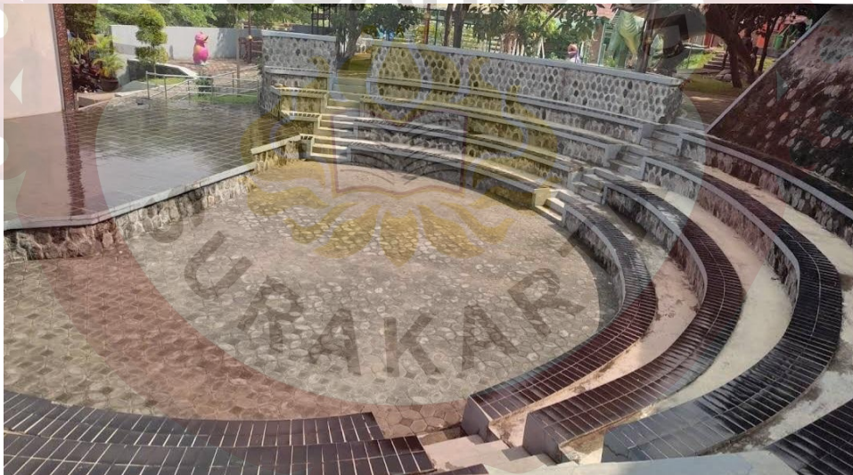
Gambar 13. Teater Pertunjukan Sumber ( Foto Maps Rima 2022 )