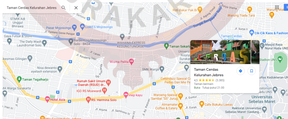
Gambar 02. Lokasi Taman Cerdas Soekarno Hatta Jebres Surakarta

Alamat Taman : Jl. Ki Hajar Dewantara RT02 RW25, Jebres, Jl. Surya 1 Tengah No. 25 Kecamatan Jebres, Kota Surakarta, Jawa Tengah 57126. Maps : Taman Kelurahan Jebres Surakarta.