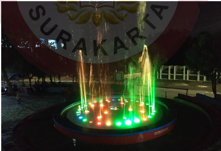
Gambar 07. Air Mancur Sumber ( Foto Maps Isa 2019 )