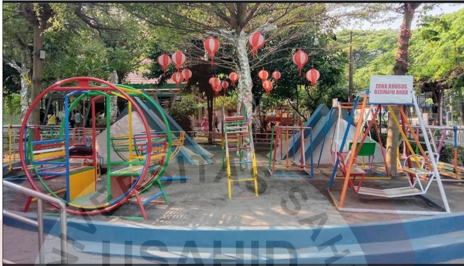
Gambar 06. Taman Bermain Anak Sumber ( Foto Maps Akhmad 2022 )

Fasilitas yang berada di Taman Cerdas Soekarno Hatta meliputi :