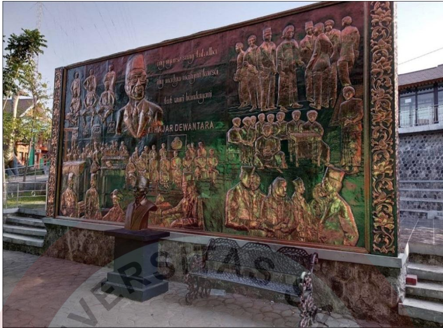
Gambar 08. Relief Ki Hajar Dewantara