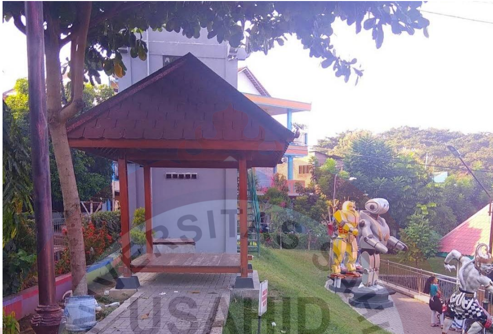
Gambar 14. Gazebo Tunggal Sumber ( Foto Maps Ihsan 2021 )