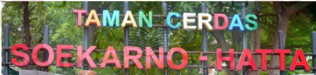
Gambar 03. Logo Taman Cerdas Soekarno Hatta

Logo Taman Cerdas saat ini menggunakan jenis logo yang berupa tulisan yang disebut letter mark saja yang diberi warna orange, biru, merah, hijau, kuning, dan putih dalam font yang berukuran berbeda untuk tulisan taman berbentuk font kecil semua dan untuk tulisan cerdas berbentuk font besar semua, alasan tiap font menggunakan berbagai banyak warna supaya terlihat jelas. Proses pembuatan logo yang dibuat berupa picture mark dan letter mark (elemen gambar dan tulisan saling terpisah), Perancangan logo ini dapat menjadi acuan mengenai pembuatan logo yang efektif, menarik, dan simple untuk memberikan respon ke masyarakat supaya mudah untuk dikenal dan menarik minat pengunjung. Menciptakan suatu image harus mampu memperbaiki citra supaya lebih baik.