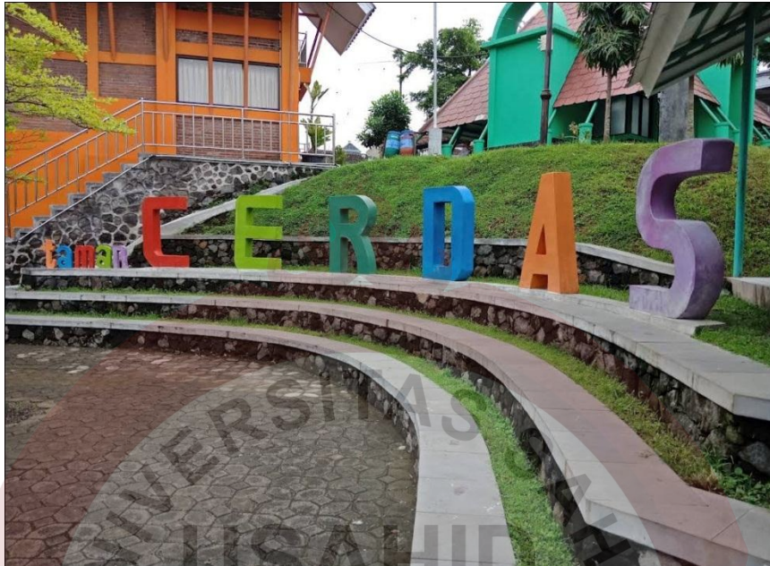
Gambar 10. Mini Tribun Sumber ( Foto Maps Udin 2020)