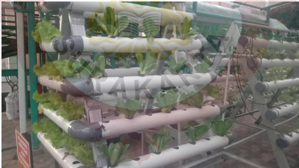
Gambar 09. Hidroponik