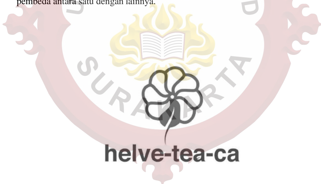
Gambar 6 : contoh Logo (Helveteaca Pionner Kedai Tea)

Menurut Rustan (2013) “Logo adalah elemen gambar/symbol pada identitas visual” . Oleh karena itu sebuah perusahaan pastinya membutuhkan sebuah identitas agar dapat dikenal dan di ingat oleh banyak masyarakat luas dan sebagai pembeda antara satu dengan lainnya.