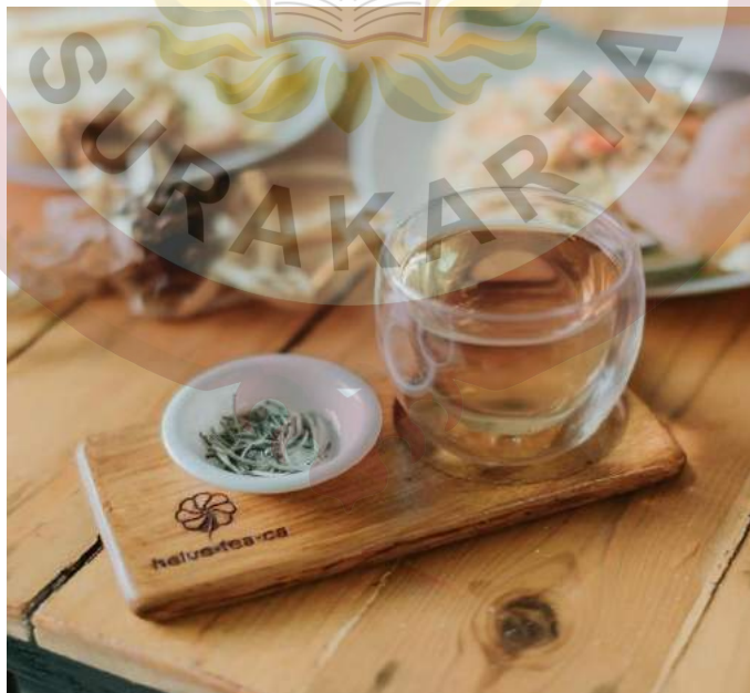
Gambar 11 : Salah satu sajian Helveteaca Pionner Kedai Tea dalam kemasan plastic.