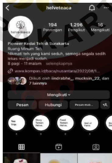
Gambar 5 : Facebook Helveteaca Pionner Kedai Tea

Di Instagram Helveteaca Pionner Kedai Tea ini para konsumen dapat mencari informasi terkini terkait, Helveteaca Pionner Kedai Tea baik seperti harga promo, menu-menu terbaru, cerita-cerita dan foto-foto aktivitas pengunjung dari Helveteaca Pionner Kedai Tea.