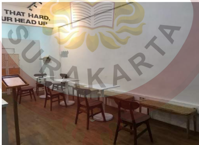
Gambar 9 : Bagi kursi dan meja (Helveteaca Pionner Kedai Tea)

Tampak dari dalam suasana Helveteaca Pionner Kedai Tea, tidak hanya bagian luar yang dipakai sebagai spot untuk berfoto, tapi bagian dalamnyapun sangat menarik untuk dijadikan sebagai spot berfoto.