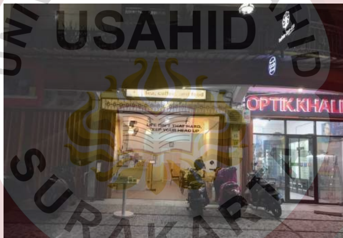
Gambar 7 : Bagi luar (Helveteaca Pionner Kedai Tea)

Untuk menarik minat calon konsumen Helveteaca Pionner Kedai Tea tidak hanya menyediakan sajian kopi dan teh yang nikmat tetapi juga suasana dan kenyamanan tempat untuk mempengaruhi dan menarik minat konsumen, dengan mengambil konsep bangunannya yang sedikit berbeda Helveteaca Pionner Kedai Tea menonjolkan sisi desain arsitektur yang khas dengan konsep minimalis dengan dinding kaca di sekeliling ruangan menambah kesan simpel dan tenang yang dapat digunakan oleh para konsumen sebagai spot untuk berfoto