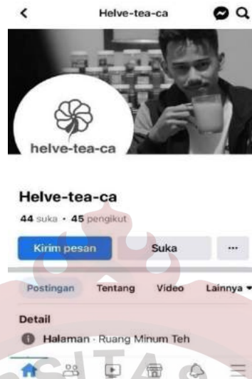
Gambar 4 : Facebook Helveteaca Pionner Kedai Tea