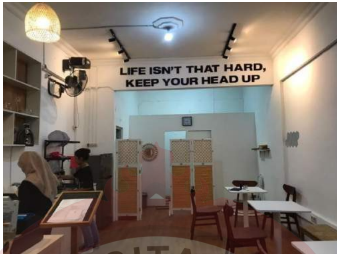
Gambar 8 : Bagi dalam (Helveteaca Pionner Kedai Tea)

Tampak dari dalam suasana Helveteaca Pionner Kedai Tea, tidak hanya bagian luar yang dipakai sebagai spot untuk berfoto, tapi bagian dalamnyapun sangat menarik untuk dijadikan sebagai spot berfoto.