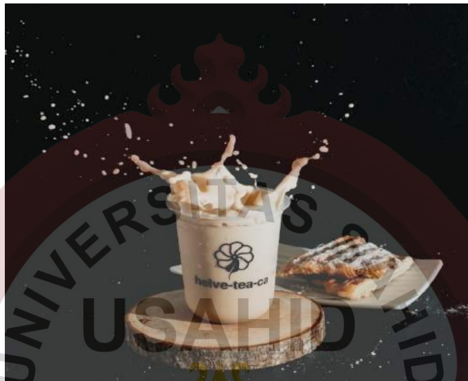
Gambar 10 : Salah satu sajian Helveteaca Pionner Kedai Tea dalam kemasan plastic.

Meja tersebut bebas ditempati oleh semua pengunjung yang datang ke Helveteaca Pionner Kedai Tea. Ditambah lagi dengan beberapa kursi sederhana memanjang yang merapat ke dinding dan menggunakan kotak yang terbuat dari kayu sebagai meja atau tempat menyimpan makanan