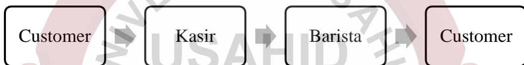
Tabel 12 : Sumber Helveteaca Pionner Kedai Tea, 2021

Prosedur Pelayanan Helveteaca Pionner Kedai Tea Surakarta