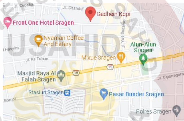
Gambar 9. Denah Gedhein Kopi Sragen Sumber (Gedhein Kopi, 2020)

Harga 17.000,00. Tersedia beberapa varian lainnya