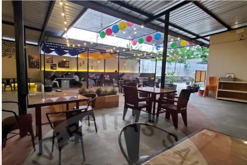
Gambar 5. Lokasi Gedhein Kopi Sragen