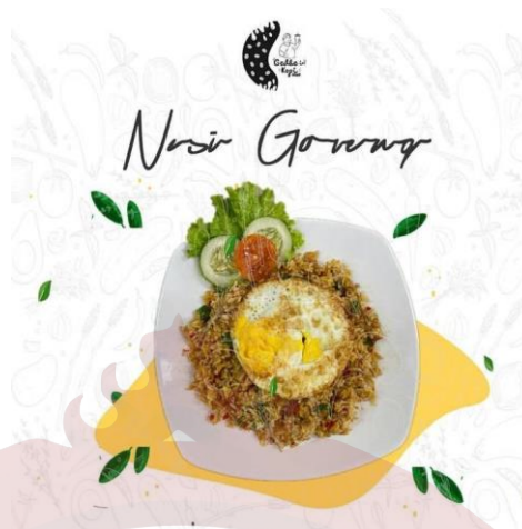
Gambar 24. Nasi Goreng Gedhein Kopi Sragen

p. Korean Beef Gochujang Harga 28.000,00