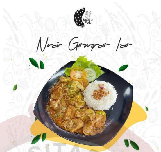
Gambar 26. Nasi Gongso Isa Gedhein Kopi Sragen Sumber (Gedhein Kopi, 2020)