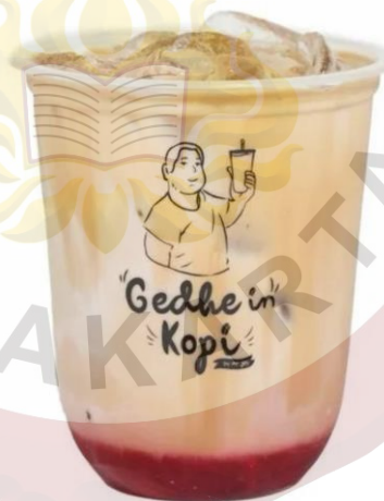
Gambar 21. Authentic Milk Tea Gedhein Kopi Sragen