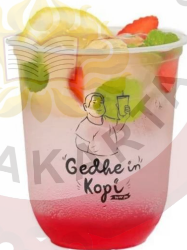
Gambar 17. Gedhein Mojito Gedhein Kopi Sragen