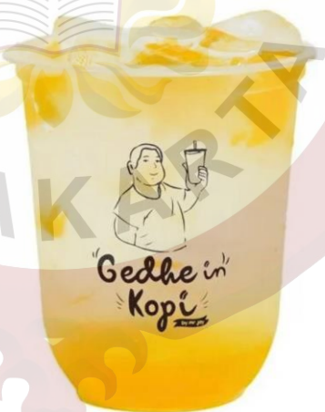
Gambar 15. Sprakling Series Gedhein Kopi Sragen

f. Sparkling Series Harga 18.000,00. Tersedia beberapa varian lainnya