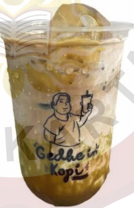
Gambar 13. Signature Coffee Gedhein Kopi Sragen Sumber (Gedhein Kopi, 2020)