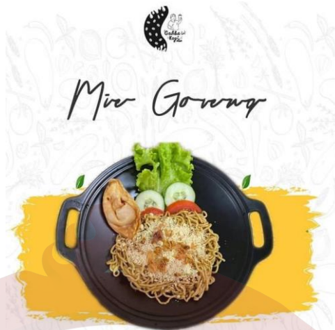
Gambar 28. Mie Goreng Gedhein Kopi Sragen