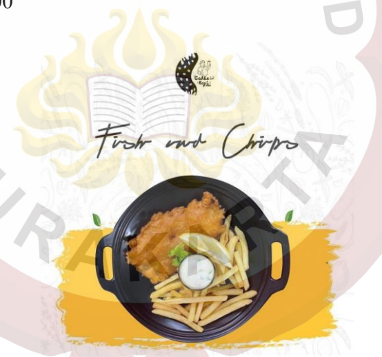
Gambar 27. Fish and Chips Gedhein Kopi Sragen Sumber (Gedhein Kopi, 2020)