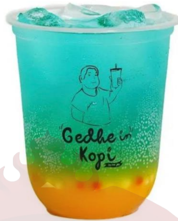
Gambar 18. Soda Series Gedhein Kopi Sragen

j. Cheese Cream Harga 17.000,00. Tersedia beberapa varian lainnya.