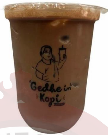
Gambar 20. Premium Choco Gedhein Kopi Sragen