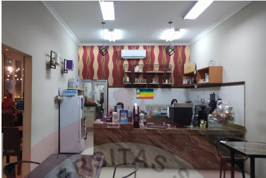
Gambar 7. Tempat Indoor Gedhein Kopi Sragen