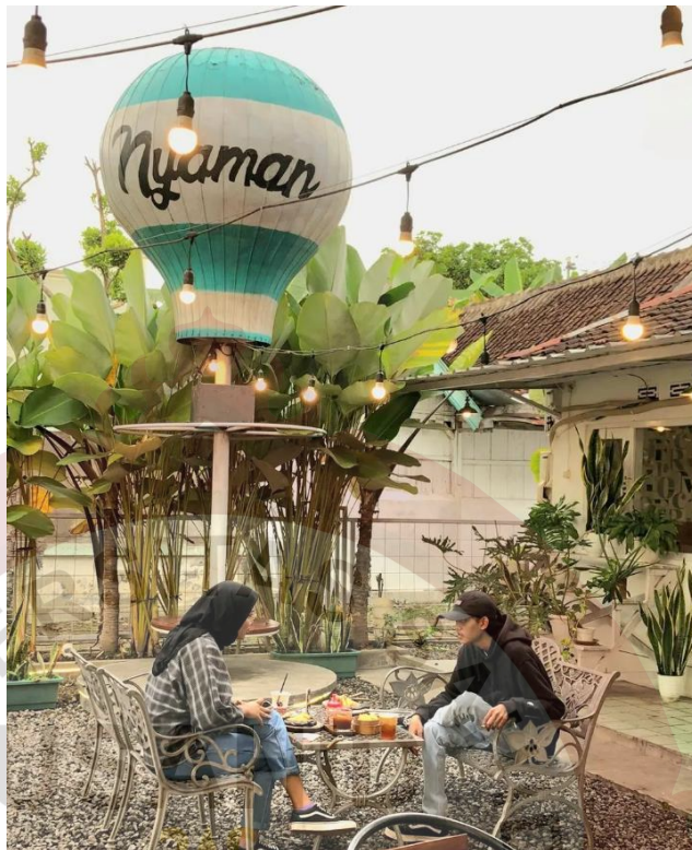
Gambar 29. Nyaman Coffee and Eatery Sragen