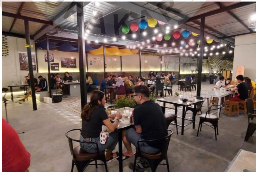
Gambar 4. Lokasi Gedhein Kopi Sragen