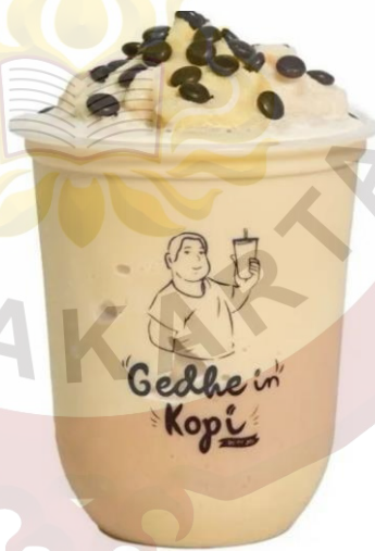
Gambar 11. Ultimate Frappio Gedhein Kopi Sragen