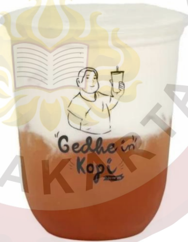
Gambar 19. Cheese Cream Gedhein Kopi Sragen

j. Cheese Cream Harga 17.000,00. Tersedia beberapa varian lainnya.