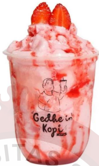
Gambar 14. Yoghurt Smothies Gedhein Kopi Sragen

f. Sparkling Series Harga 18.000,00. Tersedia beberapa varian lainnya