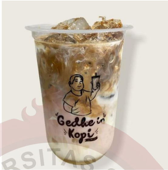
Gambar 10. Original Coffee Gedhein Kopi Sragen