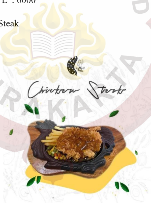
Gambar 23. Chicken Steak Gedhein Kopi Sragen