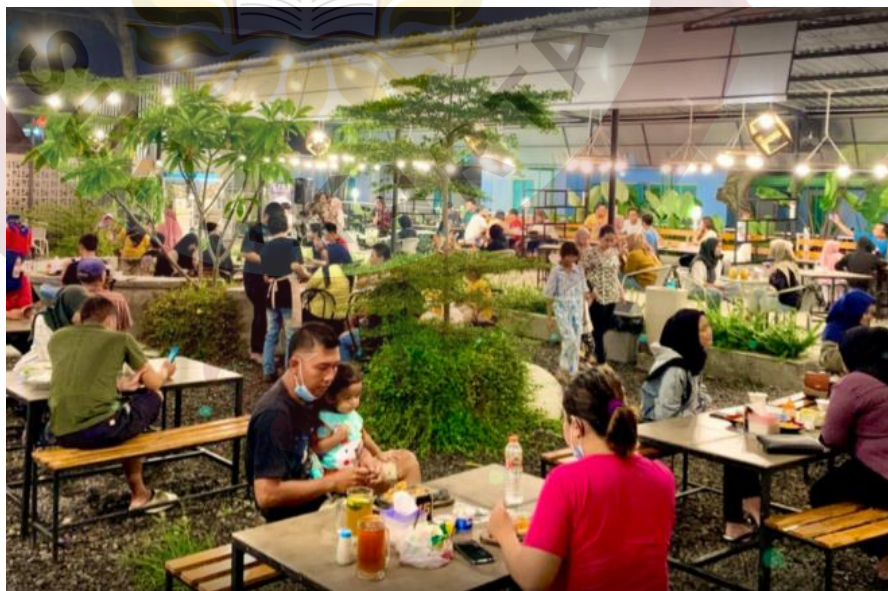
Gambar 30. Nyaman Coffee and Eatery Sragen