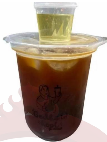
Gambar 12. Coffee Classica Gedhein Kopi Sragen