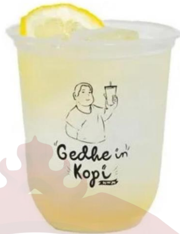
Gambar 16. Squad Lemonade dan Yakulties Gedhein Kopi Sragen