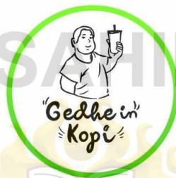
Gambar 3. Logo Gedhein Kopi Sumber (Gedhein Kopi, 2020)