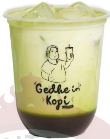
Gambar 22. Latte Milk Gedhein Kopi Sragen

Tersedia 3 upsize untuk minuman yaitu S, M, dan L Harga upsize M : 3000 Harga upsize L : 6000