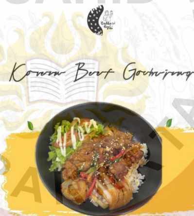
Gambar 25. Korean Beef Gochujang Gedhein Kopi Sragen

p. Korean Beef Gochujang Harga 28.000,00