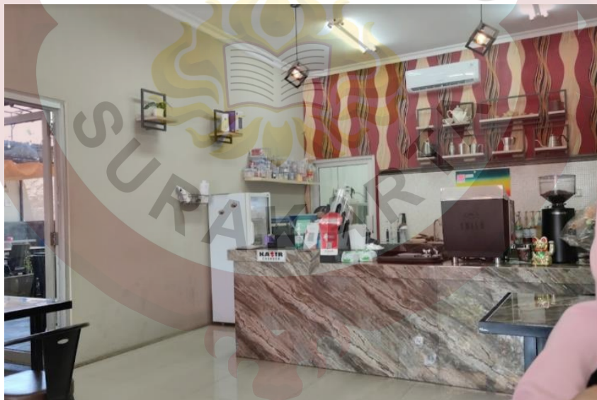
Gambar 6. Kasir Gedhein Kopi Sragen