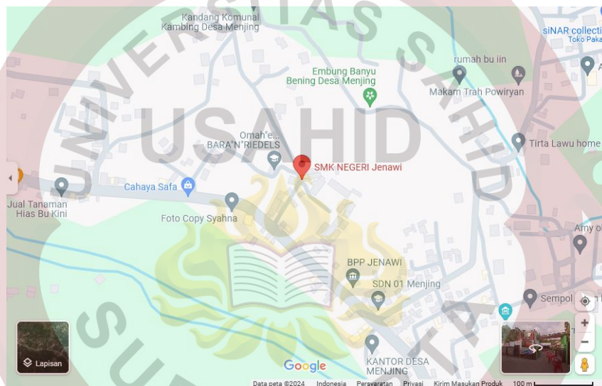
Gambar 3. Peta Lokasi SMKN Jenawi Karangnyar ( https://maps.app.goo.gl/pfsqLBWj2J3oYjEB7 )

SMKN Jenawi adalah Sekolah Menengah kejuruan yang berlokasi di Jalan Raya Balong – Sragen KM.3,5 Jetis, Menjing, Kec. Jenawi, Kabupaten Karanganyar, Jawa Tengah.