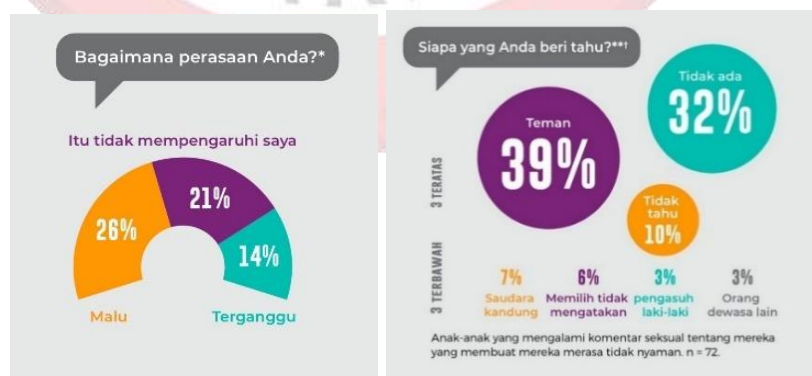
Gambar 11. Data Disrubting Harm in Indonesia

Child Grooming sangat berdampak bagi korban, hal tersebut dapat merusak kesehatan mental. Dampak dari grooming tidak hanya bersifat fisik tetapi juga psikologis, seperti depresi, kecemasan, bahkan trauma jangka panjang (Fadli, 2022 dalam (Debby Syan Rahma Siwi, 2025)).