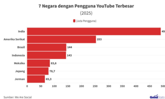
Gambar 14. Data 7 Negara dengan Pengguna YouTube Terbesar (2025)

Hasil pengumpulan data yang menunjukkan bahwa responden memilih video edukasi sebagai media paling efektif untuk mempelajari isu child grooming . Alasan utamanya adalah karena video dinilai lebih mudah dipahami secara visual (80%) dan membantu mengingat informasi lebih baik (13,3%).