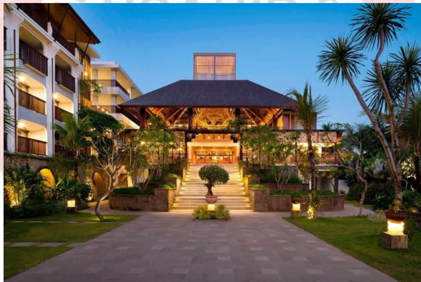
Gambar 1.1 Contoh Resort Luxury Bali

Perkembangan resort pada abad ke-18 di Eropa, tempat seperti SPA dan pemandian air panas menjadi populer di kalangan bangsawan sebagai tempat penyembuhan dan relaksasi. Tempat ini kemudian berkembang menjadi resort dengan fasilitas makan, hiburan, dan penginapan. Pada akhir abad ke-19, resort mulai bermunculan di Amerika Serikat, terutama di sekitar danau, pegunungan, dan pantai. Contohnya Mohonk Mountain House di New York dan The Balsams Grand Resort Hotel di New Hampshire. Resort-resort ini menawarkan aktivitas luar ruang seperti hiking , memancing, dan berperahu. Seiring waktu, konsep resort semakin berkembang dengan menggabungkan unsur budaya, ekowisata, dan keberlanjutan lingkungan. ( Luxury Travel Diva ).