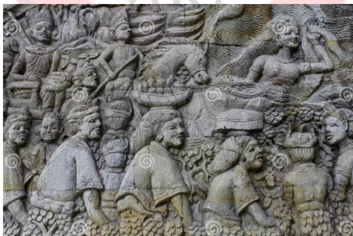
Gambar 1.3 Contoh ukiran putri Mandalika khas Sasak

Budaya Lombok khususnya Suku Sasak, sangat memiliki nilai-nilai lokal yang kuat, mencerminkan hubungan harmonis antara manusia, alam, dan spiritualitas. ArSitektur tradisional Sasak seperti Bale Tani, Bale Lumbang, dan Berugak, tidak hanya berfungsi sebagai tempat tinggal, tetapi juga filosofi hidup dan simbol identitas budaya. Ciri khas arSitektur Lombok tampak pada bentuk atap menyerupai tumpeng terbalik yang melambangkan kesakralan dan hubungan manusia dengan alam semesta. Interior rumah tradisional juga banyak dihiasi dengan ukiran bermotif flora, fauna, dan simbol religius yang sarat makna, seperti ukiran Putri Mandalika. (Wahyudi & Wikantiyoso, (2021))