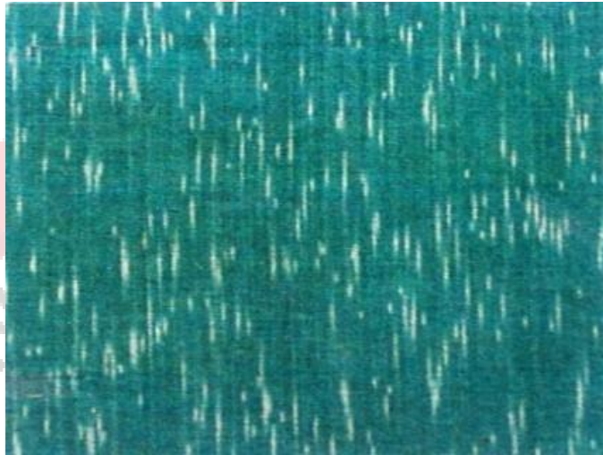
Gambar 2.4 Corak Udan Liris

Corak udan liris melambangkan hujan gerimis sebagai simbol kesuburan dan kesejahteraan, sehingga dahulu dipakai penguasa dengan harapan mendapat berkah dan membawa kemakmuran bagi pengikutnya. (Ditha et al., 2023)