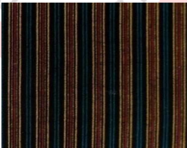
Gambar 2.3 Corak Sapit Urang