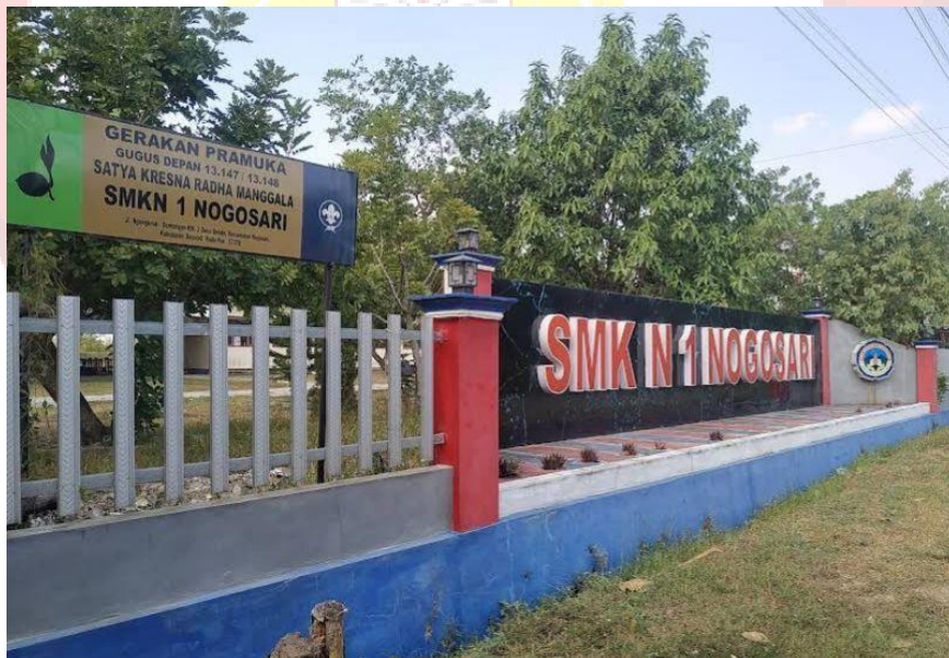
Gambar 2. 7 SMK N 1 Nogosari