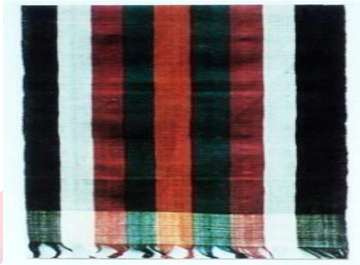
Gambar 2.2 Corak Kluwung Sumber (Nian S. Djoemena)

Lurik corak kluwung, yang terinspirasi dari pelangi sebagai tanda kebesaran Tuhan, dianggap sakral dan dipercaya sebagai penolak bala. (Ditha et al., 2023)