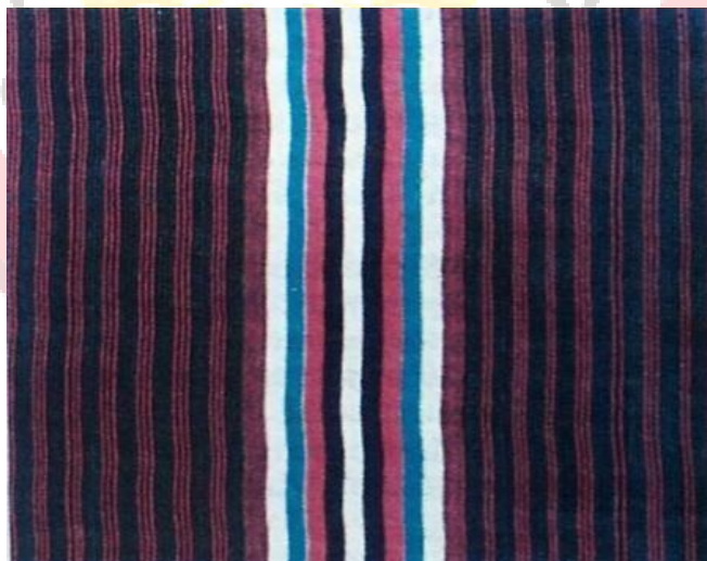
Gambar 2. 6 Corak Liwatan Sumber (Nian S. Djoemena)

Corak Lompatan, yang berarti terlepas dari bahaya maut, digunakan pada kemben dan stagen upacara mitoni sebagai penolak bala bagi ibu hamil. (Ditha et al., 2023)