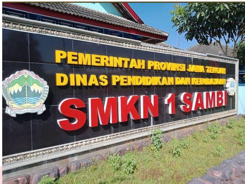
Gambar 2. 8 SMK N 1 Sambu Sumber (Tri Darwoko)