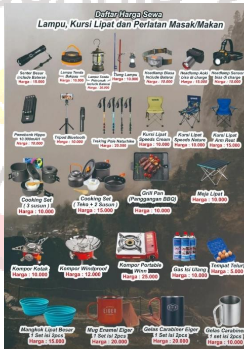
Gambar 41. Produk Vertical Outdoor UMS