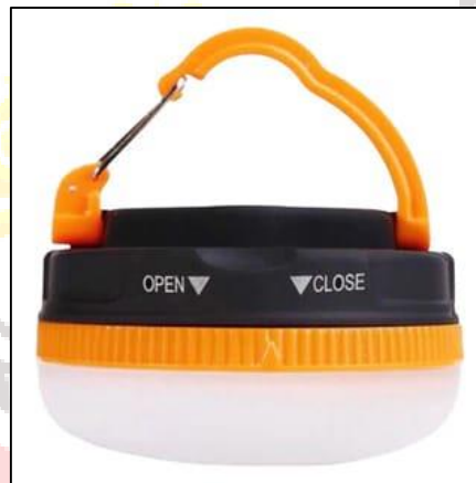
Gambar 21. Produk lampu tenda we adventure

We adventure menyediakan lampu tenda dan baterai yang digunakan untuk menerangi area di sekitar tenda dengan harga sewa Rp. 10.000/hari.