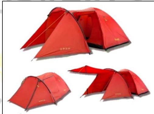
Gambar 9. Produk tenda we adventure

We adventure menyediakan tiga macam ukuran tenda yang disewakan, yaitu dari yang terkecil berkapasitas 1-2 orang, 4-6 orang, dan yang terbesar berkapasitas 8-10 orang dalam satu tenda. Harga sewa tenda di we adventure bervariasi mulai dari Rp. 25.000/hari hingga Rp. 60.000/hari.