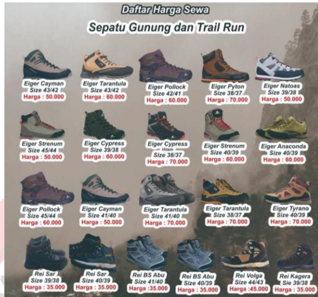
Gambar 42. Produk Vertical Outdoor UMS