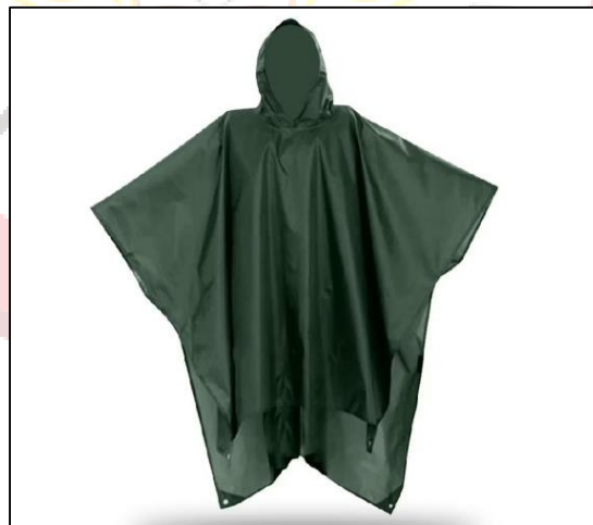
Gambar 11. Produk jas hujan we adventure

We adventure menyediakan jas hujan ponco bivak dengan kualitas tinggi yang anti air dan angin untuk memenuhi kebutuhan perlindungan cuaca agar tetap nyaman dan memberikan perlindungan optimal dalam berbagai kondisi selama pendakian gunung. Sewa jas hujan di we adventure dikenakan harga Rp. 10.000/hari.