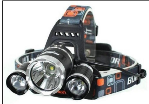
Gambar 22. Produk head lamp we adventure