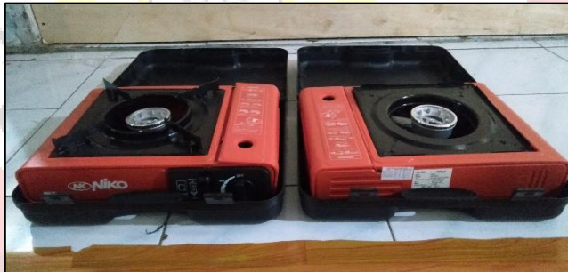
Gambar 14. Produk kompur portable we adventure

We adventure menyediakan kompor portable yang praktis dan efisien untuk kebutuhan memasak di alam bebas. Harga sewa kompor portable di we adventure yaitu Rp. 15.000/hari untuk ukuran kecil dan Rp. 25.000/hari untuk ukuran besar.