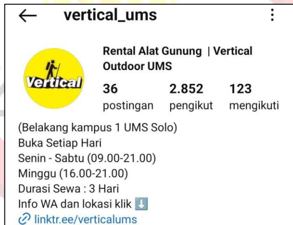
Gambar 43. IG Vertical Outdoor UMS

Vertical outdoor UMS menggunakan platform Instagram dengan nama (@vertical_ums) sebagai media promosi. Profil Instagram vertical outdoor menampilkan informasi penting seperti lokasi, jam operasional,