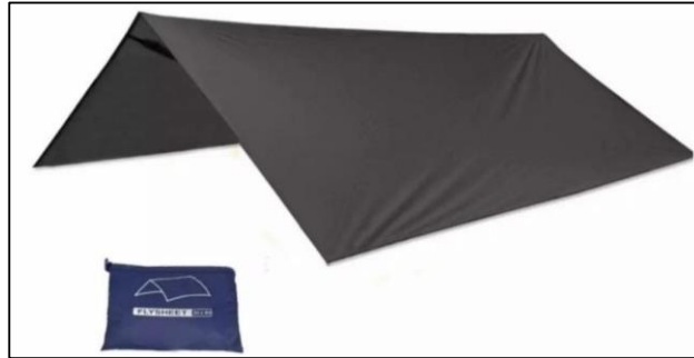
Gambar 18. Produk flysheet we adventure