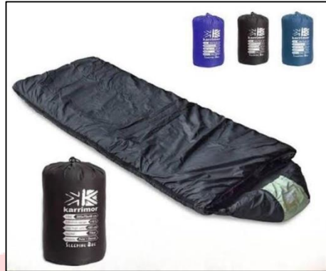
Gambar 13. Produk sleeping bag we adventure