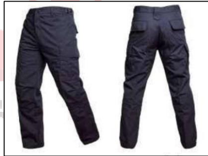
Gambar 28. Produk celana gunung we adventure

We adventure menyediakan celana gunung dengan berbagai ukuran untuk melindungi tubuh, menjaga kenyamanan, dan memudahkan beraktivitas saat pendakian gunung. Harga sewa celana gunung yaitu Rp. 15.000/hari.