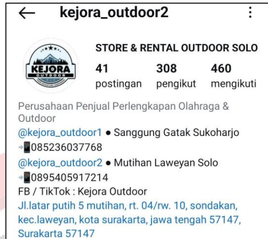
Gambar 37. IG Kejora Outdoor 2 Laweyan Solo

Media promosi yang digunakan kejora outdoor 2 berupa promosi melalui platform Instagram dengan nama (@kejora_outdoor2), Facebook dan Tiktok dengan nama Kejora Outdoor. Profil Instagram kejora outdoor menampilkan informasi kontak berupa nomor telepon yang dapat dihubungi dan alamat lengkap kejora outdoor 2 yang terhubung dengan Google Maps.