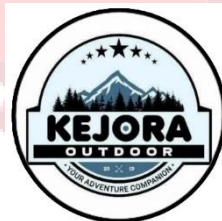
Gambar 35. Logo Kejora Outdoor 2 Laweyan Solo