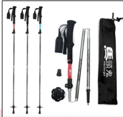
Gambar 20. Produk trekking pole we adventure