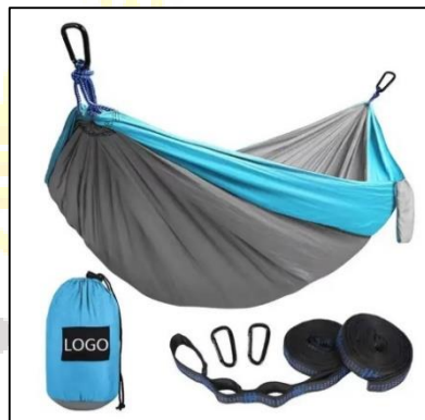
Gambar 19. Produk hammock we adventure

We adventure menyediakan hammock yang merupakan tempat tidur gantung terbuat dari kain dan tali yang dapat menahan beban maksimal 150kg. Harga sewa hammock di we adventure yaitu Rp. 10.000/hari.