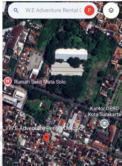
Gambar 8. Maps We Adventure Surakarta

We Adventure bergerak dalam bidang persewaan alat-alat outdoor khususnya alat pendakian gunung seperti hammock, carrier buckle, tenda, kompor portable, sleeping bag, sepatu gunung, jaket gunung dan peralatan lainnya. Barang-barang yang disewakan sangat berkualitas dalam kondisi yang prima dengan harga yang terjangkau, namun saat ini strategi pemasarannya yang digunakan masih terbatas melalui WhatsApp dan promosi dari mulut ke mulut di sekitar Surakarta.