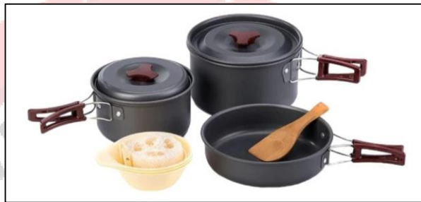
Gambar 17. Produk cooking set we adventure

We adventure menyediakan cooking set atau peralatan memasak yang terdiri dari panci, teflon, mangkuk, spatula, berfungsi untuk memasak makanan saat pendakian gunung dengan harga sewa Rp. 15.000/hari.