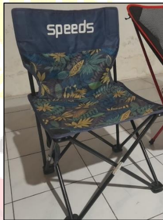
Gambar 23. Produk kursi lipat we adventure

We adventure menyediakan kursi lipat yang ringan, nyaman, dan mudah dibawa yang dapat digunakan untuk beristirahat di tengah perjalanan. Harga sewa kursi lipat yaitu Rp. 10.000/hari untuk satu buah kursi.