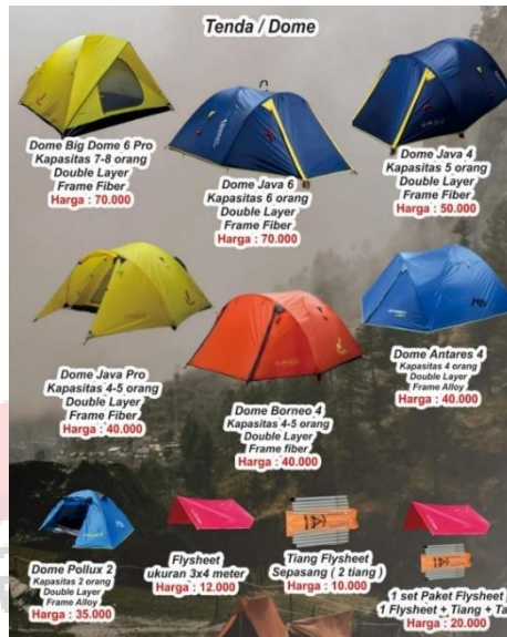
Gambar 40. Produk Vertical Outdoor UMS