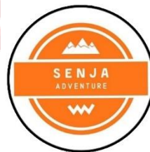
Gambar 30. Logo Senja Adventure Rental Outdoor Solo