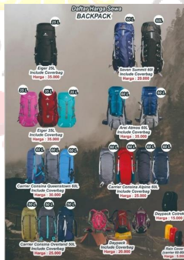
Gambar 39. Produk Vertical Outdoor UMS

Produk yang disewakan oleh vertical outdoor secara umum sama dengan produk yang disewakan oleh we adventure baik dari jenis dan spesifikasi peralatan pendakian gunung hingga harga yang relatif kompetitif. Berikut adalah beberapa peralatan pendakian gunung yang disewakan vertical outdoor ums yaitu: