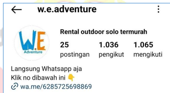
Gambar 29. IG We Adventure

We adventure menerapkan strategi promosi multi-platform untuk menjangkau target pasar yang lebih luas. Platform utama yang digunakan adalah Instagram dengan nama (@w.e.adventure). Profil Instagram tersebut menyediakan informasi kontak berupa nomor telepon yang dapat dihubungi oleh calon pelanggan untuk