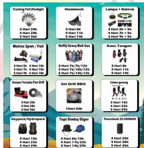
Gambar 31. Produk Senja Adventure Rental Outdoor Solo

Senja adventure menawarkan produk persewaan yang secara umum memiliki kesamaan dengan produk yang ditawarkan we adventure . Kesamaan tersebut mencakup jenis dan spesifikasi peralatan pendakian gunung. Berikut adalah produk yang disewakan oleh senja adventure: