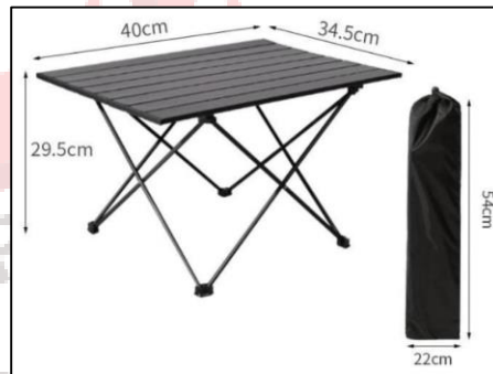
Gambar 24. Produk meja lipat we adventure

We adventure menyediakan meja lipat yang praktis dan mudah dibawa untuk keperluan makan atau sekedar meletakkan barang bawaan. Harga sewa meja lipat di we adventure yaitu Rp. 15.000/hari.