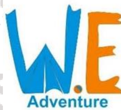
Gambar 6. Logo We Adventure (Sumber: dokumentasi perusahaan, 2016)

We Adventure merupakan sebuah Usaha Kecil dan Menengah (UMKM) yang bergerak di bidang persewaan alat pendakian gunung sejak tahun 2016, yang berlokasi di Jl. Adi Sucipto, Gang Markisa II No. 20 Karangasem Rt 02/Rw 08, Kecamatan Laweyan, Kota Surakarta, Jawa Tengah 57145, dengan nomor telepon 085725698869.