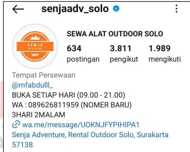
Gambar 34. IG Senja Adventure Rental Outdoor Solo

Media promosi yang digunakan senja adventure berupa promosi melalui Instagram dengan nama (@senjaadv_solo) sebagai platform utama. Profil Instagram tersebut menampilkan informasi mengenai jam operasional, nomor kontak yang dapat dihubungi dan alamat lengkap senja adventure yang terhubung dengan Google Maps.