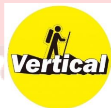
Gambar 38. Logo Rental Alat Gunung Vertical Outdoor UMS