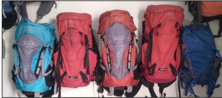
Gambar 10. Produk tas carrier we adventure