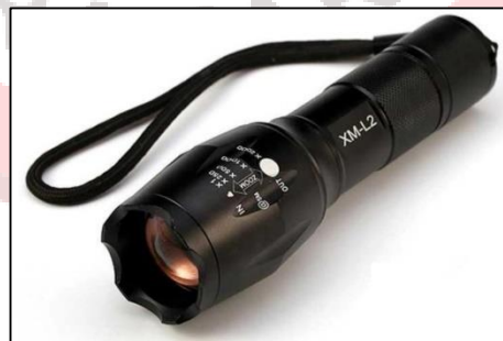
Gambar 25. Produk senter we adventure

We adventure menyediakan senter yang tahan lama dan tahan cuaca untuk keperluan penerangan saat pendakian gunung dengan harga sewa Rp. 15.000/hari.