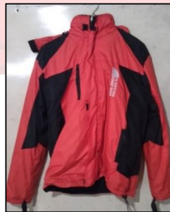
Gambar 27. Produk head lamp we adventure

We adventure menyediakan jaket gunung berkualitas dengan berbagai ukuran untuk melindungi tubuh dari suhu dingin, angin, hujan, dan kelembapan saat pendakian gunung. Jaket gunung yang disediakan we adventure memiliki harga sewa Rp. 20.000/hari.