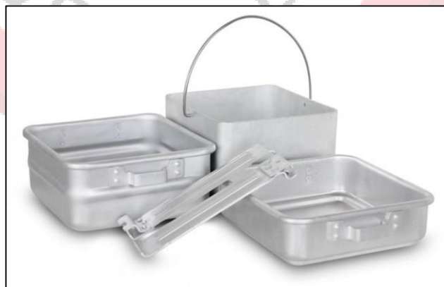
Gambar 16. Produk nesting we adventure

We adventure menyediakan nesting yang ringan, ringkas dan mudah dibawa untuk meminimalisir beban pendakian. Nesting berfungsi sebagai peralatan memasak saat pendakian gunung dengan harga sewa Rp.10.000/hari.