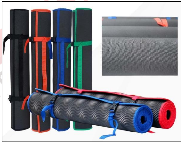
Gambar 12. Produk matras we adventure

Matras digunakan untuk alas tidur di dalam tenda ketika sedang berkemah. Produk matras yang disediakan oleh we adventure memiliki beragam warna yang dapat dipilih dengan harga sewa Rp. 5.000/hari.