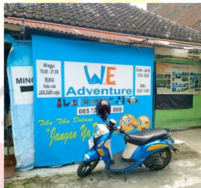
Gambar 7. Lokasi We Adventure Surakarta (Sumber: dokumentasi penulis, 2025)