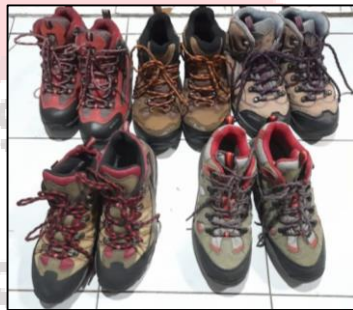
Gambar 26. Produk sepatu gunung we adventure

We adventure menyediakan sepatu gunung dengan berbagai ukuran yang berkualitas, tahan air, nyaman, dan siap untuk segala medan pendakian gunung. Harga sewa sepatu gunung di we adventure bervariasi mulai dari Rp. 35.000/hari hingga Rp. 40.000/hari untuk sepasang sepatu gunung.