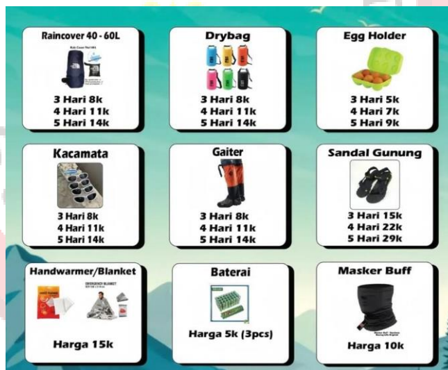
Gambar 33. Produk Senja Adventure Rental Outdoor Solo