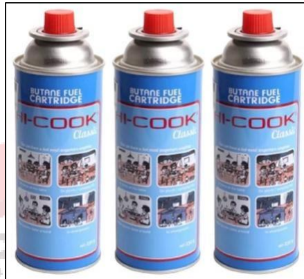
Gambar 15. Produk gas portable we adventure

Harga gas potrable yang ditawarkan we adventure adalah Rp. 7.000 untuk satu tabung gas portable .