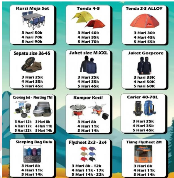
Gambar 32. Produk Senja Adventure Rental Outdoor Solo