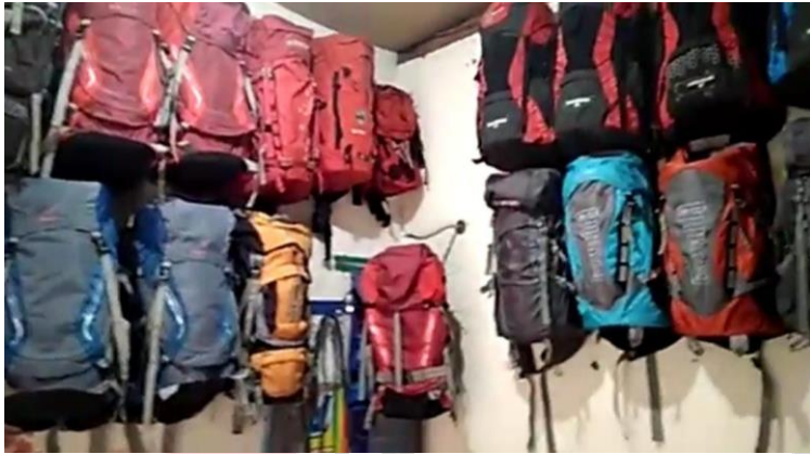
Lampiran 1. Kondisi Tempat Persewaan We Adventure