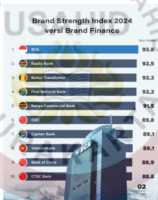
Gambar 1.2 Brand Strength Index 2024

masa pandemi, BCA terus mengalami peningkatan laba bersih secara signifikan. Pertumbuhan ini mencerminkan peningkatan profitabilitas dan efisiensi dalam pengelolaan aset dan modal. Profitabilitas sendiri merupakan indikator penting dalam menilai kemampuan bank dalam menghasilkan laba bersih serta memengaruhi persepsi dan nilai merek sebuah institusi keuangan. Bank BCA dan bank lainnya harus secara cermat mengelola dan memantau likuiditas, solvabilitas, dan profitabilitas mereka.