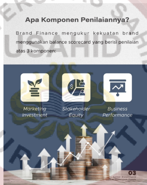
Gambar 1.3 Komponen Penilaian

konsistensi pelayanan yang diberikan kepada para nasabah, kemampuan bank dalam menghadirkan inovasi produk yang relevan dan sesuai dengan kebutuhan zaman, hingga tingkat keamanan serta perlindungan yang disediakan bagi nasabah dalam melakukan transaksi maupun menyimpan dana. Semua elemen ini saling berhubungan dan dapat menentukan persepsi publik terhadap suatu bank, yang pada akhirnya berpengaruh pada skor BSI yang diperoleh.