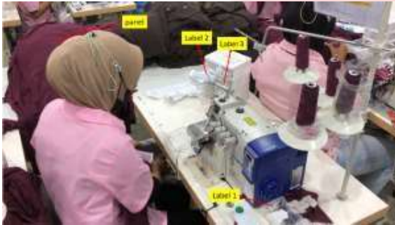
Gambar 2. Penempatan label sebelum redesign

Setelah melakukan analisis therblig dan pengukuran waktu, kemudian mendesain ulang tata letak kerja seperti penempatan panel dan label.