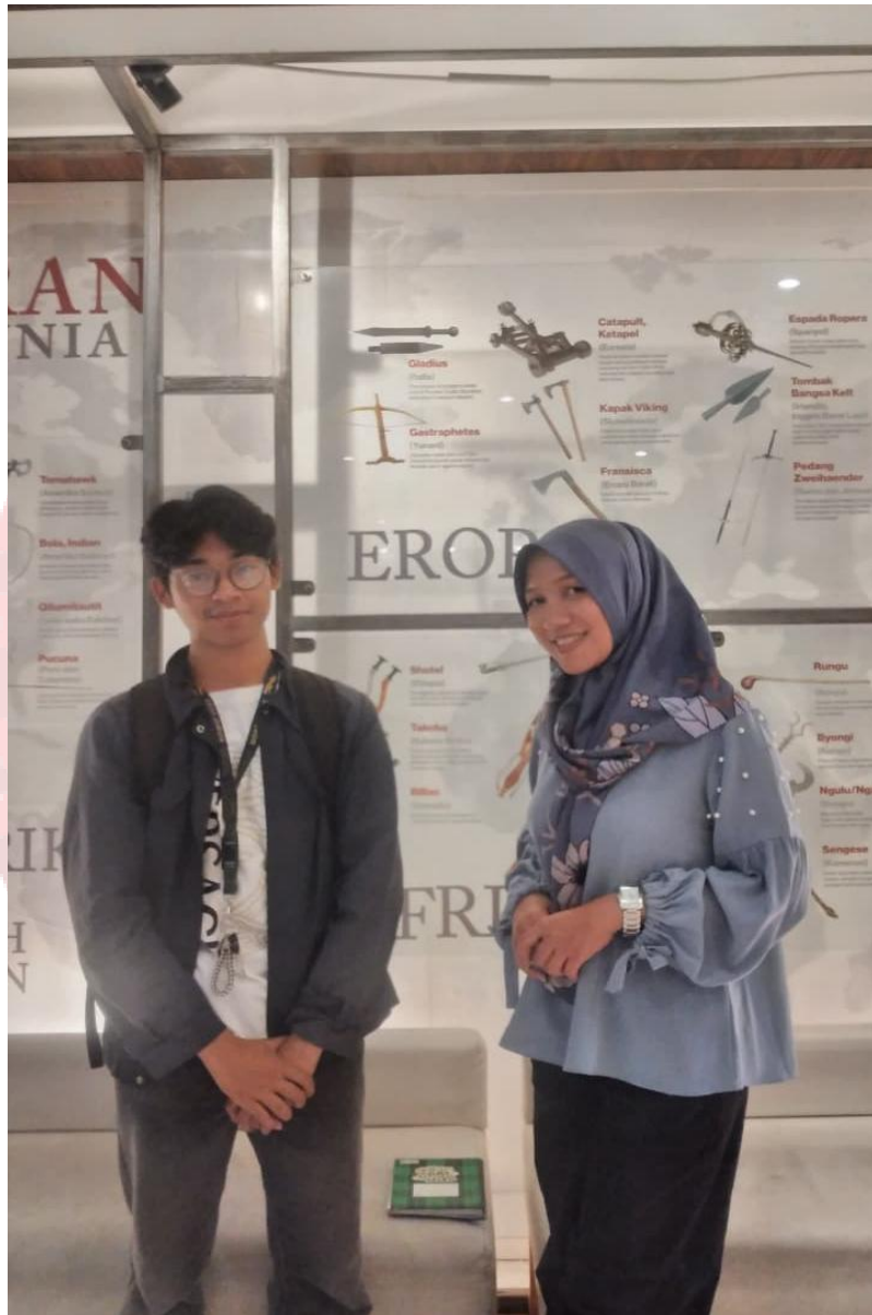
Gambar 2. Dokumentasi dengan tour guide Museum Keris Nusantara