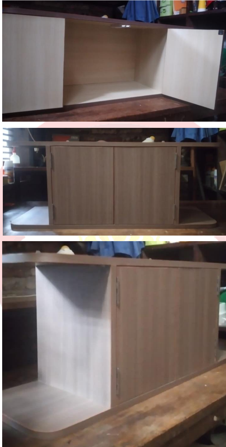
Gambar 6. Dokumentasi produk furniture kabinet TV