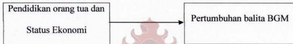
Gambar 2. Kerangka Konsep