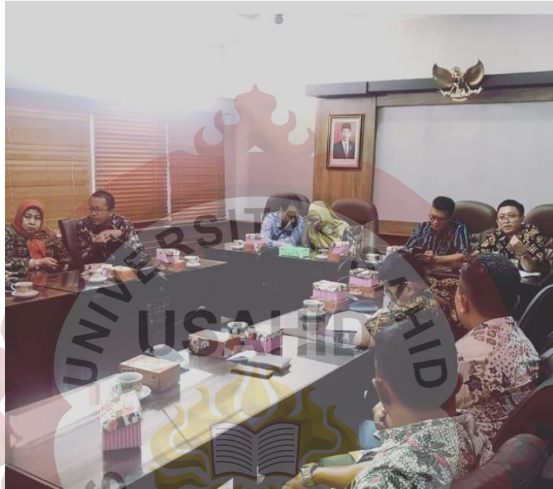
Foto Dokumentasi Sosialisasi Aplikasi E Notulen