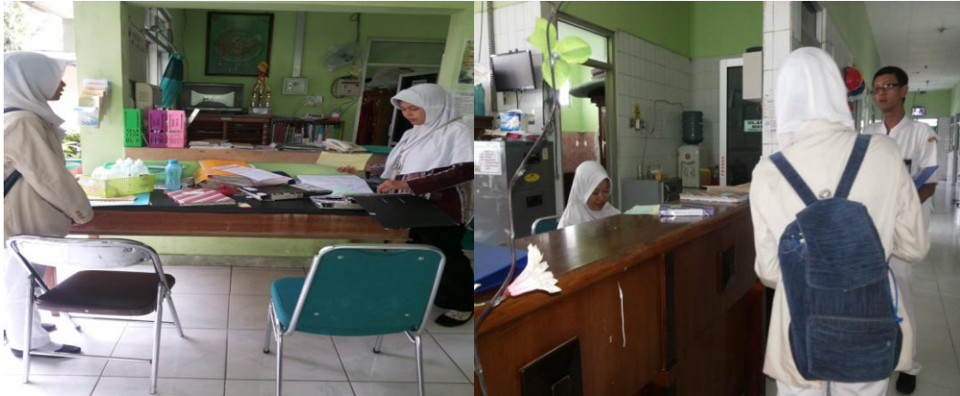
Dokumentasi permohonan izin kepada Kepala Ruang