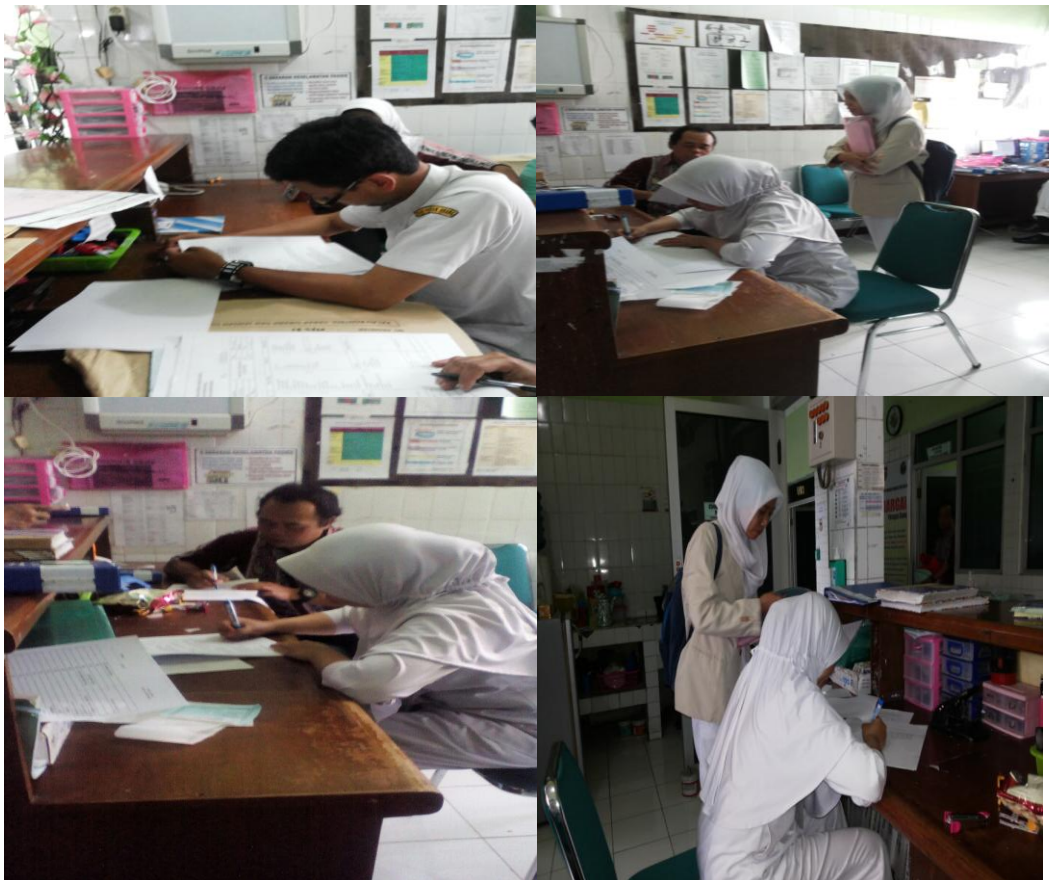
Dokumentasi pengisian questioner