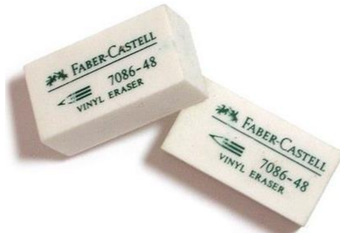
Gambar. 7 Contoh penghapus