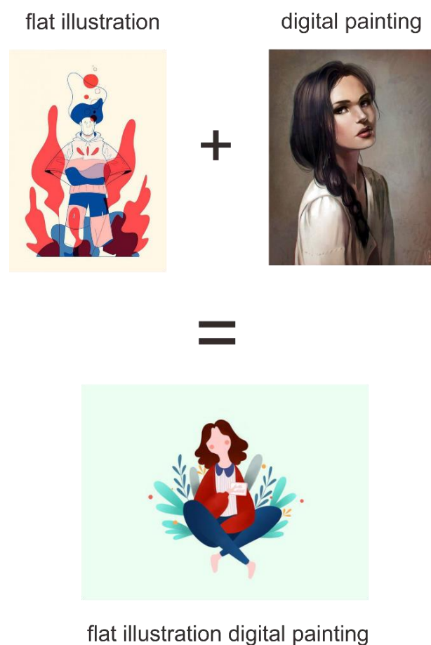
Gambar. 5 Flat illustration digital painting

Dengan gaya desain flat illustration dan digabungkan dengan teknik digital painting yang akan menghasilkan gambar yang unik serta pewarnaan yang sederhana namun terlihat tetap menarik.