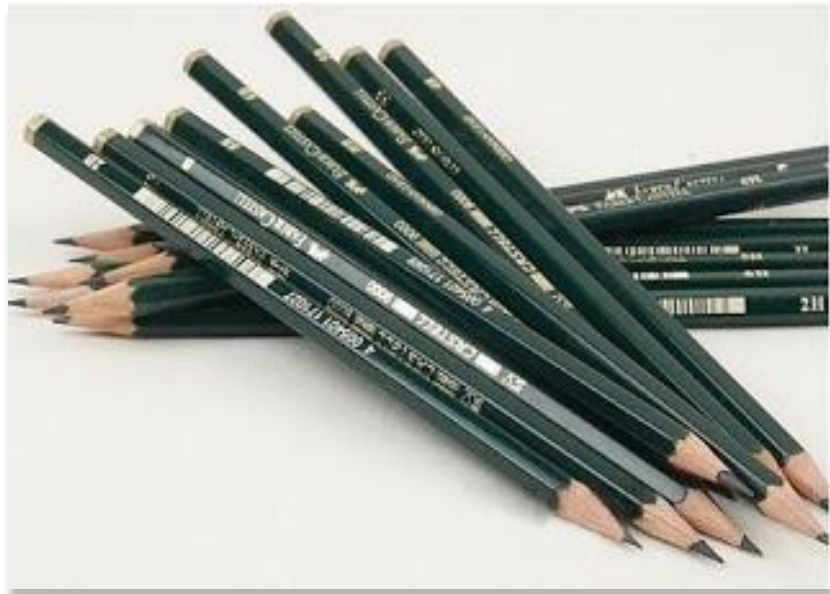
Gambar. 6 Contoh pensil