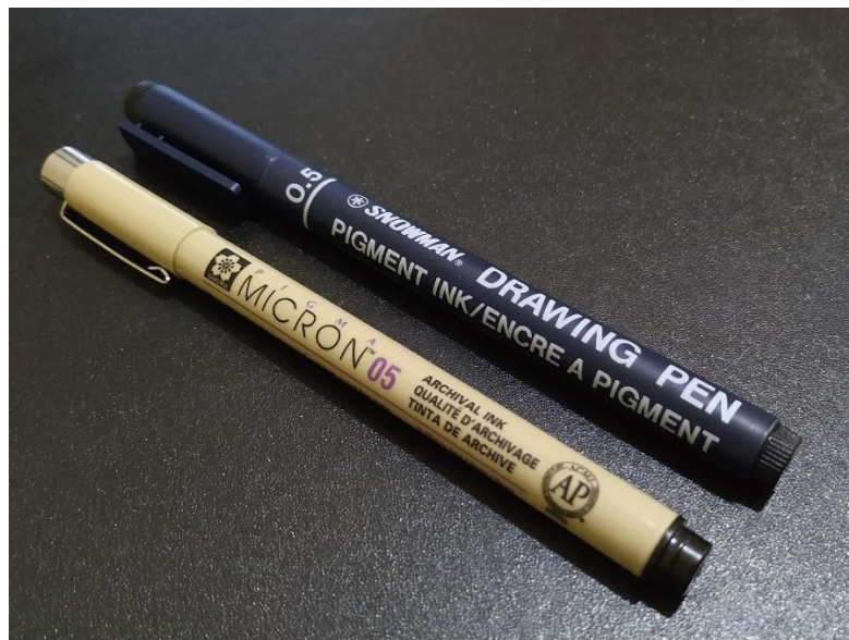
Gambar. 8 Contoh drawing pen (sumber : https://clumsyyellow.com/2019/05/07/pen-review-snowman-drawing-pen-vs-sakura-pigma-micron/ )