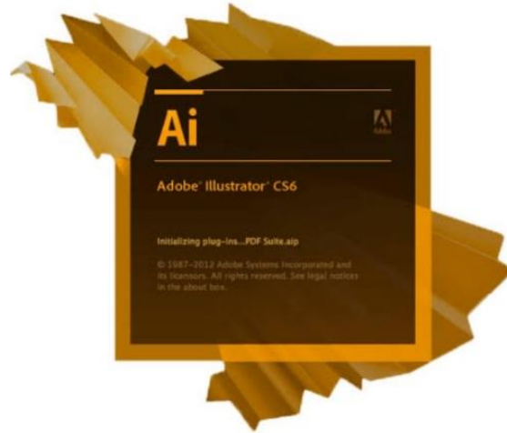
Gambar 10 contoh logo Adobe Illustrator CS 6