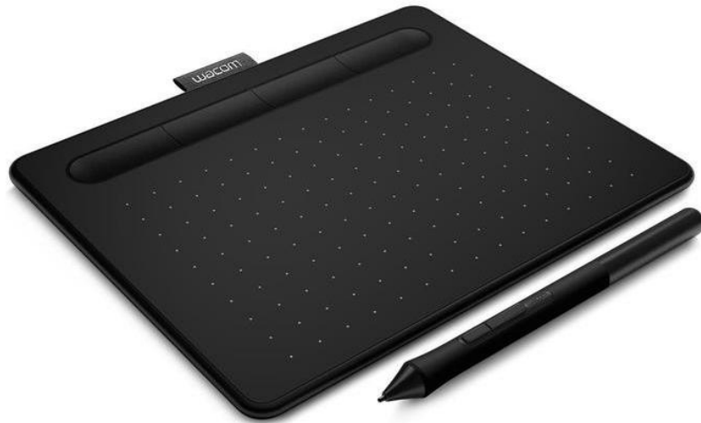
Gambar. 9 Contoh pen tablet wacom

Dan di proses menggunakan komputer / laptop Lenovo dengan spesifikasi sebagai berikut :