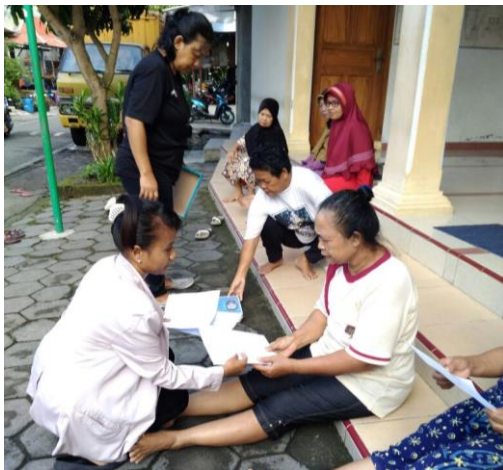
Peneliti Mengadakan Pre Test dengan MMSE