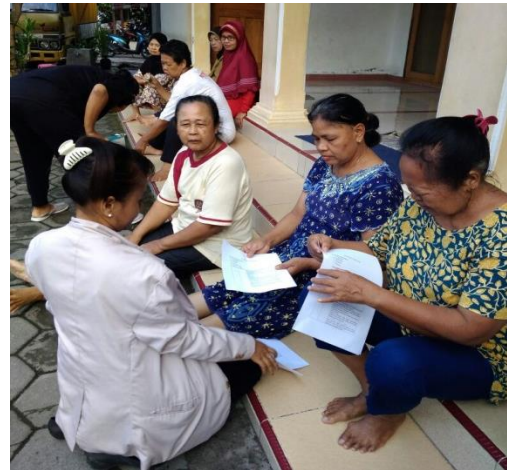
Peneliti Memberikan Surat Pernyataan Kesiediaan Menjadi Responden