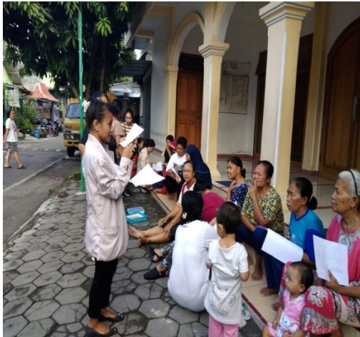
Peneliti Memberikan Pengarahan tentang Tujuan Diadakan Penelitian