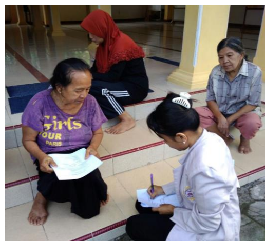
Peneliti Mengadakan Post Test dengan MMSE