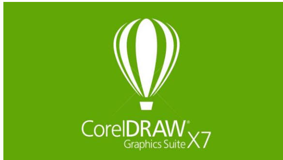
Gambar 15. Coreldraw (darkraven57.blogspot.com.2016)

Corel Draw adalah salah satu program komputer desain grafis yang sudah banyak di kenal dan di gunakan oleh pada desainer grafis profesional. Program ini di buat oleh Corel.Corel Draw memiliki kegunaan untuk mengolah gambar, oleh karena itu banyak di gunakan pada pekerjaan di dalam bidang publikasi, percetakan atau pekerjaan di bidang lain yang membutuhkan proses Visualisasi. Dalam proses pembuatan desain buku ini menggunakan corel draw x7 sebagai software yang digunakan untuk melayout, membuat tipografi, ilustrasi.