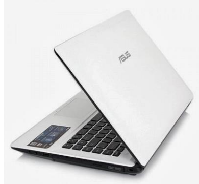
Gambar 11. Leptop asus

Peralatan yang di gunkan untuk membuat dan mengedit dengan bantuan aplikasi perangkat lunak didalamnya. Leptop ini memiliki spesifikasi antara lain menggunakan prosesor Dual Core AMD APU E-1 2500 (1MB, 1,4GHz) sistem operasi DOS grafis yang melengkapi yakni AMD Redoen HD 8240