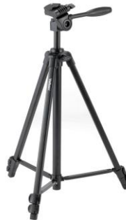
Gambar 14. Tripot

Alat yang digunakan untuk menjaga keseimbangan agar gambar tetap dapat stabil atau tidak miring, selain itu di gunakan juga untuk mengurangi guncangan pada gambar yang sedang di bidik.