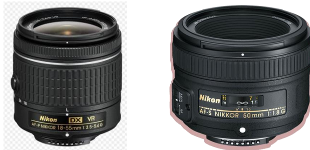
Gambar 13. Lensa,