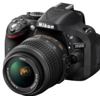
Gambar 12. Kamera Nikon

Alat ini di gunakan untuk pengambilan gambar pada setiap objek yang di pilih. Kamera sendiri merupakan alat yang menggunakan system cermin otomatis untuk meneruskan cahaya lensa menuju pembidik.