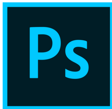
Gambar 16. Adobe Photoshop cs6

Adobe Photoshop merupakan aplikasi yang di gunakan untuk mengedit suatu gambar, atau photo secara profesional. baik di gunakan