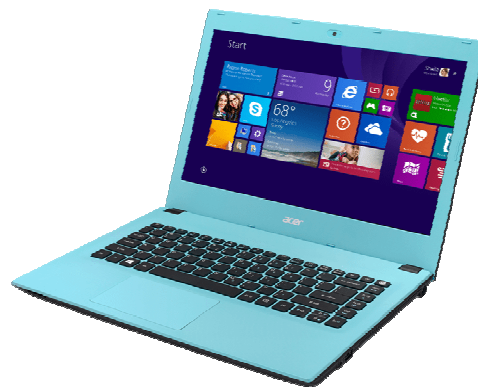
Gambar 11. Acer Aspire E 14

https://demsangeles.com/2015/07/pr-acer-aspire-e14/ (19 Januari 2021)