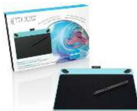
Gambar 12. Wacom Intuos Art

https://ambassador.com.ph/products/mobile-devices/tablet/wacom-intuos-art-cth490-k0--cth690/1024 (19 Januari 2021)