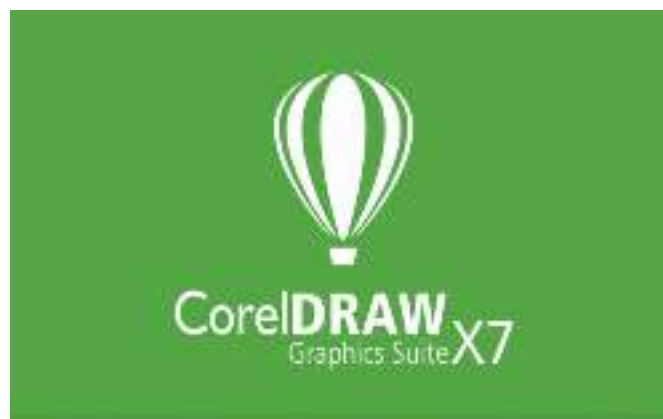
Gambar 14. Corel Draw X7