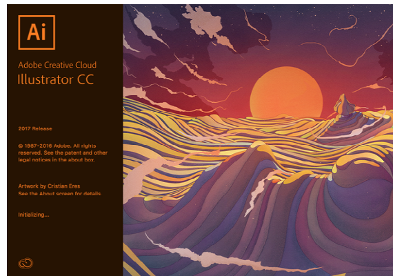
Gambar 13. Adobe Illustrator CC 2017

https://cumamodaltulisan.wordpress.com/2016/11/12/review-adobe-illustrator-cc-2017/ (19 Januari 2021)