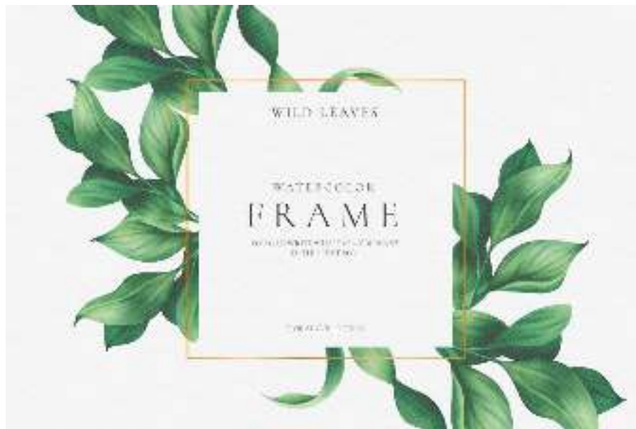
Gambar 6. Contoh frame layout

bingkai tersebut menjadi tema dalam design yang digunakan. dimana border/bingkai/frame nya membentuk suatu naratif (mempunyai cerita) yang mewakili suasana dari design.