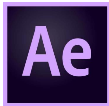
Gb.41 – Adobe After Effect CC 2019

Adobe After Effect merupakan software pengolahan video juga, namun saat proses produksi hanya digunakan sebagai software pendukung. Software ini digunakan untuk membuat effect/motion title pada video company profile The Alana Hotel Solo karena software tersebut lebih menekankan pada pembuatan effect video. Software yang digunakan pada proses editing ini menggunakan versi Adobe After Effect CC 2019 .