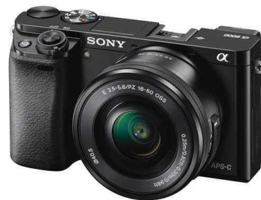
Gb.37 – Kamera Mirrorless Sony A6000

Alat utama pengambilan gambar video yang digunakan adalah Kamera Mirrorless. Menggunakan Kamera Mirrorless merk Sony A6000 karena kamera jenis ini cukup baik untuk pengambilan gambar cinematic video pada saat proses Produksi.