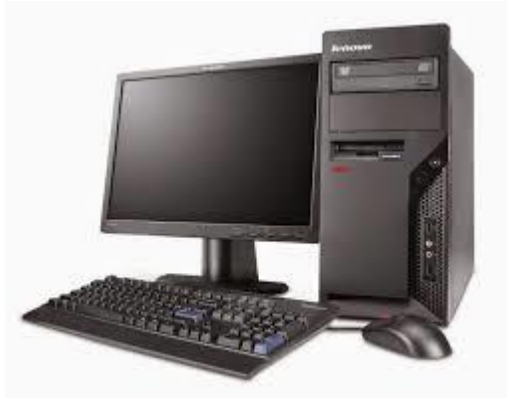
Gb.39 – Personal Computer Sumber (Google.co.id)