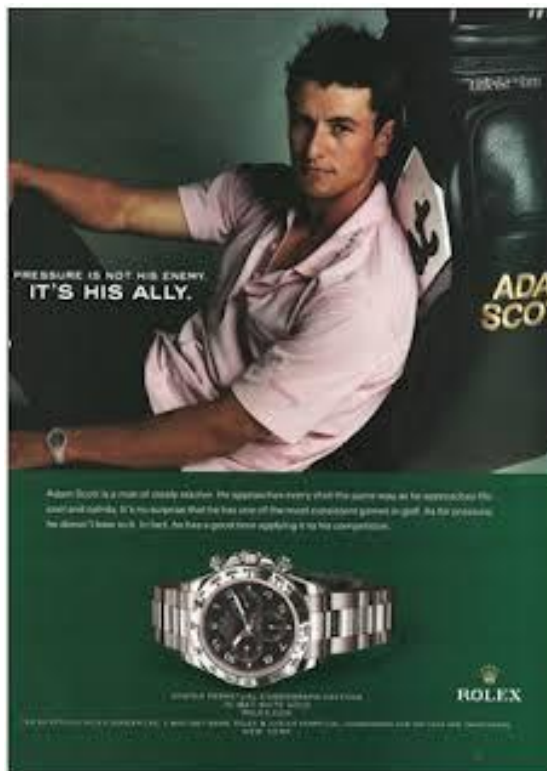
Gb.32 – Contoh Layout Picture Window