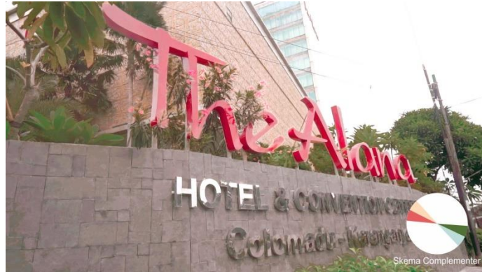
Gb.34 – Tampilan warna video