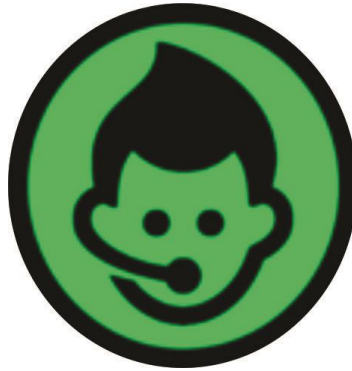
Gb.45 – Narator's voice