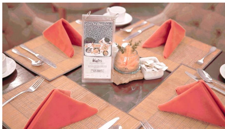
Gb.36 – Contoh Ilustrasi Realis dalam video

Ilustrasi pada video company profile The Alana Hotel Solo menggunakan Jenis ilustrasi Realis / Naturalis. Ilustrasi realis yaitu ilustrasi yang menggambar sesuai dengan keadaan yang sebenarnya, baik dari segi proporsi dan anatomi terlihat seperti objek aslinya. Penggunaan ilustrasi jenis ini sangat cocok untuk cinematic video karena akan memperlihatkan kesan yang minimalis, elegan, mewah, modern, dari The Alana Hotel Solo sebagai sarana media promosi berupa company profile.