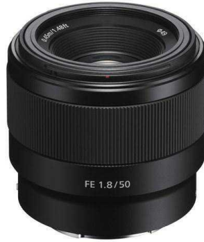
Gb.38 – Lensa Fix Sony FE 50mm F1.8

video. Pemilihan lensa tersebut lebih digunakan untuk shoot suasana dan footage objek yang terkesan luas.