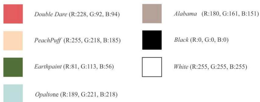
Gb.33 – Pallet warna