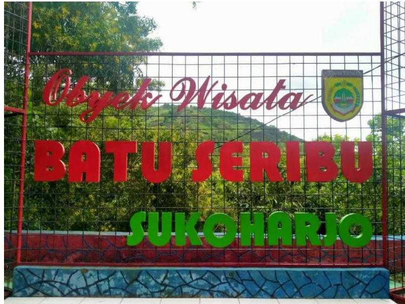
Gambar 2. Obyek Wisata Batu Seribu Sukoharjo. Sumber : Thaufik Clinton Sudarman (10 Oktober 2020)