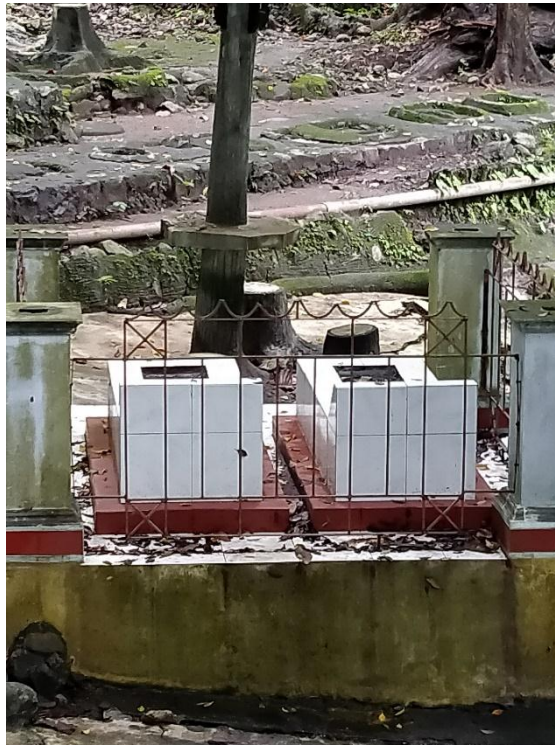
Gambar 3. Makam Ki Gathok dan Nyi Lanjar Sumber : Thaufik Clinton Sudarman (10 Oktober 2020)

Obyek wisata Batu Seribu dahulu bernama obyek wisata Pacinan. Nama Pacinan berasal dari cerita asal usul daerah pacinan itu sendiri. Pacinan berasal dari kata Pacing yang berarti sejenis rumput-rumputan yang banyak tumbuh di daerah itu.